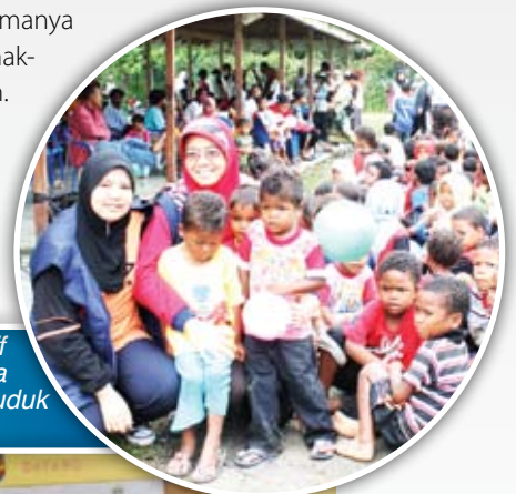
YBhg. Pn. Norwatiim Abdul Latiff (dua dari kiri) meluangkan masa beramah mesra bersama penduduk RPS Air Banun.

Program selama tiga hari dua malam ini diakhiri dengan sukaneka bersama penduduk RPS Air Banun. Pelbagai acara sukan dipertandingkan dan mendapat sambutan yang sangat menggalakkan terutamanya golongan belia dan kanak-kanak RPS Air Banun. Semoga Program Bakti Siswa ini diteruskan oleh pelajar-pelajar MKM pada masa akan datang.