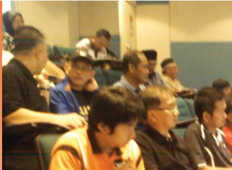
Warga KOTAMAS Miri yang menghadiri program.