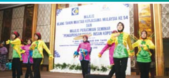
Persembahan kebudayaan oleh pelajar dari Kumpulan Seni Budaya MKM.