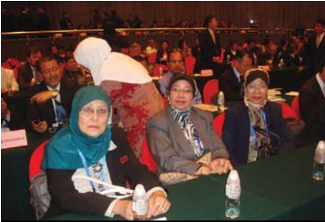
Perwakilan Malaysia di Persidangan ICA.