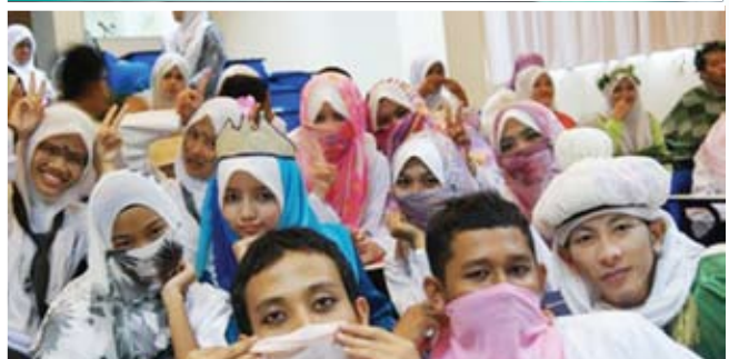
Suasana ceria sepanjang pertandingan lakonan.