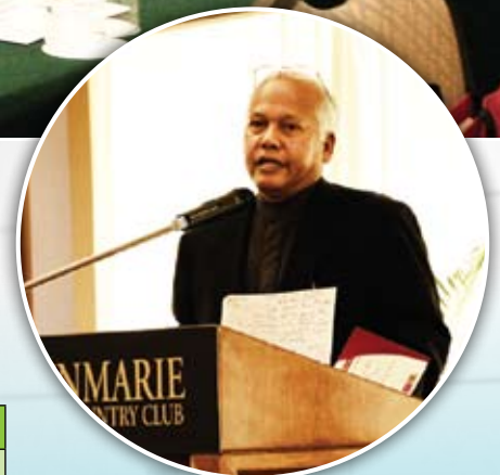
YBhg. Dato' Mangsor bin Saad ketika menyampaikan ucapan perasmian.