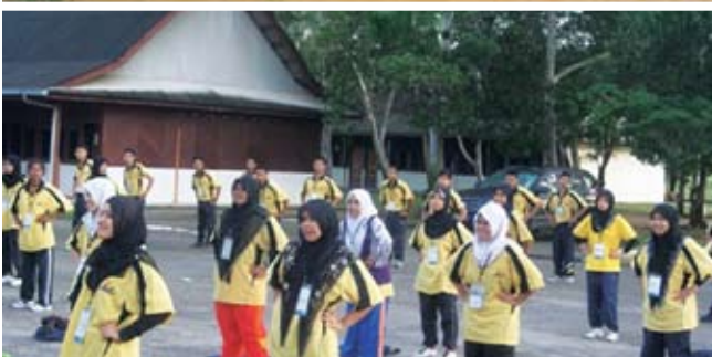
Senaman pagi di Kem Kuala Kubu Bharu, Selangor.