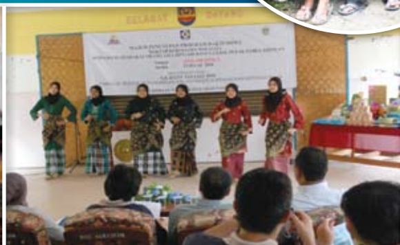
Persembahan kebudayaan oleh Kumpulan Seni Budaya Pelajar MKM.