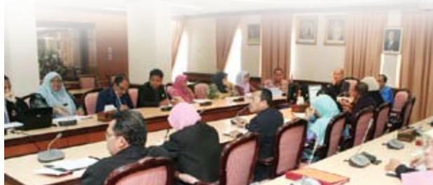
Sesi taklimat di Bilik Mesyuarat Anggerik.