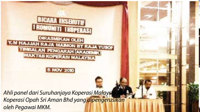
Ahli panel dari Suruhanjaya Koperasi Malaysia, Koperasi Opah Sri Aman Bhd yang dipengerusikan oleh Pegawai MKM.