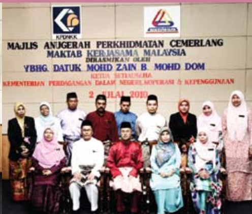
Penerima Anugerah Pengarah dan Anugerah Khidmat Setia dan Berjasa.