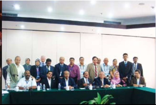
Sebahagian peserta mesyuarat HRD.

Penyertaan delegasi Malaysia ke Persidangan International Cooperative Alliance (ICA) di Beijing, China pada 1-5 September 2010 adalah untuk mengambil bahagian dalam program berikut :