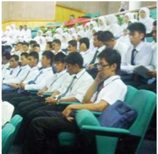
Pelajar di Auditorium Dato' A. Majid.