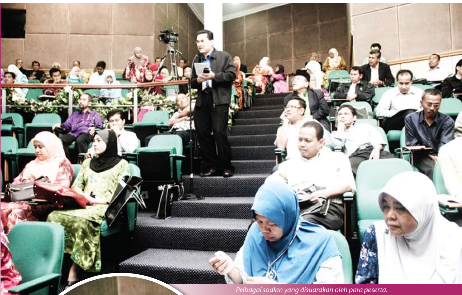
Pelbagai soalan yang disuarakan oleh para peserta.

Seramai 170 orang peserta telah menyertai bicara eksekutif ini yang terdiri daripada anggota lembaga dan tenaga kerja koperasi dari sekitar Lembah Klang, Pahang, Perak, Negeri Sembilan, Melaka dan Johor. Turut hadir sama adalah wakil daripada Kementerian Perdagangan Dalam Negeri, Koperasi dan Kepenggunaan dan ANGKASA.