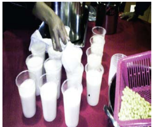
Air soya yang telah dihasilkan dan amat berkhasiat untuk kesihatan.