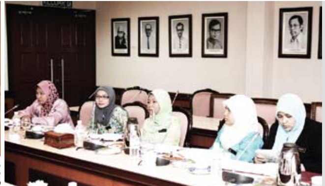
Para pegawai Pusat Antarabangsa dan Pendidikan Tinggi yang hadir dalam sesi perbincangan.

Badan Kemajuan Industri Brunei (BINA) adalah agensi utama bagi menggalakkan dan menyelaraskan pembangunan dalam sektor perindustrian dan perkoperasian di Brunei Darussalam. Perkhidmatan-perkhidmatan yang luas disediakan BINA termasuk membekalkan maklumat mengenai peluang-peluang pelaburan serta membantu menyediakan ruang latihan kepada para koperasi di sana.