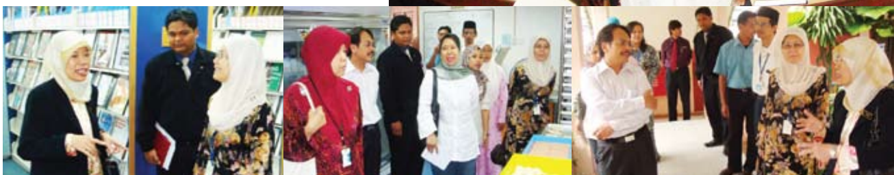
Sepanjang lawatan ke perpustakaan, bakeri Koperasi Kakitangan MKM dan sekitar perkarangan MKM.