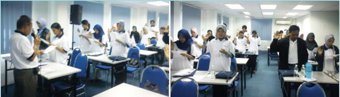
Bacaan ikrar oleh pelajar Sijil Pengurusan Koperasi sesi Julai 2010.

Pendaftaran pelajar Sijil Pengurusan Koperasi (SPK) Sesi Julai 2010 telah diadakan pada 31 Julai 2010 di Maktab Kerjasama Malaysia Cawangan Sarawak (MKMCS). Seramai 35 orang pelajar telah mendaftar. Minggu Orientasi Program SPK ini diadakan pada 31 Julai 2010 sehingga 1 Ogos 2010. Program SPK memulakan pengambilannya pada Februari 2006 yang merupakan usaha Maktab Kerjasama Malaysia (MKM) ke arah melengkapkan gerakan koperasi di negeri Sarawak dengan ilmu pengetahuan dan kemahiran yang komprehensif dalam persekitaran yang kompetitif pada masa kini. Program ini dikendalikan secara separuh masa untuk tempoh satu setengah tahun di kampus MKMCS.