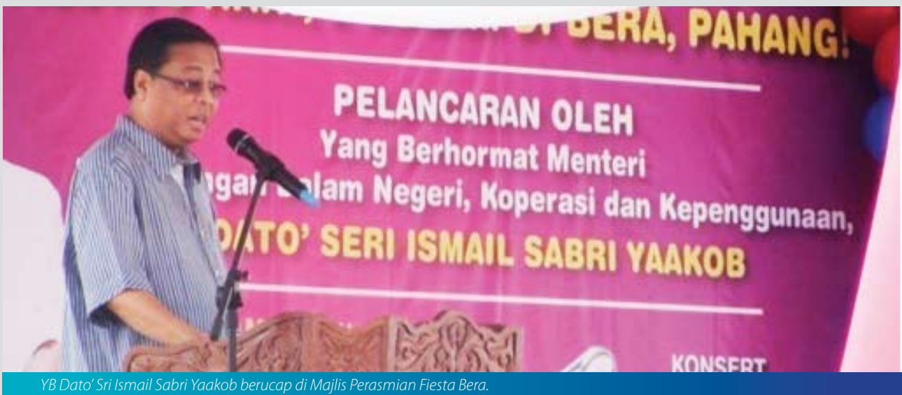
YB Dato' Sri Ismail Sabri Yaakob berucap di Majlis Perasmian Fiesta Bera.