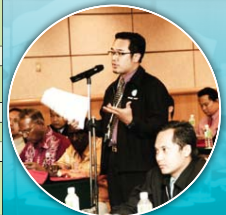
Peserta mengajukan soalan ketika sesi soal jawab.