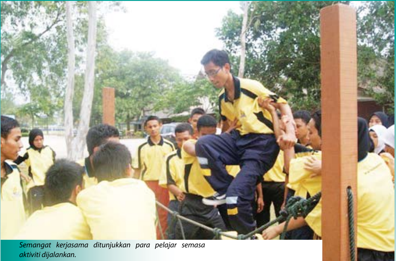
Semangat kerjasama ditunjukkan para pelajar semasa aktiviti dijalankan.