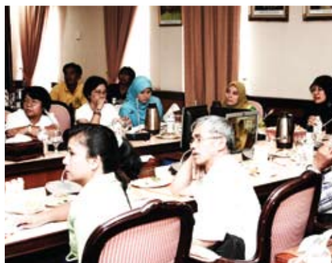
Sesi tayangan video korporat sedang berlangsung sambil dihayati para delegasi yang hadir.