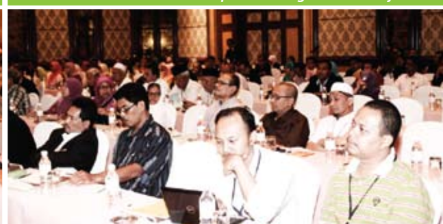
Warga koperator dari seluruh Malaysia yang hadir.