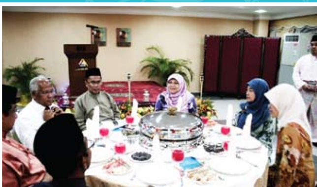
Tetamu kehormat yang turut hadir.