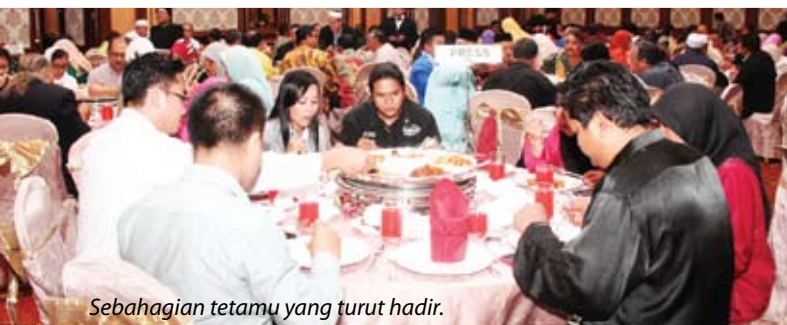
Sebahagian tetamu yang turut hadir.

Beliau turut menggesa 7,215 koperasi yang berdaftar di negara ini meningkatkan lagi pengetahuan, memperkayakan modal insan serta kemahiran yang tinggi jika mahu digelar sebuah negara yang berpendapatan tinggi. Sektor koperasi yang disasarkan menjadi enjin pertumbuhan ekonomi ketiga negara turut berperanan penting dalam menjayakan program tersebut dengan mengambil bahagian dalam National Key Economic Areas (NKEA). Menerusi pendidikan dan latihan yang berterusan serta berkualiti, sektor koperasi mampu mewujudkan peluang pekerjaan kepada kira-kira 6.7 juta ahlinya di seluruh negara.