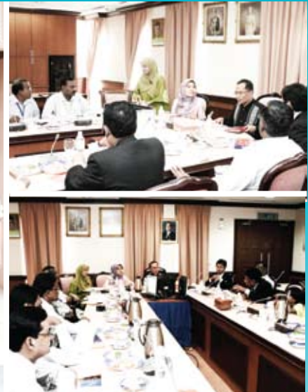
Sesi dialog di antara MKM dan para delegasi sedang berlangsung.