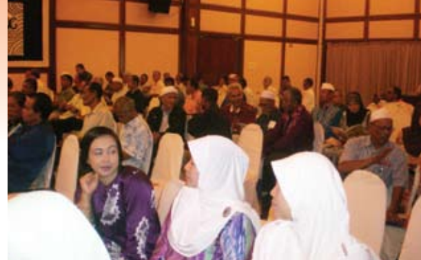
Sambutan yang amat menggalakkan daripada peserta di Wilayah Utara.

Cinta Sayang Golf & Country Resort di Sungai Petani, Kedah adalah sebuah destinasi yang tidak asing lagi di kalangan rakyat tempatan. Lokasinya yang strategik iaitu di tengah-tengah bandar Sungai Petani menjadi pilihan Maktab Kerjasama Malaysia (MKM) Wilayah Utara dan Suruhanjaya Koperasi Malaysia (SKM) Negeri Kedah sebagai penganjur bersama untuk menjayakan sebuah program Bicara Tokoh ini.