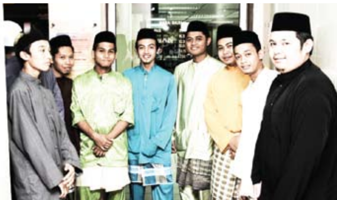
Para pelajar turut serta dalam majlis tersebut.