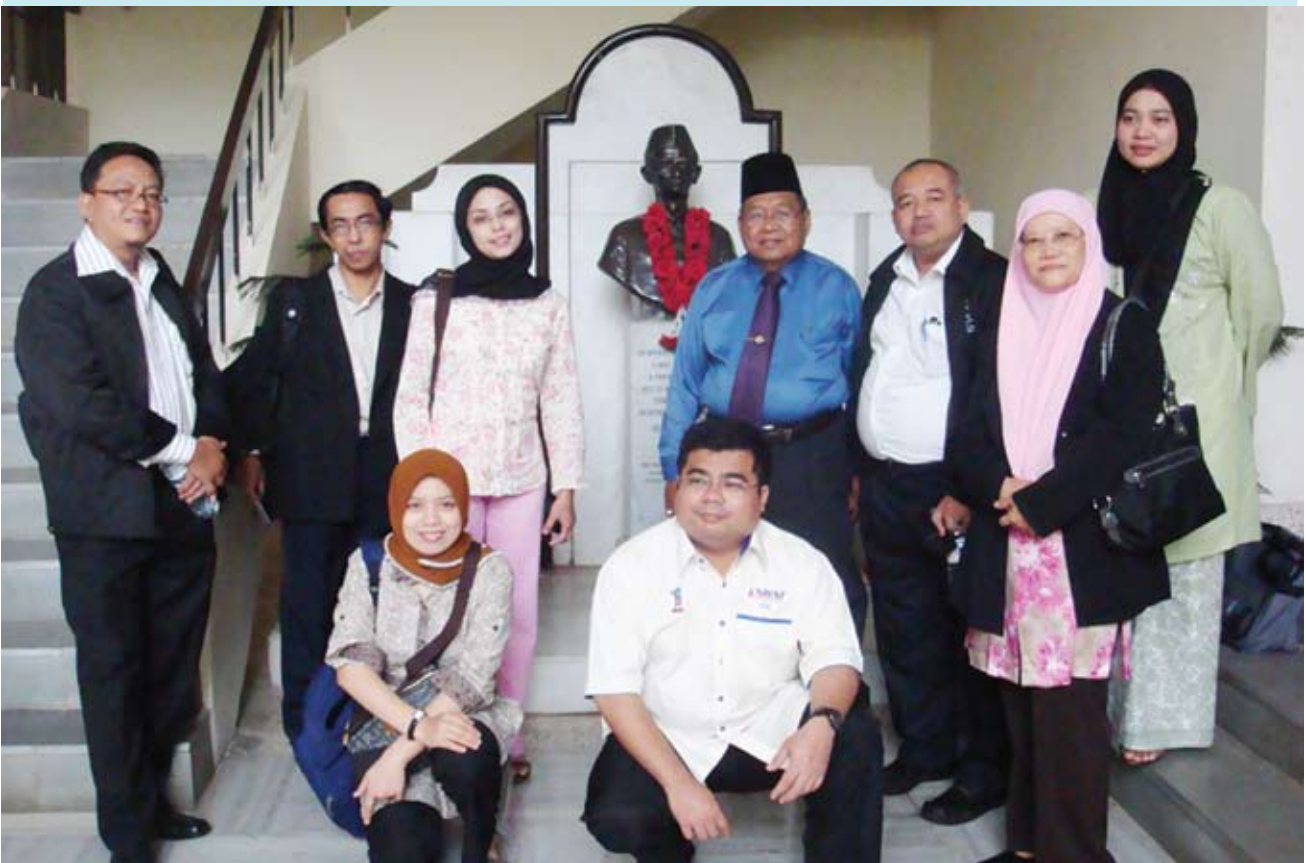
Pegawai-pegawai MKM, SKM, ANGKASA, KOPRO dan KOBARU bergambar di hadapan Vaikunth Mehta Institute, India.

Pada tahun 2009 Maktab Kerjasama Malaysia (MKM) telah memeterai Memorandum Persefahaman (MoU) dengan Vaikunth Mehta Institute (VAMNICOM), India. Lanjutan daripada memorandum persefahaman ini maka MKM telah bekerjasama dengan VAMNICOM untuk menjalankan satu program latihan serta lawatan sambil belajar yang bertajuk ‘Retailing and Distribution Management’. Program ini adalah yang pertama kali diadakan selepas MoU ditandatangani.