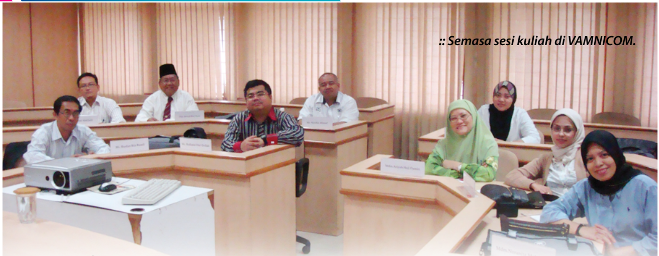
:: Semasa sesi kuliah di VAMNICOM.

Objektif program ini diadakan adalah untuk memberi pendedahan dan kefahaman mengenai perjalanan pengurusan peruncitan dan saluran pengagihan dalam perniagaan di India. Program ini telah dijalankan selama 14 hari bermula dari 26 Julai sehingga 08 Ogos 2010. Seramai sembilan peserta telah menghadiri program ini yang terdiri daripada 2 orang pegawai Maktab Kerjasama Malaysia(MKM), 3 orang pegawai Suruhanjaya Koperasi Malaysia(SKM), 2 orang pegawai Angkatan Koperasi Kebangsaan Malaysia(ANGKASA), seorang daripada Koperasi Pelaburan Pekerja Proton Berhad(KOPRO) dan seorang daripada Koperasi Kobaru Berhad(KOBARU).