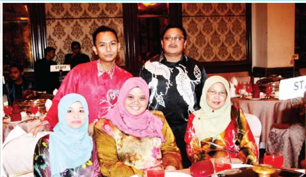
Antara kakitangan MKM yang turut hadir.