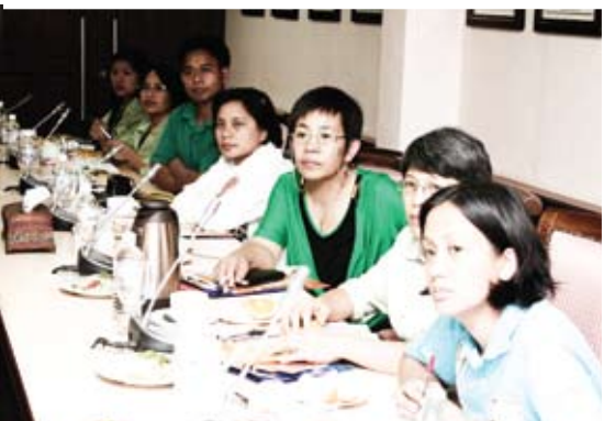
Para delegasi sedang khusyuk mendengarkan taklimat MKM.

Para delegasi telah dibawa melawat sekitar MKM untuk memberi visual yang jelas berkaitan kemudahan-kemudahan yang terdapat di kampus MKM seperti perpustakaan, dewan auditorium, bilik-bilik kuliah, bilik siber, kafeteria dan sebagainya.