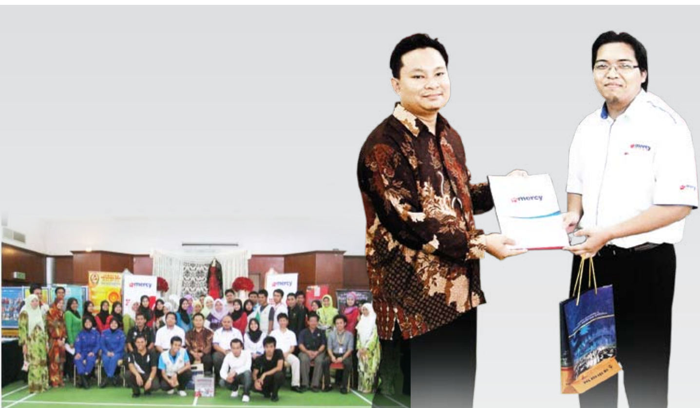
Para pempamer yang turut menyertai pameran dan jualan.