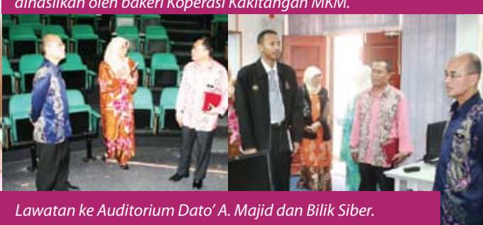
Lawatan ke Auditorium Dato' A. Majid dan Bilik Siber.