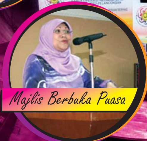
Majlis Berbuka Puasa