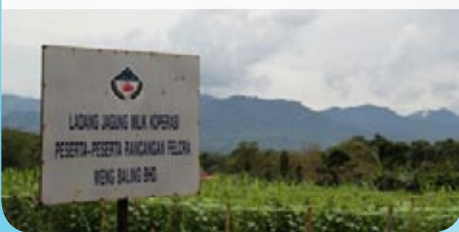
Ladang Koperasi Peserta Felcra Weng Baling Berhad pelbagai Tanaman

Secara keseluruhannya penanaman kaedah fertigasi merupakan pertanian moden yang mampu menjanakan keuntungan dan berdaya maju kepada koperasi. Selain itu aspek pengurusan yang cekap, ilmu pengetahuan dan kemahiran perlu dimiliki oleh setiap pengusaha bagi memastikan kejayaan dalam penanaman secara fertigasi. - Salwana -