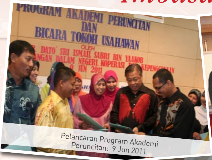
Pelancaran Program Akademi Peruncitan: 9 Jun 2011