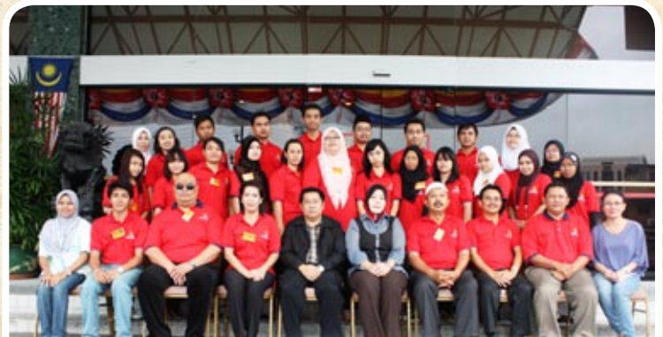
Pelajar SPK Ambilan Jun 2011