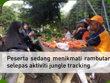
Peserta sedang menikmati rambutan selepas aktiviti jungle tracking