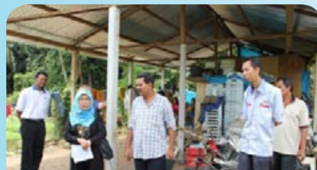
Lawatan ke Koperasi Bela Rakyat (KOBERA) Bayu Baling Berhad - pelbagai tanaman