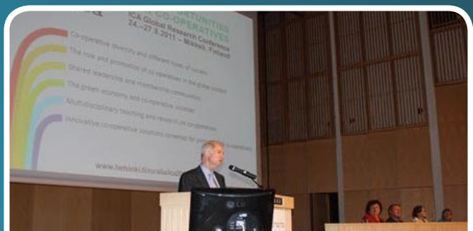
Perasmian ICA Research Conference