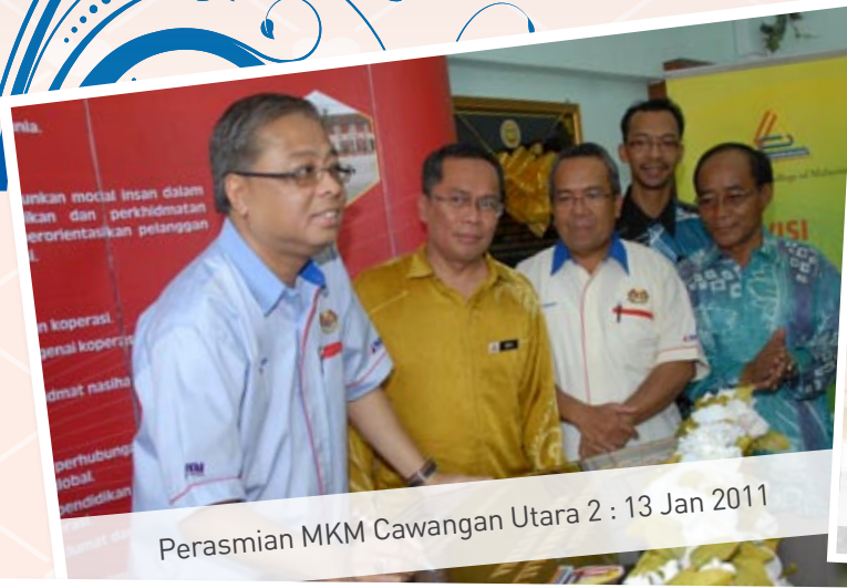
Perasmian MKM Cawangan Utara 2 : 13 Jan 2011