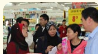
Meninjau produk keluaran Quanbao Supermarket