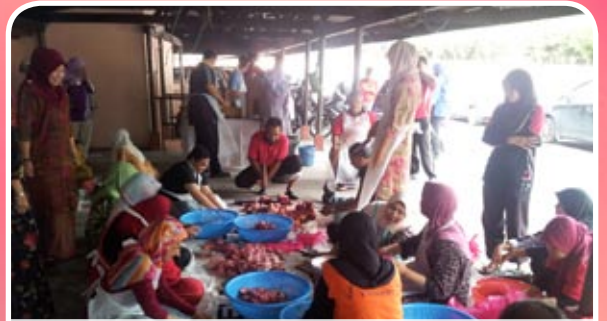
Warga kerja MKM sedang bergotong royong memotong daging korban

Sehubungan itu Badan Kebajikan Kakitangan Islam MKM telah mengambil inisiatif menguruskan ibadah korban bagi kakitangan Maktab Koperasi Malaysia yang diadakan pada 9 November 2011 bersamaan dengan 13 Zulhijjah 4132 iaitu bersamaan dengan hari Tasrik ketiga. Sebanyak 3 ekor lembu telah dikorbankan di mana sepertiga bahagian digunakan untuk jamuan, sepertiga lagi diagih-agihkan kepada warga MKM dan sepertiga lagi diagihkan kepada rumah anak yatim dan orang miskin di sekitar Lembah Klang. Semoga program ini akan dapat diteruskan ditahun-tahun akan datang bagi menegakkan syiar Islam dengan melaksanakan ibadah berkorban untuk meningkatkan darjat takwa kita terhadap Allah SWT.