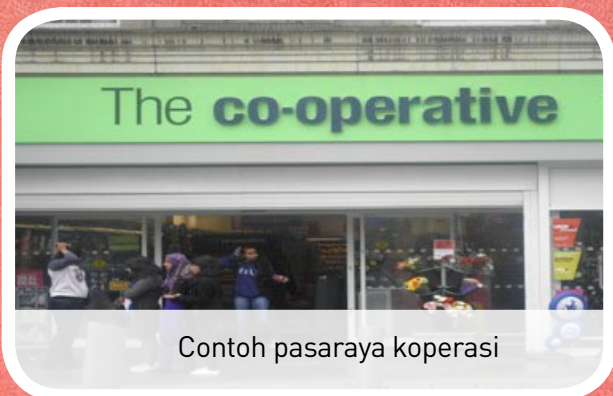
Contoh pasaraya koperasi