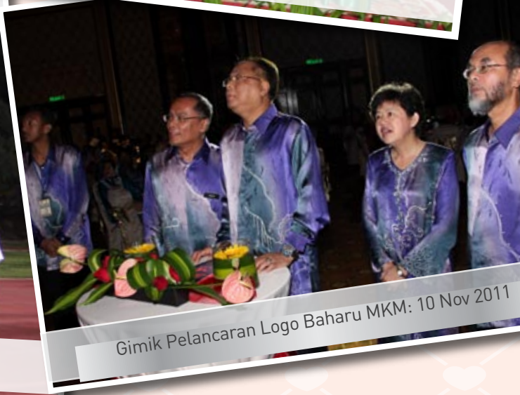
Gimik Pelancaran Logo Baharu MKM: 10 Nov 2011