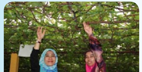
Lawatan ke Ladang Anggur di Sik, Kedah