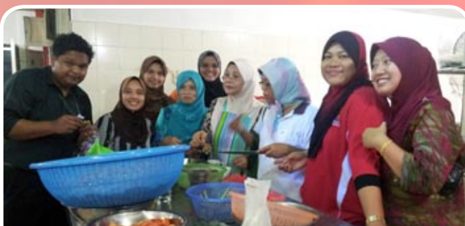
Warga kerja MKM sedang bergotong royong memasak daging korban untuk jamuan makan tengahari