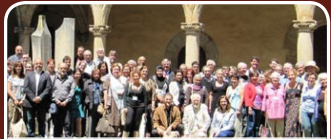
Gambar berkumpul dengan semua peserta