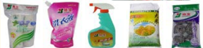
Produk jenama Quanbao