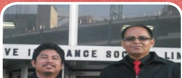
Di hadapan Cooperative Group Manchester