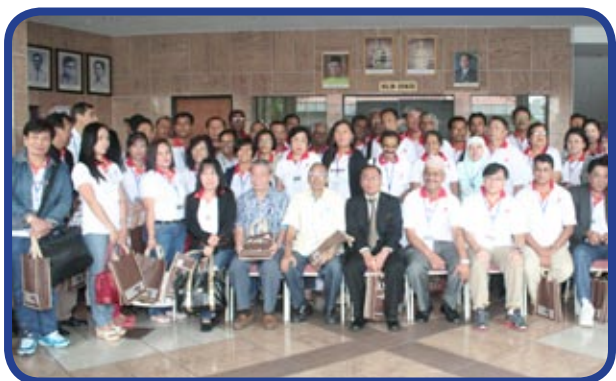
Sesi pemberian cenderamata sebagai tanda kenangan