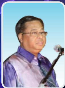
YB. Dato' Sri Ismail Sabri bin Yaakob Menteri Perdagangan Dalam Negeri, Koperasi dan Kepenggunaan (KPDNKK)

“Dalam menjangkau usia 5 dekad, MKM bukan sahaja hanya dikenali sebagai institusi latihan koperasi terunggul di rantau ini, malah pengalaman serta kemahiran yang dikumpulkan membolehkannya menjadi pusat rujukan para koperator dalam dan luar negara”