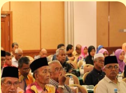
Para koperator dari pelbagai koperasi