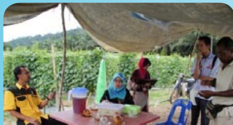
Temu bual bersama Pengurus Projek