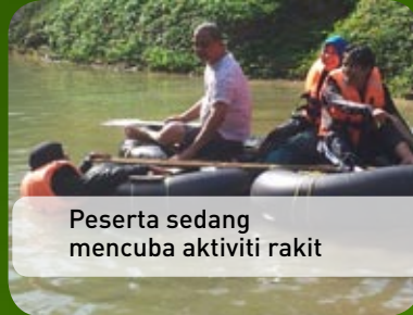
Peserta sedang mencuba aktiviti rakit