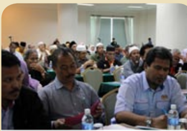
Fokus apa yang disampaikan