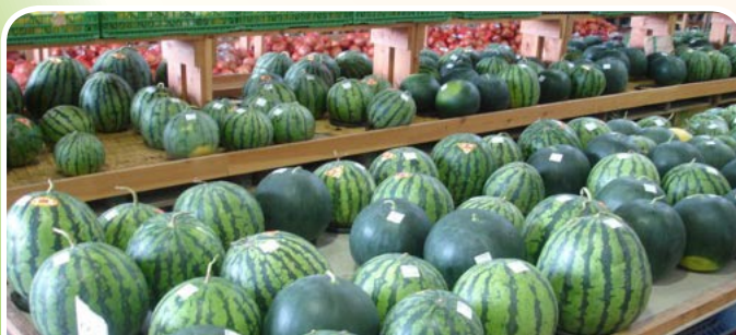
Produk yg dipasarkan di kedai (Direct Sales Shop) milik JA KANAGAWA