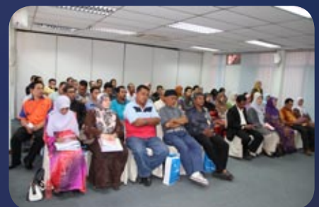
Sekitar majlis berlangsung