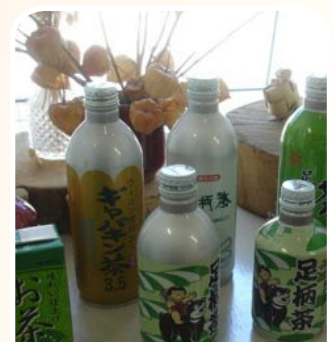
Produk minuman Green Tea yang dikeluarkan oleh JA KANAGAWA