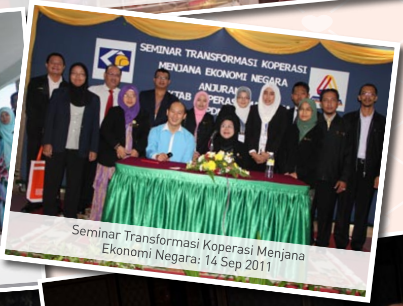
Seminar Transformasi Koperasi Menjana Ekonomi Negara: 14 Sep 2011