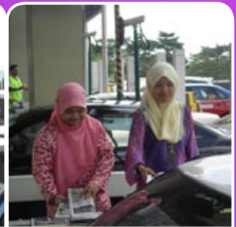
Kakitangan MKM sedang mengedarkan akhbar Utusan Malaysia kepada pengguna Plaza Tol Batu 3, Shah Alam