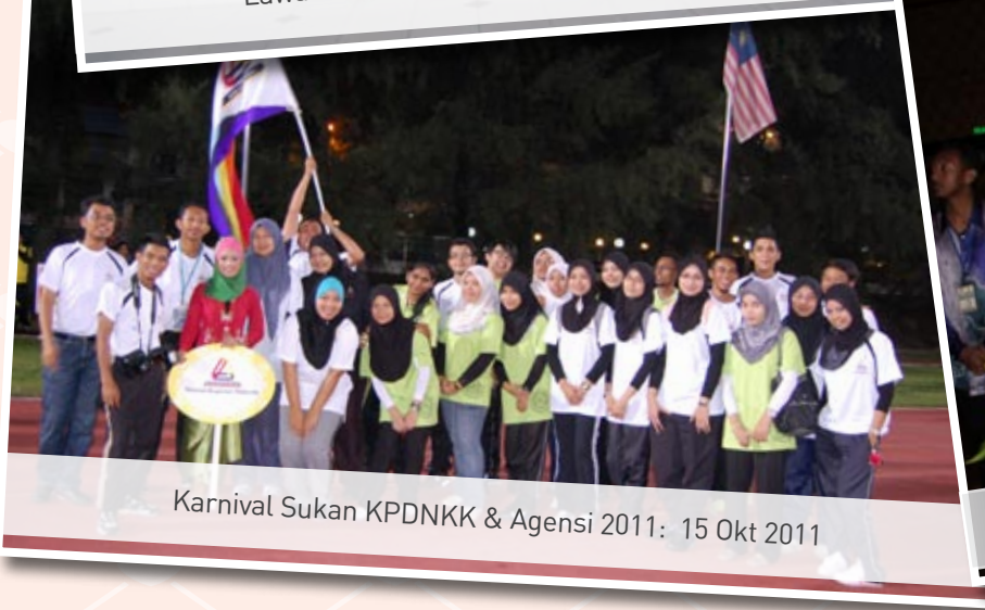
Karnival Sukan KPDNKK & Agensi 2011: 15 Okt 2011