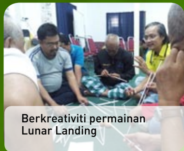
Berkreativiti permainan Lunar Landing