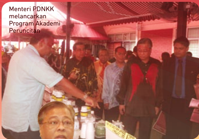
Menteri PDNKK melancarkan Program Akademi Peruncitan