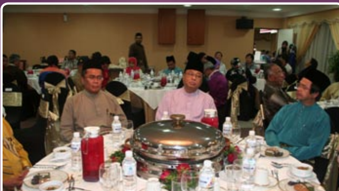
Antara tetamu jemputan yang hadir