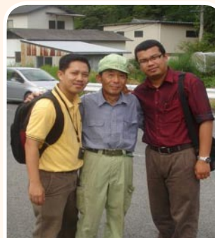
Bersama dengan anggota koperasi mengusahakan tanaman Teh Hijau.

Sepanjang kursus ini kami telah mempelajari dan memperoleh banyak pengalaman. Di sini kami menyimpulkan bahawa terdapat beberapa faktor yang menyumbang kepada kejayaan sektor pertanian yang dimonopoli oleh JA Zenchu antaranya ialah keyakinan anggota kepada kepakaran yang dimiliki oleh JA Zenchu, ketersediaan semua perkhidmatan berkaitan pertanian yang ditawarkan oleh JA Zenchu, jaminan oleh JA Zenchu ke atas produk pertanian yang dihasilkan oleh anggota koperasi, harga produk pertanian yang ditawarkan kepada petani (anggota koperasi) adalah tinggi berbanding yang ditawarkan oleh pihak swasta serta provokasi pihak kerajaan terhadap produk pertanian yang diimport, serta keberkesanan kempen belian produk pertanian dengan tema pembelian produk pertanian yang segar dan selamat. - Ju Shamsudin -