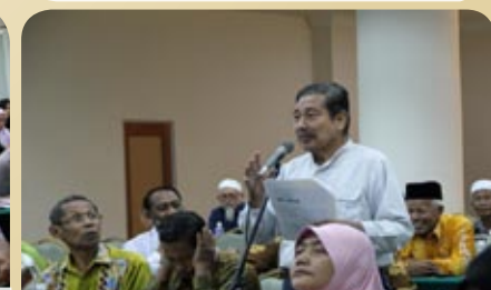
Peserta teruja mengemukakan soalan