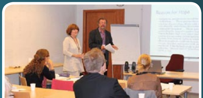
Sesi pembentangan hasil penyelidikan