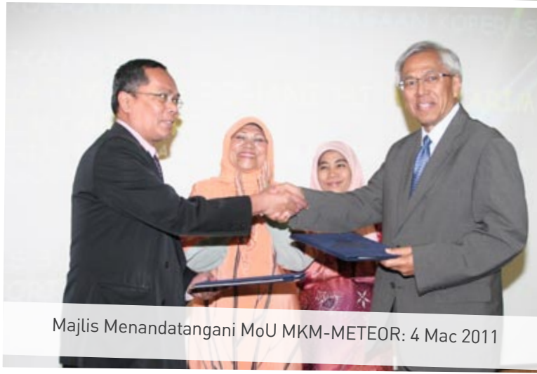
Majlis Menandatangani MoU MKM-METEOR: 4 Mac 2011