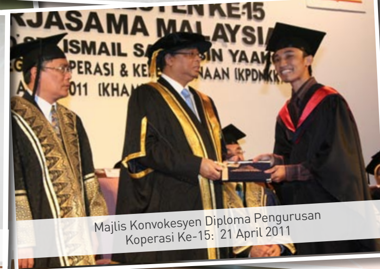
Majlis Konvokesyen Diploma Pengurusan Koperasi Ke-15: 21 April 2011