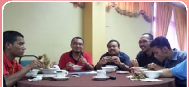
Warga kerja MKM sedang menikmati jamuan minum pagi sup tulang