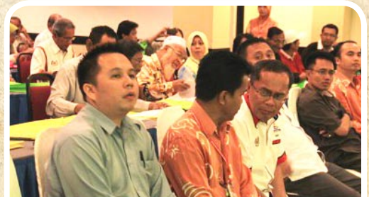
Ketua Pengarah MKM tiga dari kiri bersama-sama dengan para hadirin yang menyertai program tersebut