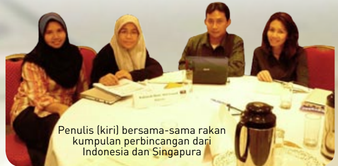
Penulis (kiri) bersama-sama rakan kumpulan perbincangan dari Indonesia dan Singapura