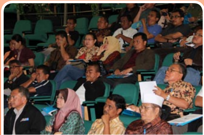
Sebahagian para delegasi yang hadir