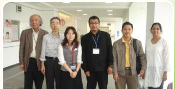
Lawatan ke makmal R&D JA KANAGAWA