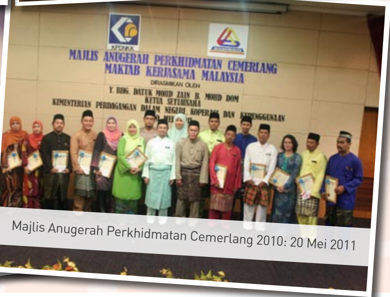
Majlis Anugerah Perkhidmatan Cemerlang 2010: 20 Mei 2011