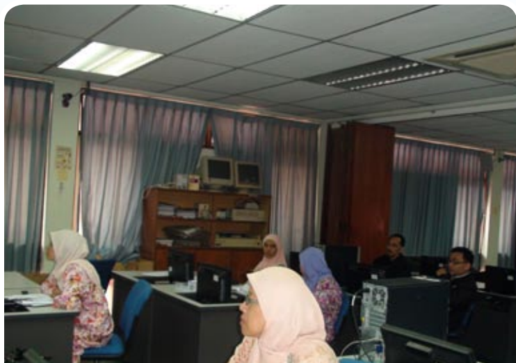
Sebahagian Pegawai Latihan MKM yang menghadiri kursus

Semua bentuk aktiviti atau perniagaan pada zaman teknologi pada masa kini bergantung sepenuhnya kepada Internet. Perkara yang penting dalam pemilihan aplikasi yang disediakan di Internet adalah, pertimbangkan cara terbaik yang akan digunakan. Jangan membuang masa dan wang dengan memilih cara yang salah. Diharap dengan adanya Kursus Mesra IT ini dapat memberi pendedahan dan langkah awal dalam menggalakkan lagi kakitangan MKM menggunakan Internet supaya tidak ketinggalan dalam arus perdana. - Azlifah Abas -