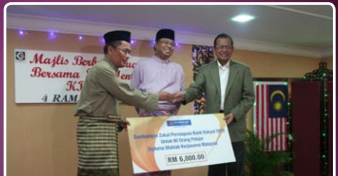
Sumbangan cek zakat oleh Pengarah Urusan Bank Rakyat kepada Ketua Pengarah MKM