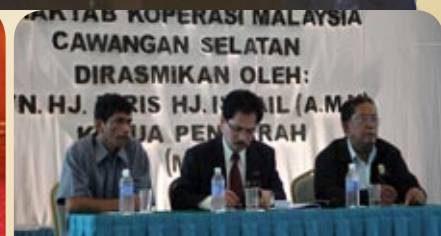
Penceramah ikan ketutu dan belangkas