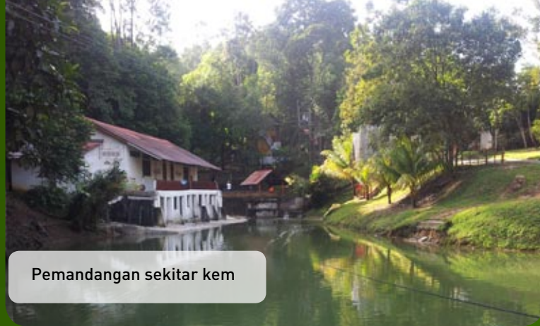
Pemandangan sekitar kem

Menurut En. Mohd Salleh Mat Zin, Setiausaha Koperasi KPPCB, pengisian program ini sesuai dengan peserta dewasa yang pelbagai peringkat umur dan mencapai matlamat program. Permainan yang dilaksanakan dapat diterima oleh peserta khususnya yang pertama kali mengikuti program ini dengan rasa gembira dan seronok. Maklum balas yang diterima dari peserta amat menggalakkan khususnya mereka menikmati kemudahan berkoperasi melalui kursus yang diikuti. Impak yang jelas dari program ini ialah peserta program telah bertanya sendiri apa yang boleh mereka bantu untuk memajukan koperasi. -Tn. Hj. Ramlan Kamsin-