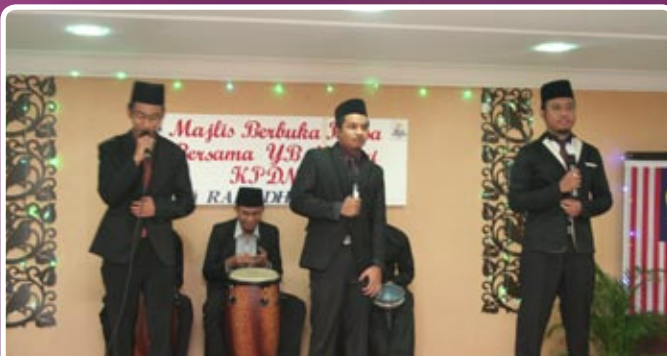
Persembahan nasyid oleh Pelajar MKM