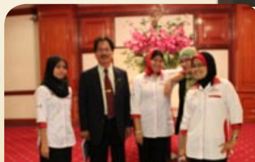
Pengarah MKM CS bersama staf