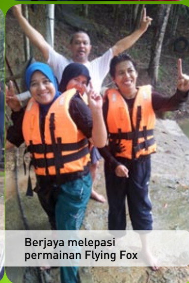
Berjaya melepasi permainan Flying Fox