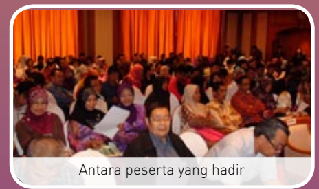
Antara peserta yang hadir

Secara keseluruhannya, program ini berlangsung dengan jayanya. Adalah diharapkan para koperator koperasi khususnya di Wilayah Persekutuan Labuan dan negeri Sabah mengambil peluang yang telah disediakan oleh agensi kerajaan dalam mengembangkan lagi perniagaan khususnya dalam sektor pemborongan dan peruncitan. - Ridzuan -