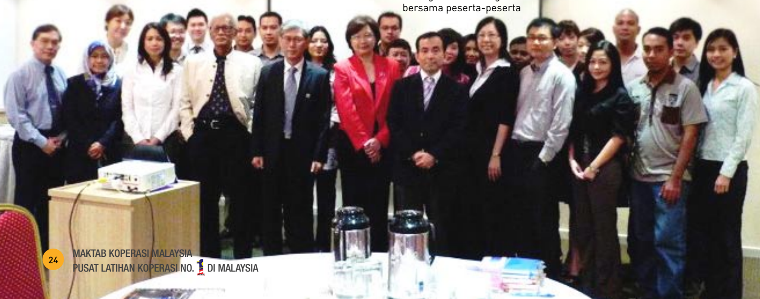
Bergambar kenangan bersama peserta-peserta