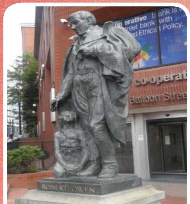
Tugu Robert Owen iaitu pengasas gerakan koperasi