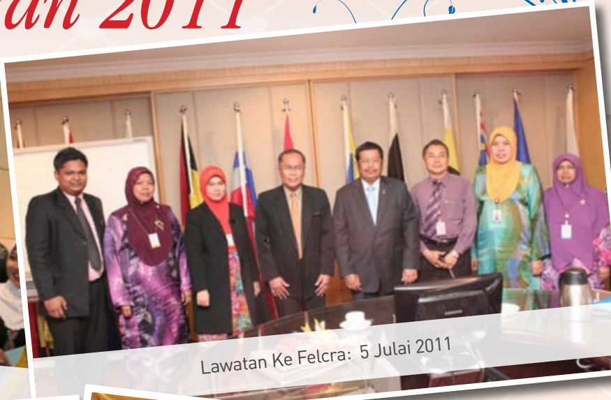
Lawatan Ke Felcra: 5 Julai 2011