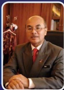
YBhg. Datuk Mohd Zain bin Mohd Dorn Ketua Setiausaha, Kementerian Perdagangan Dalam Negeri, Koperasi dan Kepenggunaan (KPDNKK)

“Dalam menjangkau usia 5 dekad, MKM bukan sahaja hanya dikenali sebagai institusi latihan koperasi terunggul di rantau ini, malah pengalaman serta kemahiran yang dikumpulkan membolehkannya menjadi pusat rujukan para koperator dalam dan luar negara”