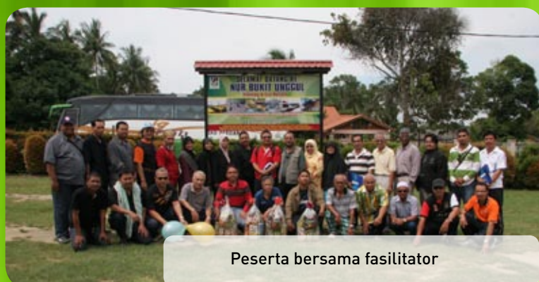
Peserta bersama fasilitator