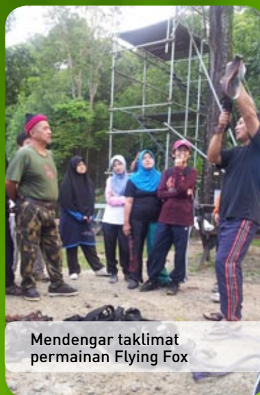
Mendengar taklimat permainan Flying Fox