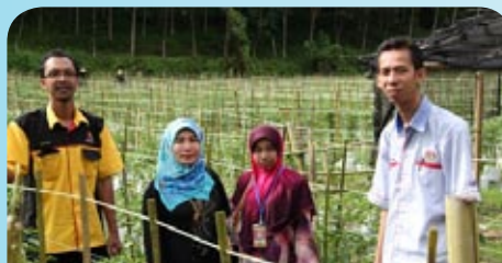
Lawatan ke Koperasi Pekebun Kecil Sik Berhad- tanaman cili fertigasi