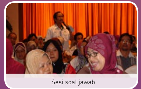
Sesi soal jawab