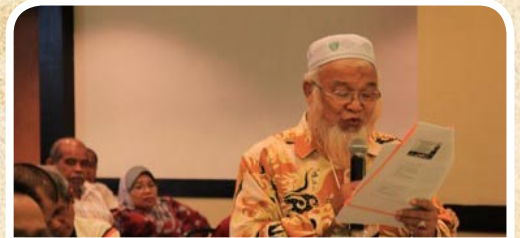
Seorang peserta sedang menanyakan soalan semasa sesi soal jawab