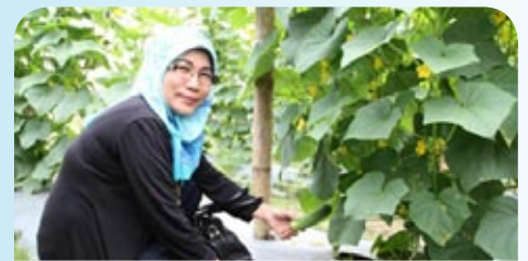
Tanaman timun yang mendatangkan hasil lumayan kepada koperasi