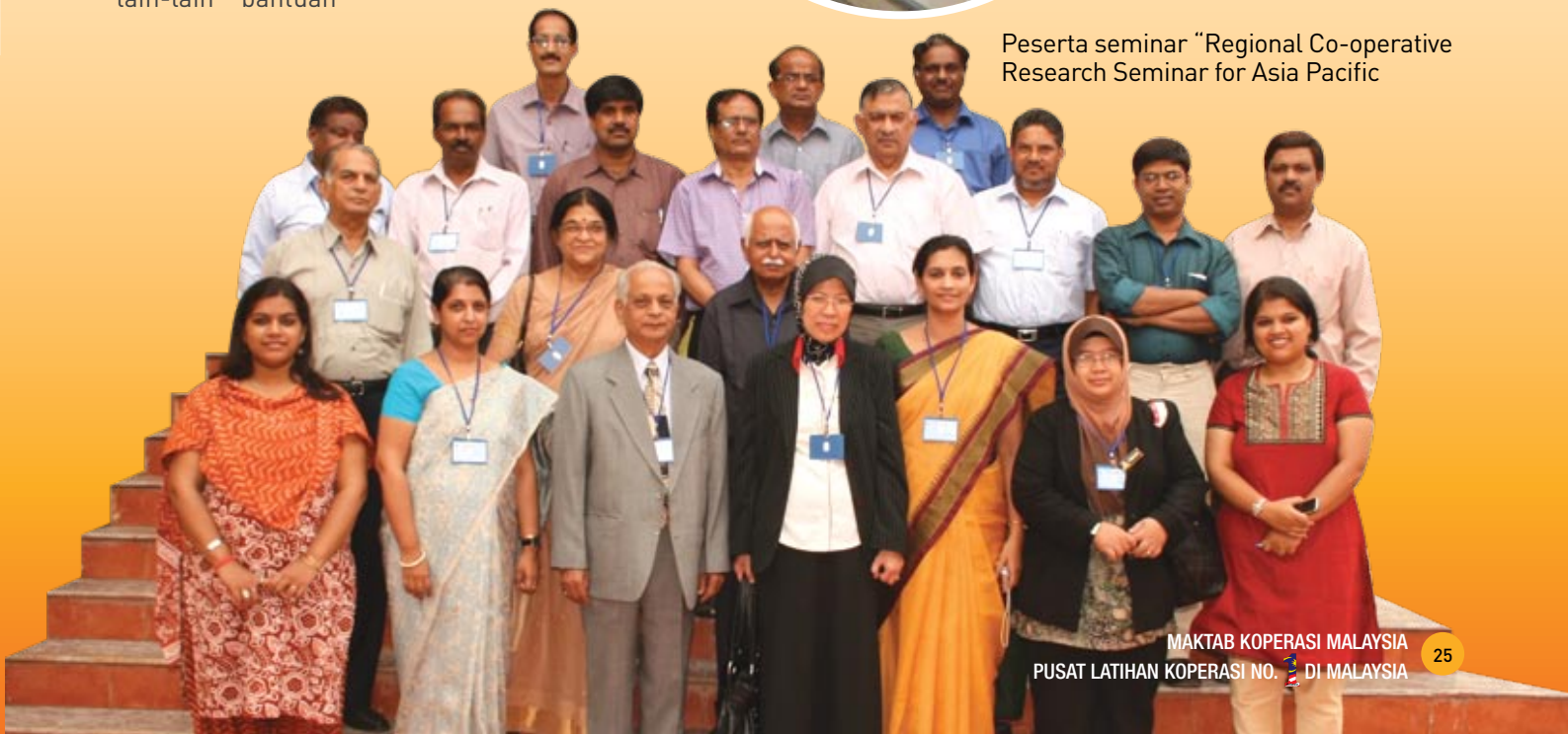
Peserta seminar “Regional Co-operative Research Seminar for Asia Pacific