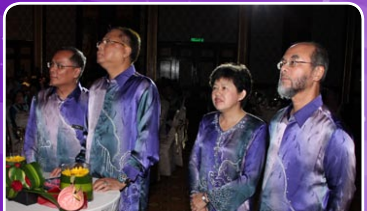
Gimik Pelancaran logo baharu MKM oleh YB. Dato' Seri Ismail Sabri bin Yaakob, Menteri PDNKK

Majlis diakhiri dengan sesi memotong kek di antara YB. Menteri dan tetamu-tetamu kehormat yang lain dan juga nyanyian lagu 1 Malaysia yang telah dinyanyikan oleh semua tetamu yang hadir. Sempena Ulang Tahun Ke-55 kali ini, MKM bertuah kerana majlis kali ini mendapat sokongan dari pelbagai pihak khususnya pihak Kementerian, agensi-agensi, serta warga kerja MKM yang bertungkus-lumus dan komited dalam menjayakan Sambutan Ulang Tahun MKM pada kali ini.