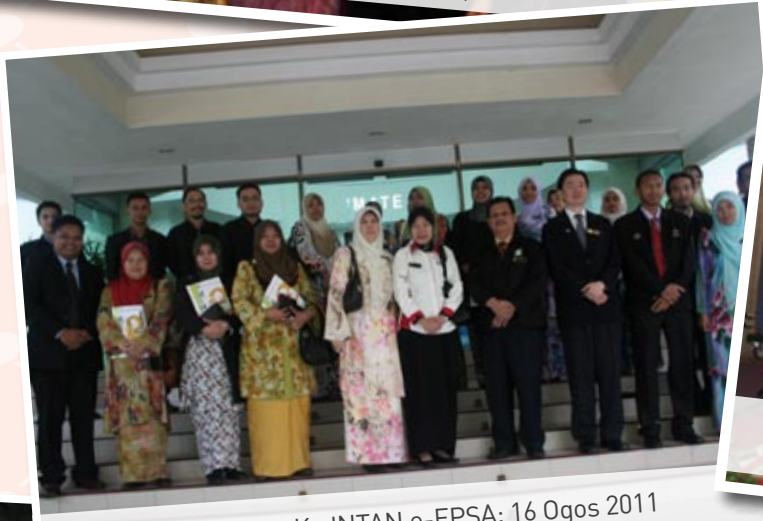
Lawatan Ke INTAN e-EPISA: 16 Ogos 2011