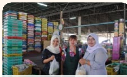
Aktiviti pertanian telah memberikan hasil yang lumayan kepada Banlat Agriculture Co-operative Limited

Sebelum bertolak pulang ke Malaysia, peluang diambil dengan melawat ke Co-operative League of Thailand (CLT) yang merupakan badan puncak kepada gerakan koperasi Thailand. Kunjungan pensyarah ini disambut oleh Dr Suwichai Suparanon, Lembaga Eksekutif dan beberapa kakitangan CLT dengan memberi taklimat secara ringkas dan meminta pandangan dan maklum balas hasil program sangkutan yang telah dibuat di Banlat Agriculture Co-operative Limited. - Nasibah -