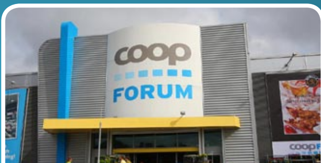
Coop Forum merupakan hypermarket milik Swedish Cooperative Union