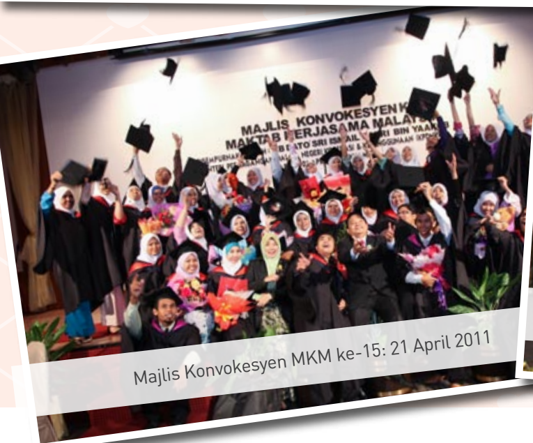
Majlis Konvokesyen MKM ke-15: 21 April 2011