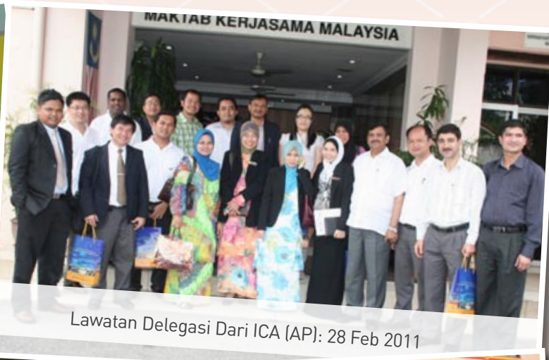
Lawatan Delegasi Dari ICA (AP): 28 Feb 2011