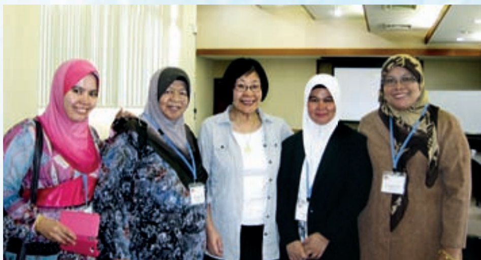
Peserta dari Malaysia bersama-sama dengan penceramah

Lanjutan daripada perbincangan dan kerjasama yang ditandatangani oleh pihak MKM dan IDACA (The Institute for the Development of Agriculture Cooperation in Asia), setiap tahun MKM akan menghantar pegawai latihan untuk mengikuti program yang dianjurkan untuk mempelajari dan mendalami ilmu-ilmu tentang perkoperasian yang biasanya diamalkan oleh penduduk-penduduk Jepun. Program yang dianjurkan oleh ICA dengan kerjasama IDACA telah dijalankan selama 30 hari tetapi peserta dari Malaysia hanya mengikuti program tersebut selama 16 hari sahaja kerana peserta dari Malaysia hanya melihat secara praktikal pengurusan koperasi yang dipilih untuk dijadikan panduan koperasi di Malaysia melalui latihan dan pendidikan yang diberikan oleh pegawai latihan terbabit dan seterusnya membuat kajian kes. Objektif utama program ini adalah untuk membantu wanita yang bertanggungjawab atau menjadi penyelaras dan mempunyai peranan untuk memajukan wanita luar bandar dan terlibat dalam sektor pertanian di mana mereka akan menyumbang kepada penjaanaan pendapatan dan mengurangkan kadar