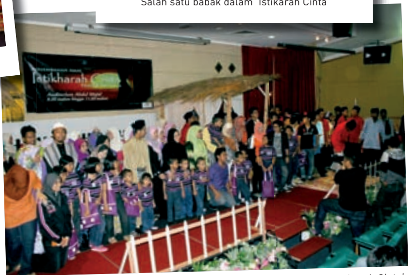
Para pelajar yang menyertai Persembahan Amal : Teater Muzikal 'Istikharah Cinta'