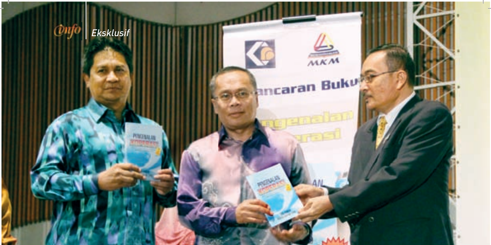
Pelancaran buku Pengenalan Koperasi

Konvensyen ini turut menghasilkan resolusi bagaimana untuk menghasilkan modal insan koperasi yang kompeten. Resolusi ini terhasil dari sesi bengkel yang dihadiri oleh seramai 150 orang pengerusi dan setiausaha koperasi. Bagi memudahkan pengendalian, bengkel ini dipecahkan kepada tiga kumpulan.