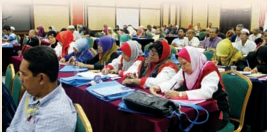
Sebahagian peserta seminar yang menghadiri program ini

Secara keseluruhannya, seminar selama 1 hari setengah telah berjaya mencapai objektifnya. Para peserta seminar telah mendapat banyak manfaat dan panduan hasil perkongsian maklumat yang telah disampaikan oleh penceramah-penceramah jemputan yang berkualiti. -Salwana binti Ali