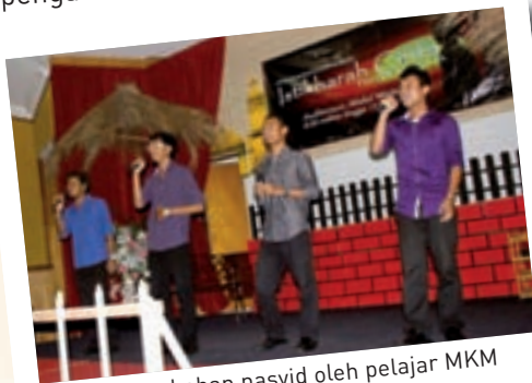
Persembahan nasyid oleh pelajar MKM