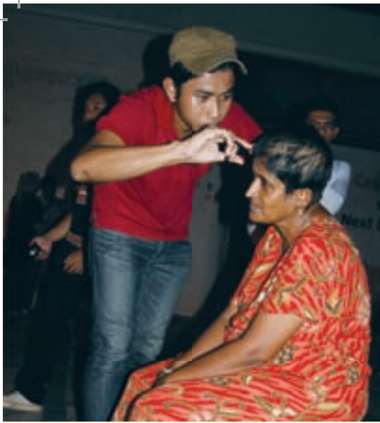
Aktiviti menggunting rambut