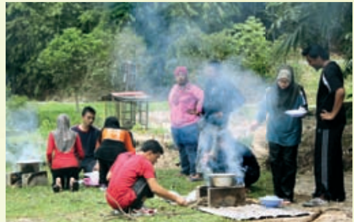
Gotong-royong menyediakan makanan tengahari

Pada hari terakhir, selepas selesai menjalankan tanggungjawab sebagai seorang muslim, para pelajar bergotong-royong menyediakan sarapan dan pada jam