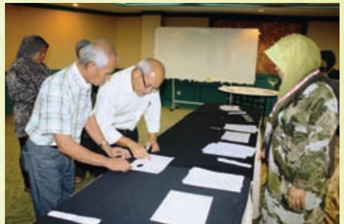
Ketibaan peserta semasa pendaftaran