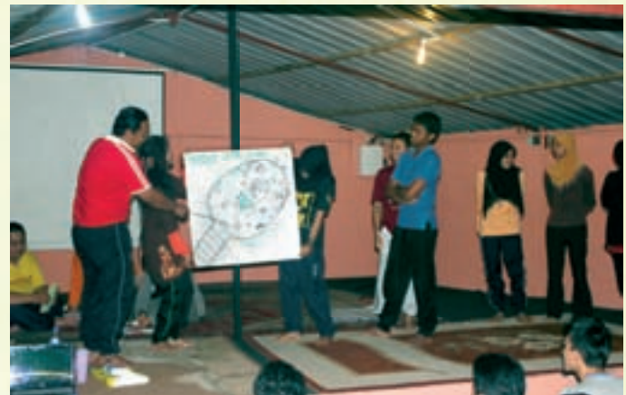
Aktiviti latihan dalam kumpulan