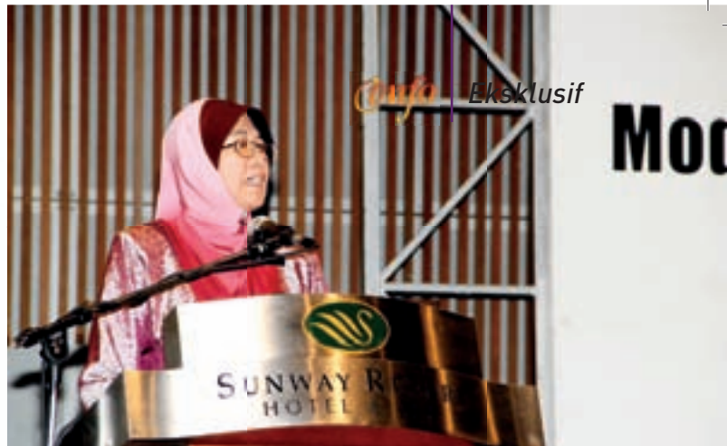
Pembentangan kertas kerja oleh Timbalan Ketua Pengarah (Akademik), MKM

Konvensyen yang diakhiri dengan sesi panel forum ini telah lengkap dengan lapan sesi pembentangan kertas kerja oleh pakar dalam bidang masing-masing iaitu: