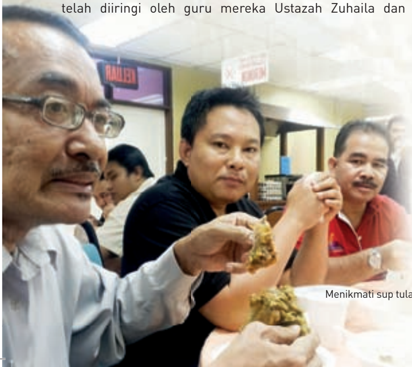
Menikmati sup tulang qurban

Secara keseluruhannya, program ini telah mencapai objektifnya untuk memberikan kesedaran kepada warga kerja MKM dan para pelajar di mana sebagai umat Islam adalah menjadi kewajipan kepada mereka untuk menunaikan ibadah ini apabila berkemampuan. Ini dapat melatih diri untuk menggembirakan hati mereka yang kurang berkemampuan walaupun dengan memberi makan sepinggan nasi putih berlaukkan daging qurban. Program ini juga turut memberi kesedaran adalah menjadi kewajipan mereka yang berkemampuan untuk memberi bantuan kepada mereka yang memerlukan agar dapat membentuk peribadi mulia yang dituntut oleh Islam. - Siti Hajar Saey