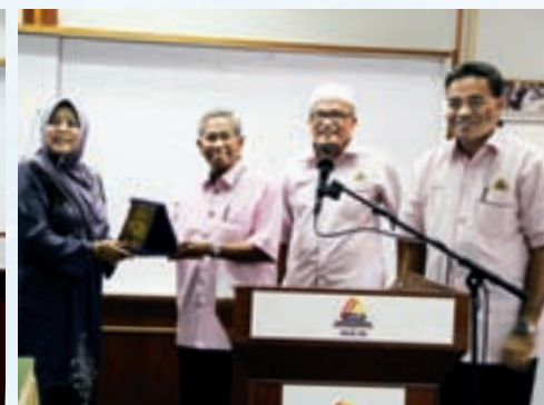
Sesi pertukaran cenderamata oleh kedua-dua pihak