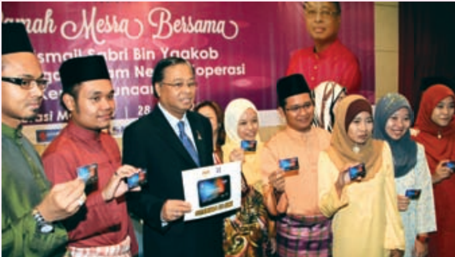
Sebahagian penerima KADS1M bergambar bersama YB Menteri, Dato' Sri Ismail Sabri Yaakob

Kad Diskaun Siswa 1Malaysia (KADS1M) diwujudkan oleh Kementerian Perdagangan Dalam Negeri, Koperasi dan Kepenggunaan (KPDNKK) dengan objektif untuk membantu mengurangkan kos sara hidup pelajar-pelajar Institusi Pengajian Tinggi (IPT) awam dan swasta seluruh negara. Inisiatif ini dilaksanakan bertitik tolak daripada cadangan yang telah dibentangkan oleh wakil pelajar dalam mesyuarat Majlis Perundingan Pelajar Kebangsaan (MPPK) pada 21 November 2011 yang lalu. KADS1M diberi secara percuma kepada pelajar-pelajar IPT warganegara Malaysia yang mengikuti pengajian jangka panjang dengan tempoh pengajian satu tahun dan ke atas. KADS1M telah diedarkan kepada para pelajar IPT mulai 28 Ogos 2012 secara berperingkat-peringkat.