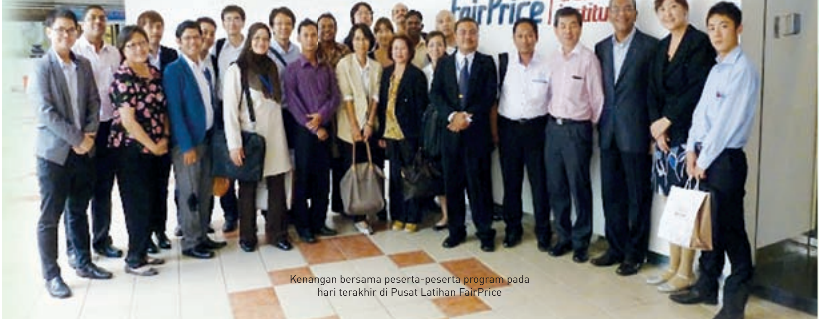
Kenangan bersama peserta-peserta program pada hari terakhir di Pusat Latihan FairPrice

Sepanjang program ini berlangsung, para peserta diberi pendedahan mengenai pengurusan pengoperasian perniagaan dalam proses pembelian, barang dagangan (Merchandising) dan urus niaga antarabangsa dan rantaian pengurusan yang diamalkan oleh Fair Price oleh Pengarah Urusan bahagian Pembelian, Barang Dagangan (Merchandising) dan Urus niaga Antarabangsa dan Pengurus Kanan Bahagian logistik, NTUC Fair Price. Kajian kes kejayaan perniagaan Korea dan Jepun telah dibentangkan oleh Ketua Pengurus, iCOOP Korea dan Coop Kobe. Perkongsian kejayaan tersebut memberi informasi dan membuka minda para peserta mengenai pengurusan perniagaan pemborongan dan peruncitan. Bengkel perbincangan dan perkongsian kejayaan oleh koperasi-koperasi yang diwakili oleh para peserta dalam usaha menjalinkan kerjasama antara koperasi banyak memberi faedah dan idea dalam pengendalian perniagaan dari setiap koperasi yang terlibat.