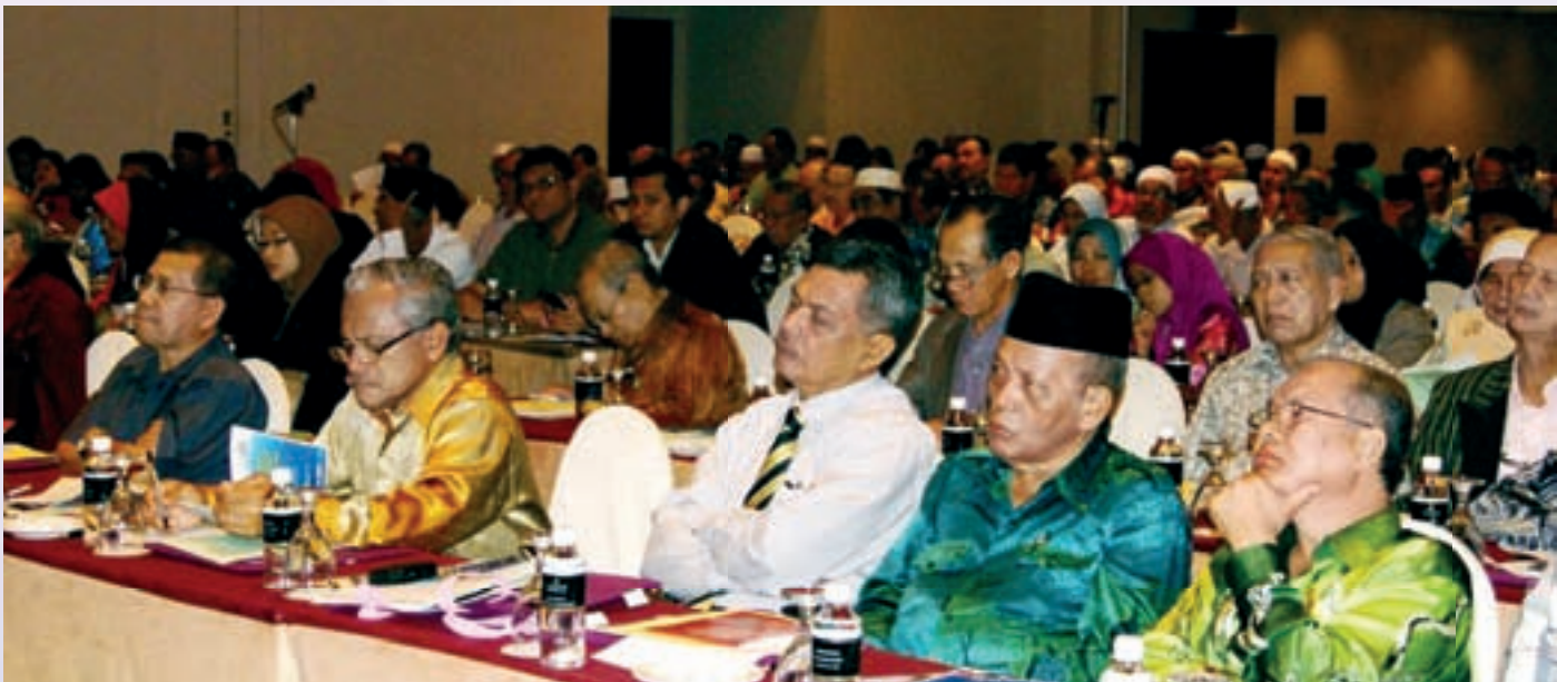
Warga koperasi tidak melepaskan peluang untuk menimba ilmu pengetahuan dalam bidang peruncitan dan pemborongan dalam dan luar negara

Secara keseluruhannya, program ini telah membuka minda para koperator bahawa perniagaan pemborongan dan peruncitan merupakan satu peluang perniagaan yang boleh menjana keuntungan yang tinggi. Hasrat kerajaan untuk melihat koperasi menyumbang 5% kepada KDNK (Keluaran Dalam Negara Kasar) negara mungkin dapat dipercepatkan sekiranya koperasi berani menceburkan diri dalam bidang pemborongan dan peruncitan. Oleh yang demikian, MKM sebagai institusi latihan dan pendidikan koperasi akan terus peka kepada program-program yang sesuai dengan persekitaran bagi membantu gerakan koperasi dengan ilmu-ilmu yang berguna untuk lebih berdaya maju, berdaya saing, kreatif dan inovatif.