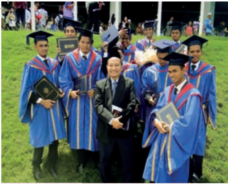
Sebahagian graduan bersama dengan Penyelaras BBA bagi sesi Dis 2008