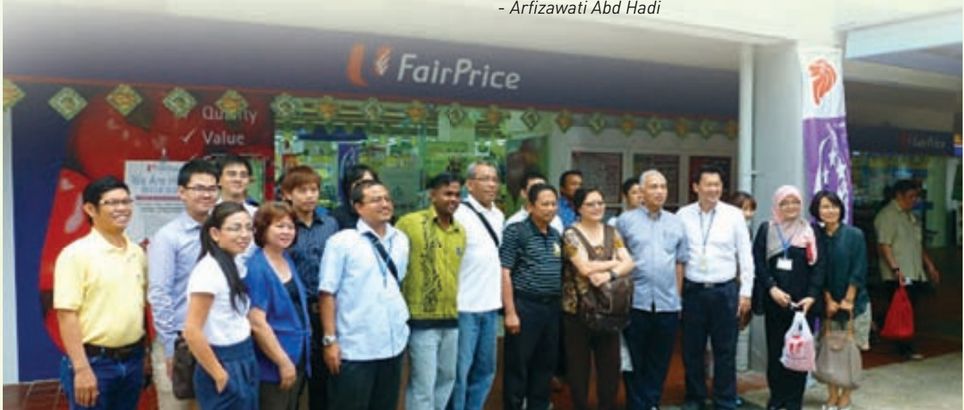
Lawatan ke rangkaian kedai FairPrice