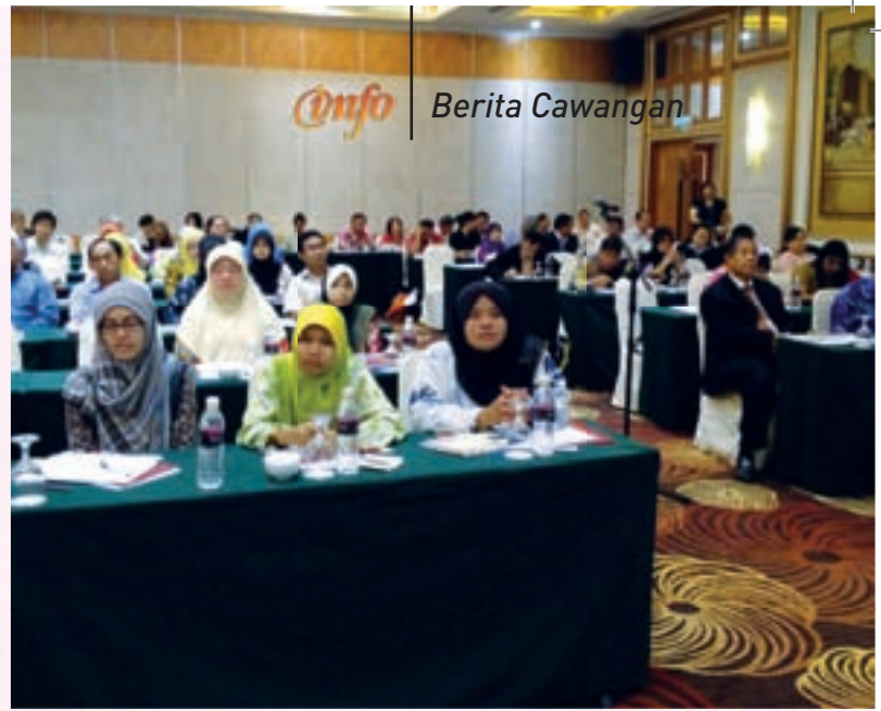
Sebahagian besar peserta yang menghadiri Bicara Eksekutif