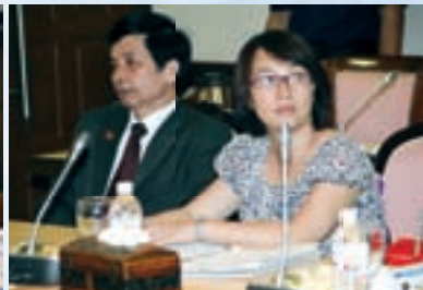
Sebahagian peserta delegasi Vietnam yang turut hadir