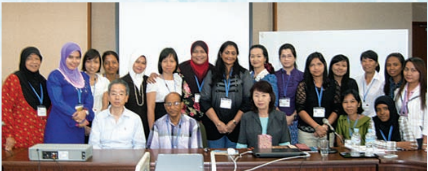
Peserta bersama-sama dengan penceramah dan pegawai dari ICA dan IDACA

koperasi mengambil langkah proaktif untuk menyelesaikannya. Selain daripada kelas yang diikuti oleh peserta selama seminggu, kami dibawa melawat ke Hiroshima dengan menggunakan kereta api. Wilayah Fukushima ini terletak di Pantai Timur Honshu, pulau yang terbesar di Jepun dan merupakan pengeluar terbesar kuasa elektrik dan industri kuasa nuklear di samping pengeluar hasil pertanian. Pada 11 Mac 2011, gempa bumi yang kuat berserta dengan bencana Tsunami telah meranapkan lebih 4 juta rumah, lebih 10,000 penduduk kehilangan nyawa dan kerugian melebihi 517 bilion Yen. Keadaan ini menjadi