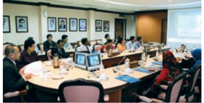
Peserta delegasi sedang menonton tayangan video korporat MKM

Tanggal 19 September 2012, Maktab Koperasi Malaysia sekali lagi menerima kunjungan hormat dari luar. Kali ini, MKM telah dilawati oleh Delegasi dari Ministry of Local Government Rural Development & Cooperative, Bangladesh. Objektif kepada lawatan ini adalah untuk mendapatkan maklumat berkaitan aktiviti yang dilaksanakan oleh Maktab Koperasi Malaysia.