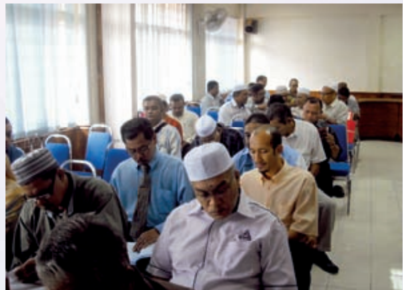
Majlis taklimat promosi program latihan MKM mendapat sambutan yang menggalakkan daripada koperator