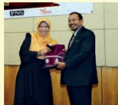
Penyampaian cenderamata kepada penceramah oleh Pengarah Pusat ANTARABANGSA