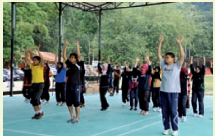
Aktiviti senaman aerobik

7.30 pagi aktiviti senam pagi diadakan. Walaupun penat dengan aktiviti berkayak dan explorace pada hari terakhir, namun pengalaman dan kenangan yang manis akan terus tersemat di hati setiap pelajar yang terlibat. Kerjasama, persefahaman, tolak-ansur, keyakinan diri, kreativiti dan semangat kasih sayang secara tidak langsung dapat dipupuk melalui program ini. Semoga persahabatan yang terjalin selama berada di kem akan terus berkekalan dalam sanubari pemimpin pelajar MKM ini dalam meningkatkan martabat MKM di mata dunia. -Norsyeirawani Shari