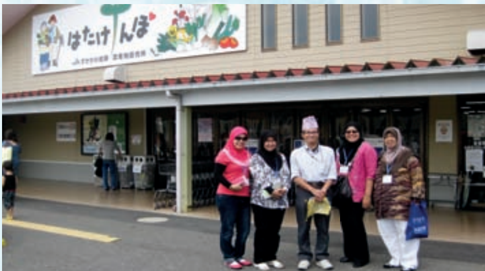
Peserta dari Malaysia bersama dengan Pengurus DSS yang kreatif