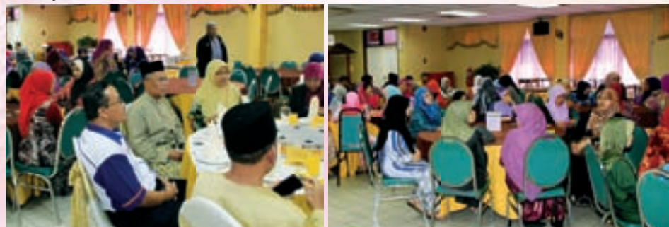
Warga kerja MKM bersama-sama memeriahkan majlis tanda sokongan

Komitmen beliau terhadap tugas dan tanggungjawab beliau amat tinggi. Beliau telah menjalankan tugas dan tanggungjawabnya dengan cemerlang selaku pengarah dan juga warga MKM. Keberanian, ketekunan dan keikhlasan menjadi inspirasi kepada warga kerja MKM bagi meneruskan usaha-usaha yang telah dibuat beliau sebelum ini. Kami warga MKM berharap agar terus sihat sejahtera dan terus berjaya dalam bidang yang diceburi. Terima kasih sumbangan dan jasa beliau kepada MKM.