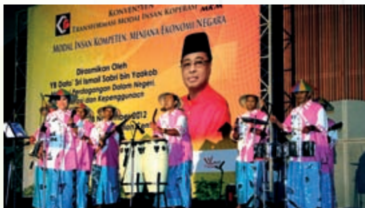
Kumpulan Bale-Bale sedang membuat persembahan pada majlis perasmian Konvensyen