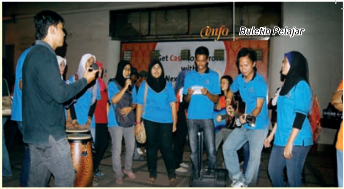
Persembahan para pelajar