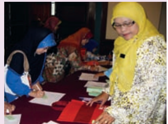
Urus setia warga Pusat CALL yang berdedikasi menjayakan program bicara eksekutif ini