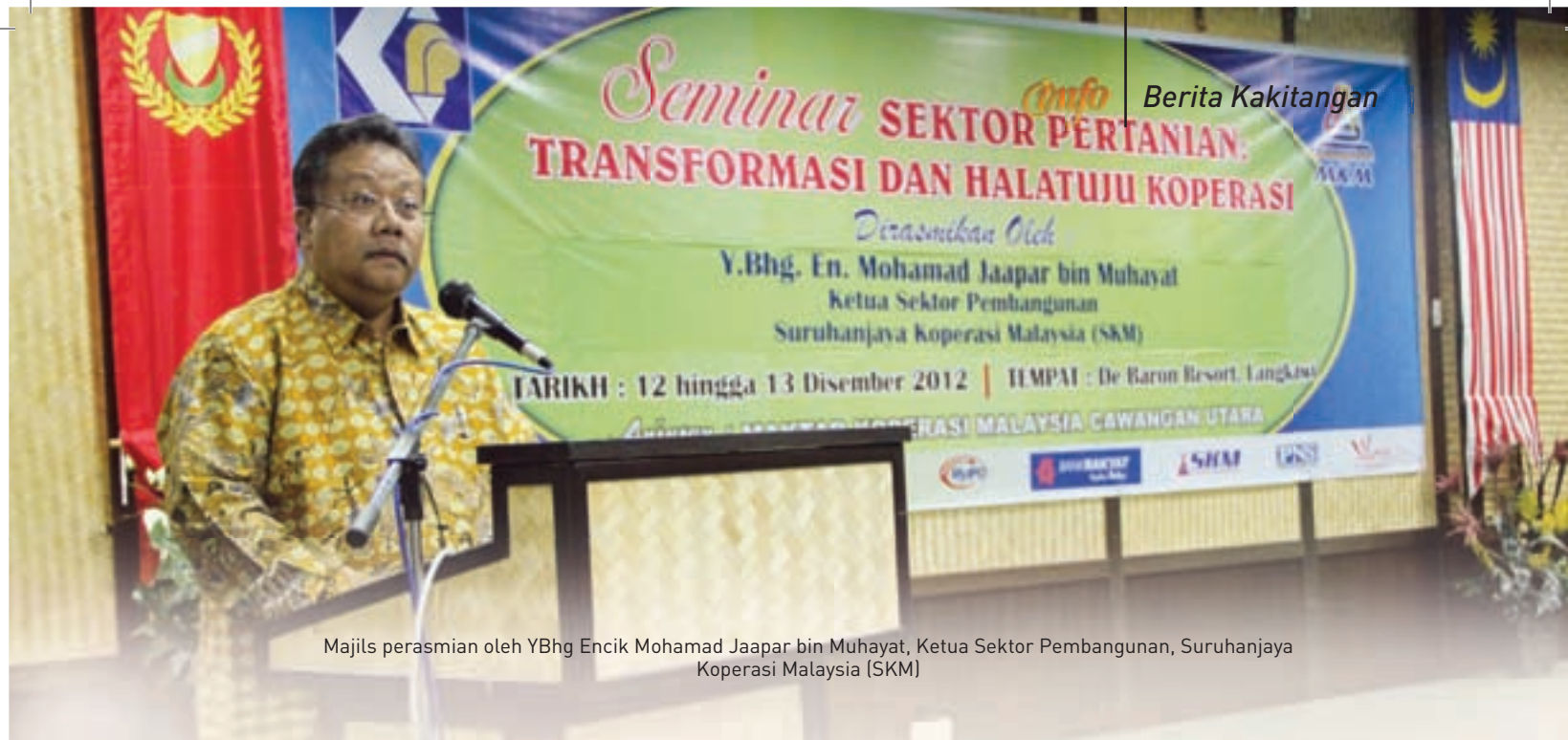
Majlis perasmian oleh YBhg Encik Mohamad Jaapar bin Muhyat, Ketua Sektor Pembangunan, Suruhanjaya Koperasi Malaysia (SKM)

pendapatan bagi golongan petani serta usahawan tani sekali gus menangani isu bekalan makanan di Malaysia.