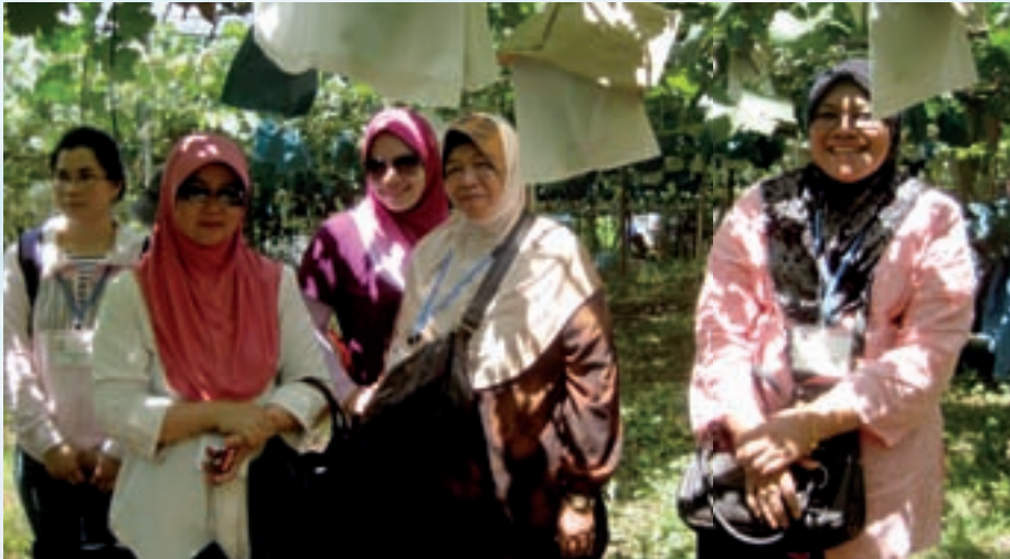
Peserta dari Malaysia tekun mendengar taklimat di ladang anggur

lebih parah dengan kebocoran loji nuklear yang merupakan pembekal tenaga dan kesan radiasi sudah pasti akan memberi tempias bukan sahaja manusia tetapi juga kepada tanaman dan ternakan yang terdapat di Fukushima. Kami telah dibawa melawat ke JA Fukushima Prefecture Union, JA Women's Organization, Direct Sales Shop (DSS) "Nme-be", DSS Nakayoshi-Kai, JA Date-Mirai Women's Association, JA Souma, JA Tamura, DSS Hatakenbo, JA Sukagawa-Iwase dan Shirakawa Kosei General Hospital sepanjang berada di Fukushima. Pada hari terakhir kami telah dibawa melawat ladang anggur yang diusahakan oleh sebuah keluarga di Yamanashi Prefecture di daerah Katsunuma berhampiran dengan Gunung Fuji. Dengan kreativiti dan inovasi yang ada beliau dan keluarga telah mewujudkan Rokuji-ka atau "Konsep 6th. Industry" yang mana beliau dan keluarga telah bertani, menanam anggur, menjual anggur terus kepada koperasi dan orang ramai, membuka restoran di samping mewujudkan "eco-tourism" untuk mereka-mereka yang berminat. Laporan secara terperinci tentang lawatan ini serta koperasi yang dilawati telah dinyatakan di dalam kajian kes yang dihasilkan. -Roziyah Mohamed