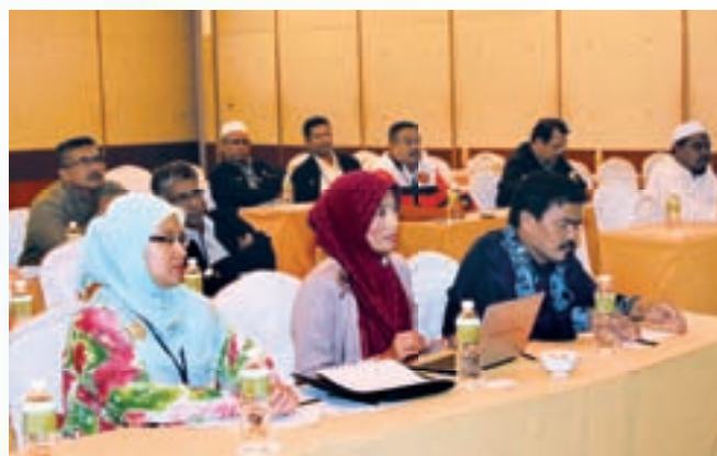
Sebahagian peserta Bengkel Resolusi