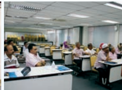
Peserta lawatan dari KOKITAB