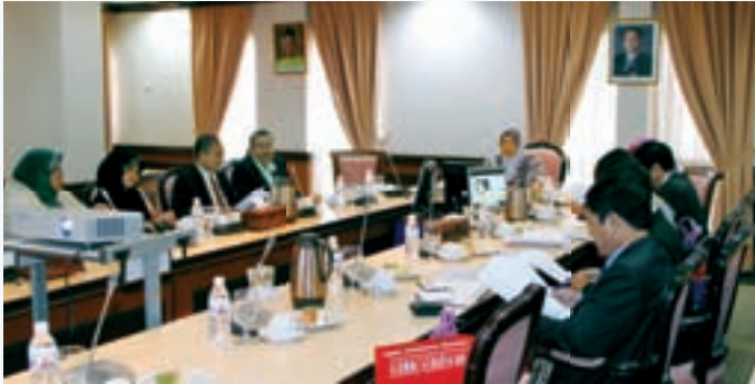
Perbincangan bersama antara MKM dan delegasi dari Vietnam