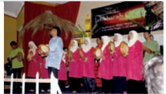
Persembahan kompong dari kumpulan kompong KSB