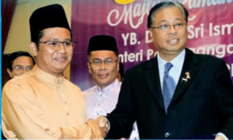
Penyerahan Kad Diskaun Siswa 1Malaysia