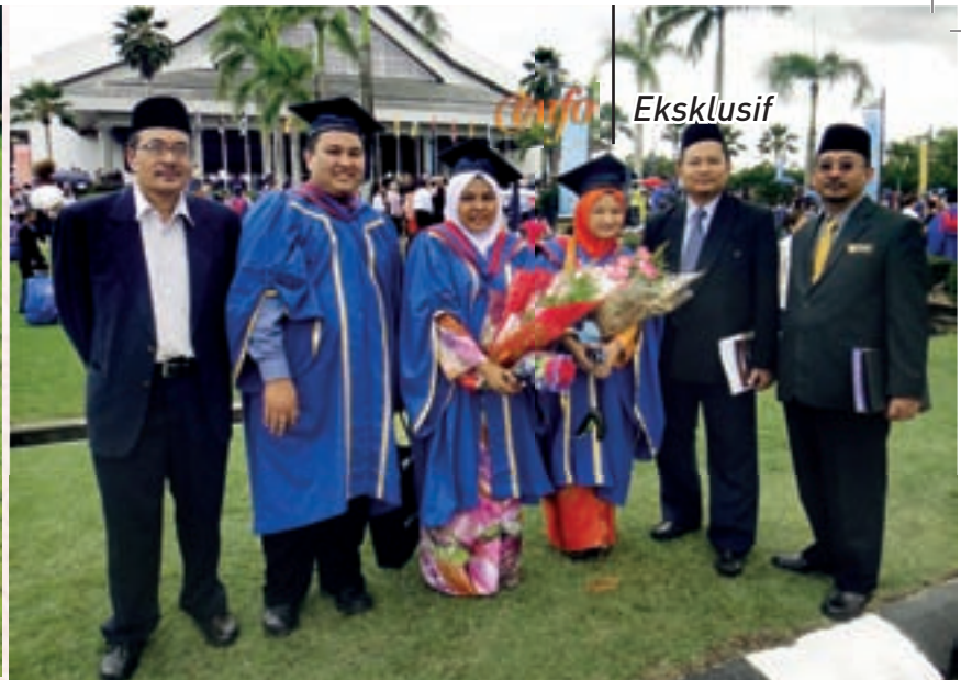
Para graduan bergambar kenangan bersama-sama dengan Pengarah Pusat Antarabangsa dan Pendidikan Tinggi, MKM

menguruskan dan mentadbir koperasi. Secara purata bilangan koperasi ini pula bertambah sebanyak 1000 koperasi setiap tahun.