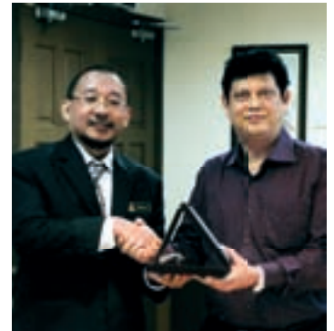
Sesi pertukaran cenderamata sebagai tanda penghargaan