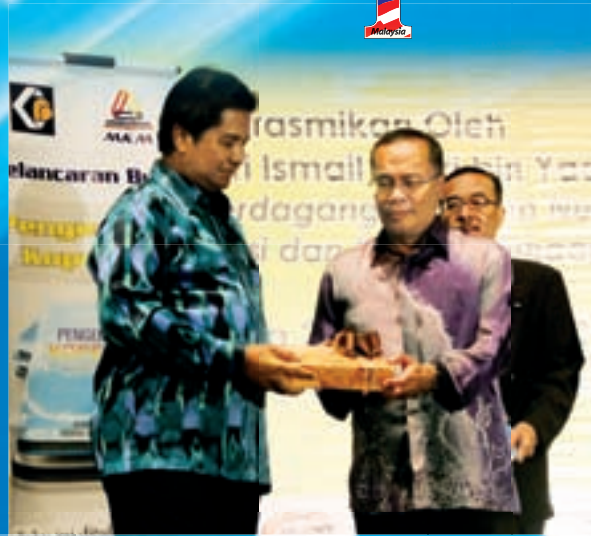
Konvensyen Transformasi Modal Insan