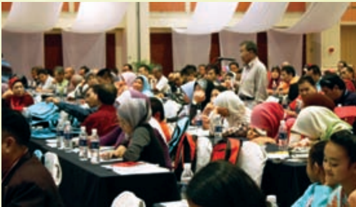
Salah seorang peserta bertanyakan soalan kepada Pembentang Kertas Kerja