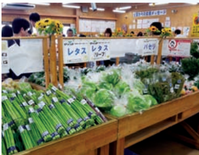
Produk Pertanian di Pasar Petani (farmer's market) Hatakenbo