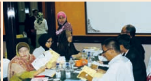
Antara pegawai Latihan MKM yang turut hadir