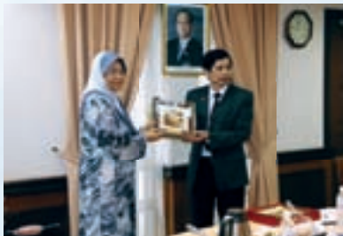
Sesi penyampaian cenderamata

Delegasi telah dipersembahkan dengan tayangan video korporat MKM untuk memberi pendedahan yang lebih jelas tentang aktiviti yang dijalankan oleh MKM sebagai pusat latihan koperasi di Malaysia. Sebagai memenuhi hasrat dan tujuan lawatan iaitu untuk berkongsi maklumat, pihak MKM juga turut dipersembahkan dengan taklimat berkaitan perkembangan institusi pendidikan di Vietnam. Dalam sesi soal jawab pula, delegasi dan wakil MKM saling bersoal jawab dan berkongsi pandangan untuk mendapatkan gambaran yang lebih jelas mengenai cara kerja, budaya dan sistem pendidikan yang diamalkan di institusi masing-masing. Sebelum sesi lawatan berakhir, kedua-dua pihak saling bertukar-tukar cenderamata sebagai tanda kenang-kenangan.