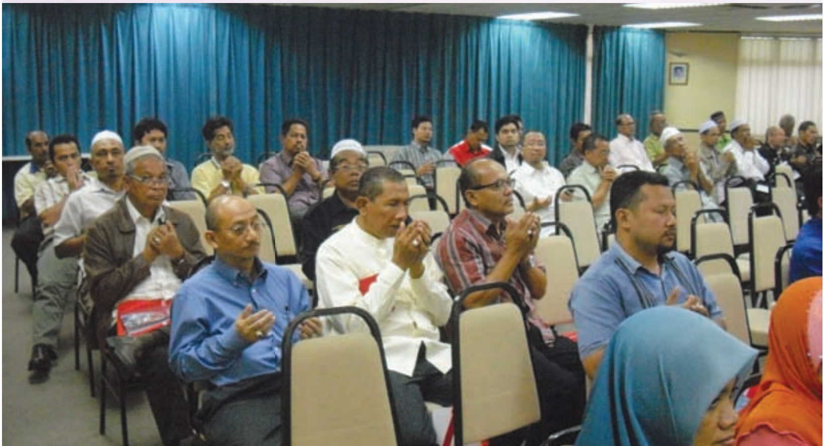
Warga koperator yang turut hadir mendengar taklimat

Selesai majlis taklimat di Gua Musang, pihak kami terus bergerak ke Kota Bharu, Kelantan. MGU Firdaus Hotel, Kota Bharu dipilih sebagai destinasi terakhir untuk Majlis