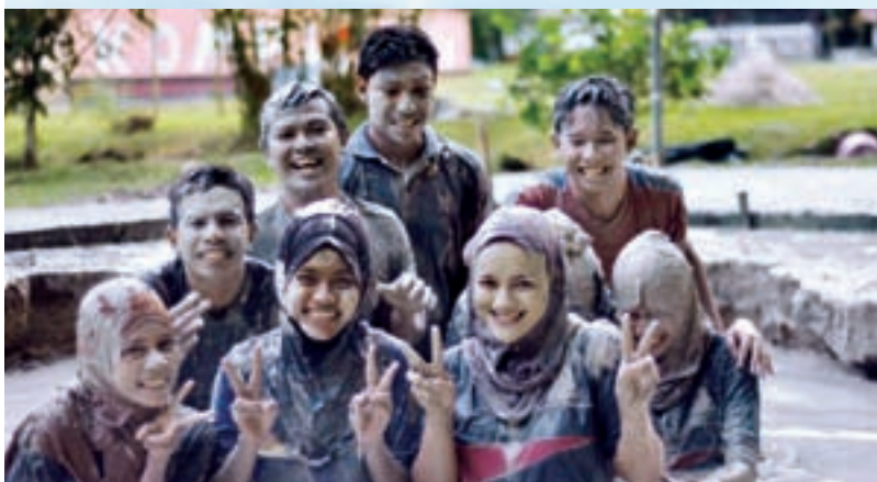
Aktiviti 'Mud Spa'

Secara keseluruhannya, kem motivasi pelajar ini adalah bertujuan untuk memberikan kesedaran kepada para pelajar tentang pentingnya berubah dan bertindak sekarang demi masa depan yang cemerlang. Program ini turut melatih pelajar meningkatkan pengurusan diri dan masa, di samping meningkatkan keyakinan diri pelajar dan membentuk peribadi yang mulia. -Wan Rasyidah Wan Musa