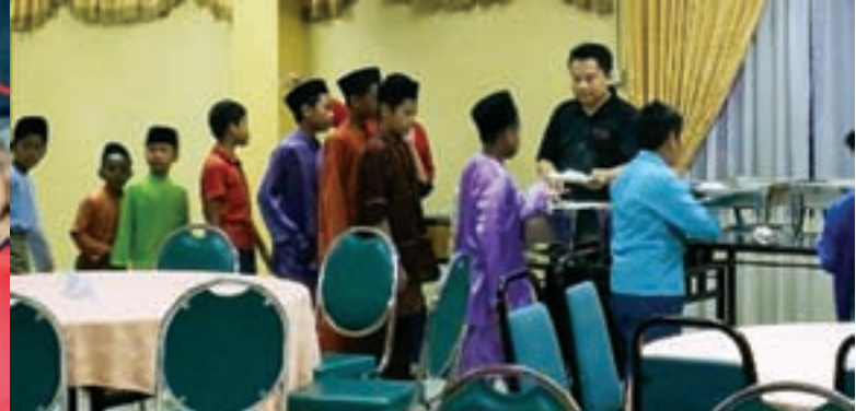
Pelajar KAFA Al-Integrasi mengambil juadah qurban

Qurban merupakan satu ibadah yang mulia dan penting dalam Islam kerana amat besar fadilatnya. Tetapi malangnya masih ramai orang yang samar-samar atau kabur kefahaman mereka mengenainya, sehinggakan ada yang memandang ringan walaupun mempunyai kemampuan tetapi tidak mahu melakukan penyembelihan qurban atau aqiqah yang amat dituntut oleh agama.