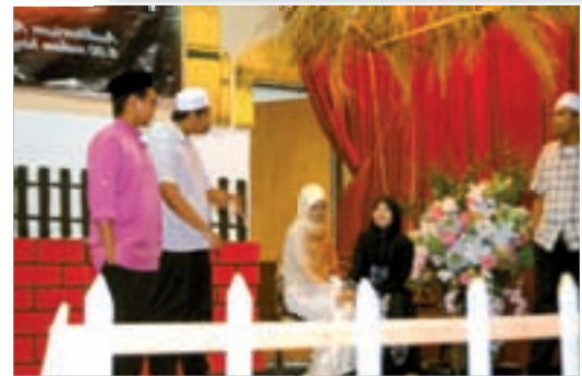
Salah satu babak dalam 'Istikharah Cinta'