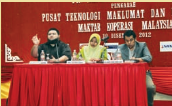
Barisan pembentang kertas kerja