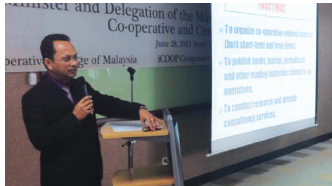
Ketua Pengarah MKM menyampaikan taklimat ketika lawatan di iCoop Cooperative Institute dan Sungkonghoe University