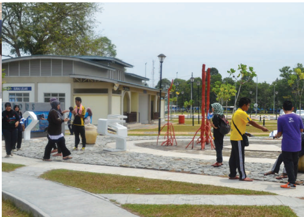
Kelihatan sekumpulan pelajar sedang melakukan promosi program jangka panjang MKM

Pada 6-7 April 2013, Pusat Antarabangsa dan Pendidikan Tinggi telah menganjurkan program Kem Kepimpinan di Kem El-Azzhar, Banting Selangor. Pelajar yang terlibat adalah daripada kalangan Majlis Perwakilan Pelajar (MPP), AJK asrama dan ketua setiap semester. Manakala empat orang pensyarah bertindak sebagai fasilitator.