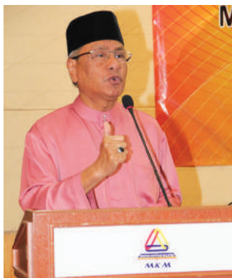
YB Menteri PDNKK menyampaikan ucapan