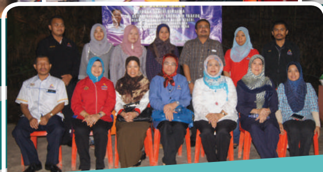
MKM BERSAMA KOMUNITI BERA 16 FEBRUARI 2013