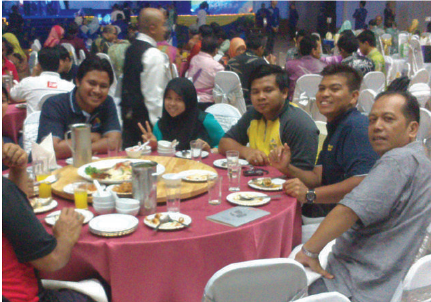
Majlis makan malam