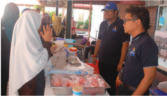
Gerai jualan pelajar