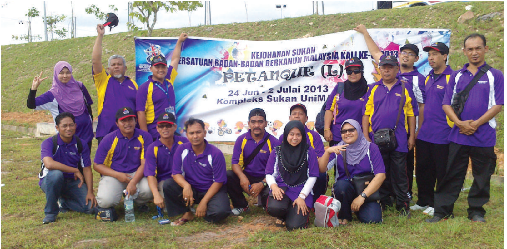
Kontinjen MKM hadir memberi semangat kepada pasukan petanque

seorang pengurus. Jarak bagi acara basikal bukit ini adalah 30km yang meliputi laluan jalan raya dan laluan off road iaitu pendakian