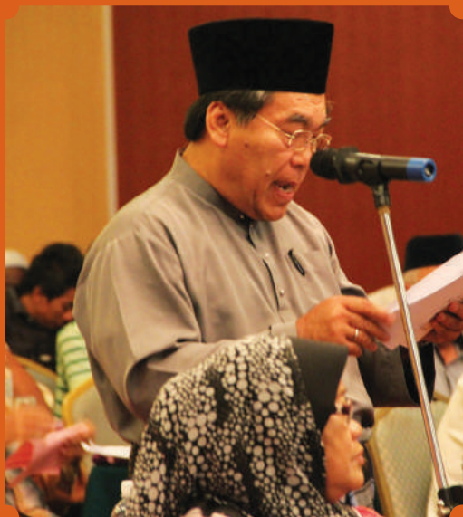
Sesi soal jawab