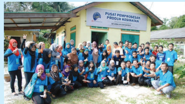
Lawatan ke Pusat Pemrosesan Produk Kesihatan

pelajar MKM dengan masyarakat luar. Tugasan yang dilakukan atas khidmat komuniti ini dijangka mampu melatih dan membina kredibiliti serta kepimpinan, usaha sama dan profesionalisme dalam diri pelajar serta dapat mengeratkan silaturahim antara peserta dengan pihak yang terlibat. Selain itu, program yang dijalankan ini juga memberi pelbagai faedah kepada semua pihak yang terlibat secara langsung atau tidak langsung. Program ini mengambil masa tiga hari dua malam dan hari pertama merupakan perjalanan diikuti dengan taklimat ringkas serta penyerahan peserta kepada keluarga angkat.