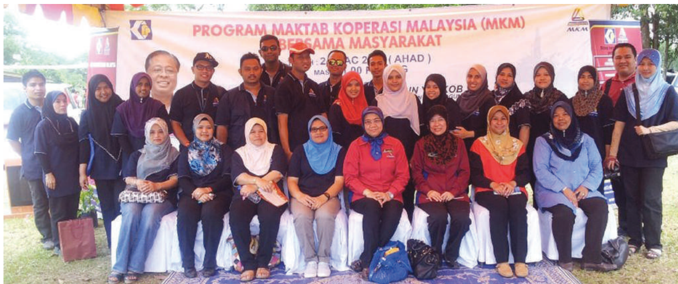
Kakitangan MKM yang terlibat sepanjang program berlangsung

Maktab Koperasi Malaysia (MKM) melakarkan satu lagi sejarah pada tanggal 22-24 Mac 2013 apabila MKM buat julung kalinya menganjurkan program di bawah tanggungjawab sosial (CSR) yang bertujuan mendekati masyarakat koperasi khususnya dan masyarakat luar bandar umumnya.