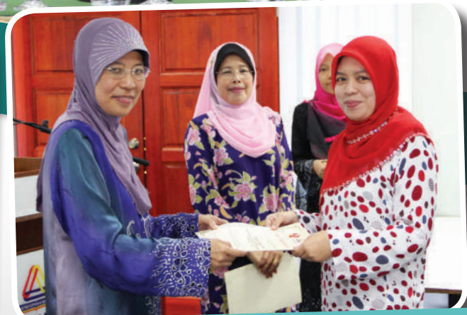
MESYUARAT AGUNG PUSPANITA 22 FEBRUARI 2013