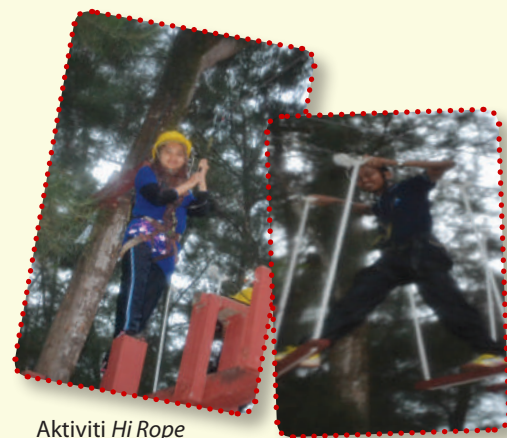
Aktiviti Hi Rope

Melalui aktiviti yang telah dijalankan ini, ia mampu membina nilai positif dalam diri mahasiswa MKM. Selain itu ia juga dapat melahirkan generasi mahasiswa yang mempunyai sifat kepimpinan yang tinggi serta dapat mewujudkan integrasi sosial antara mahasiswa dengan masyarakat setempat.- Nor Fadhilah Mohd.