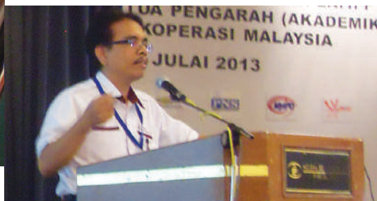
Setiausaha KPPCB sedang berkongsi pengalaman

Laporan Ekonomi 2012/2013 menganggarkan sumbangan sektor pengangkutan dan penyimpanan sebanyak 5.2% kepada Keluaran Dalam Negara Kasar (KDNK) dan diunjurkan peningkatan kepada 6.7% untuk tahun 2013. Sehingga tahun 2011, terdapat 418 buah koperasi terlibat dalam sektor ini dengan hasil sebanyak RM558 juta. Prestasi ini perlu dipertingkatkan untuk memastikan sumbangan koperasi dalam sektor pengangkutan adalah signifikan.