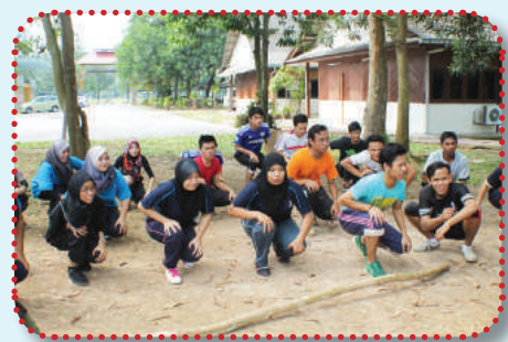
Penalti yang dikenakan kepada pelajar