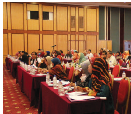
Sebahagian peserta yang hadir