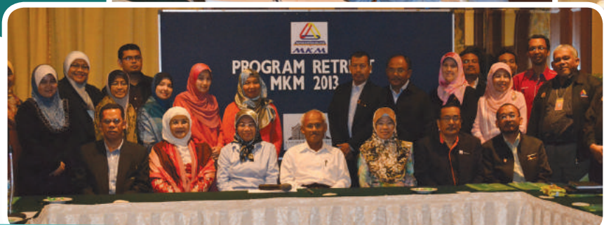
PROGRAM RETREAT MKM 2013 15 FEBRUARI 2013