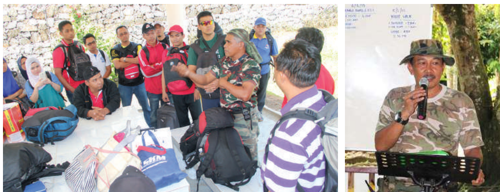
Sesi taklimat mengenai aktiviti yang akan dijalankan

Taman Negara menjadi sebuah destinasi ekopelancongan terkenal di Malaysia. Terdapat banyak daya tarikan dari segi geologikal dan biologikal di taman ini serta sesuai untuk semua aktiviti. Menempuh perjalanan selama 3 jam dari Kuala Lumpur ke Taman Negara Kuala Pahang amat memematkan. Namun, ianya sangat berbaloi apabila dapat menjejakan kaki di sana. Keindahan hutan hujan tropika, kicauan unggas, serta bunyi aliran Sungai Tembeling begitu mengasyikkan.