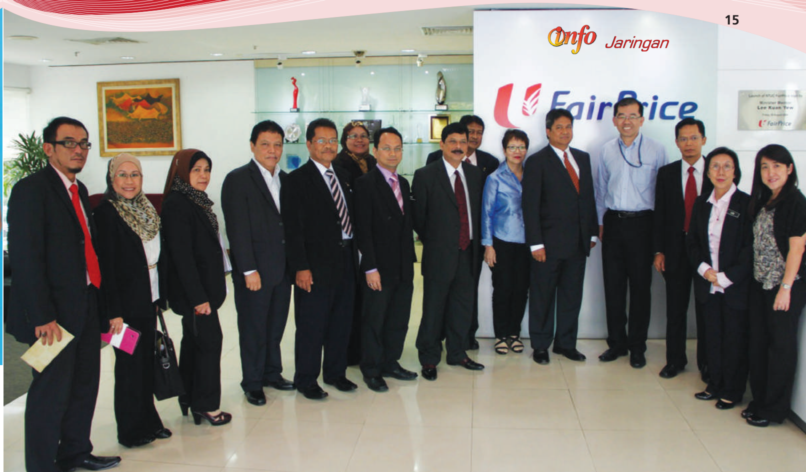
Semasa lawatan ke NTUC FairPrice bersama Mr Ah Yam

Koperasi di Singapura tidak membayar cukai korporat tetapi mereka harus membayar levi. Kerajaan telah menstrukturkan sedemikian rupa untuk membantu koperasi terutamanya koperasi kampung. Pendapatan levi ini tidak disalurkan kepada Jabatan Hasil (Inland Revenue).