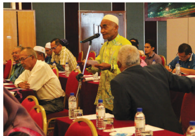
Sesi soal jawab