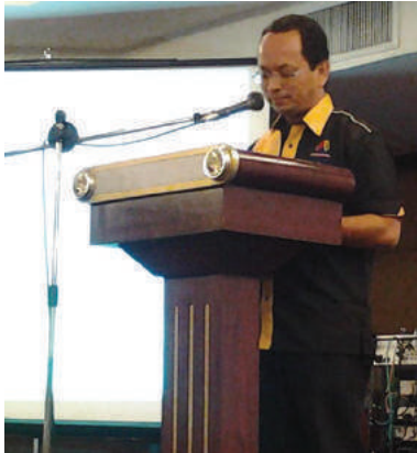
Ketua Pengarah MKM merasmikan majlis