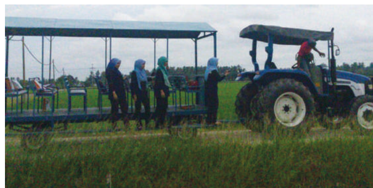
Antara penduduk kampung yang menjalani aktiviti petang mereka