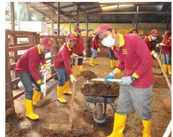
Peserta kursus sedang menjalani latihan amali mengumpul tinja lembu

lebih maju dan berdaya saing dalam industri ini agar lebih berjaya di masa hadapan. Program ini juga mendapat sambutan yang menggalakkan dan para peserta juga berharap program seperti ini dapat diteruskan lagi di masa akan datang. - Norhayati Abd Rahman