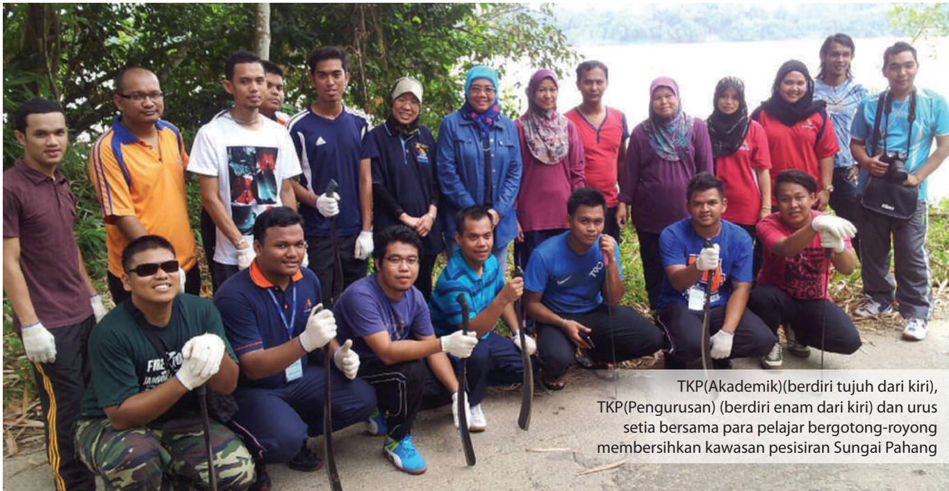
TKP(Akademik)(berdiri tujuh dari kiri), TKP(Pengurusan) (berdiri enam dari kiri) dan urus setia bersama para pelajar bergotong-royong membersihkan kawasan pesisiran Sungai Pahang

Secara keseluruhannya program MKM bersama masyarakat ini dilihat berjaya membuka minda pelajar serta mendidik jati diri dan ketahanan pelajar bagi mewujudkan pelajar MKM yang berkebolehan dan tidak hanya tertumpu kepada aspek akademik semata-mata. Selain itu program ini berjaya memperkenalkan MKM kepada