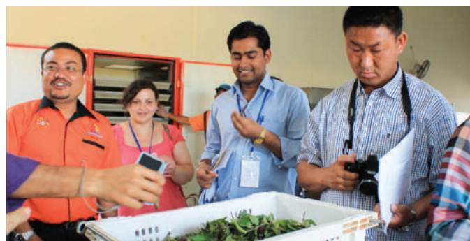
Lawatan ke Koperasi Pekebun Getah Negeri Melaka Berhad dan Koperasi Anggota-anggota Kerajaan Batu Pahat Berhad

Perkhidmatan Perpustakaan MKM yang bertujuan untuk memperkenalkan identiti Malaysia di mata dunia.