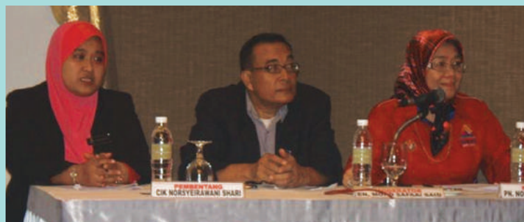
Sesi pembentangan kajian kes oleh pegawai latihan MKM

Program dua hari ini telah dihadiri oleh seramai 56 orang peserta yang terdiri dari Timb. Ketua Pengarah (Akademik), Pengarah Pusat dan Cawangan, pegawai latihan dari MKM Petaling Jaya, Cawangan Sabah, Sarawak, Utara, Timur, Selatan, dua orang pegawai dari KPDNKK Sarawak, dua orang pegawai SKM Sarawak dan seorang pegawai ANGKASA Sabah