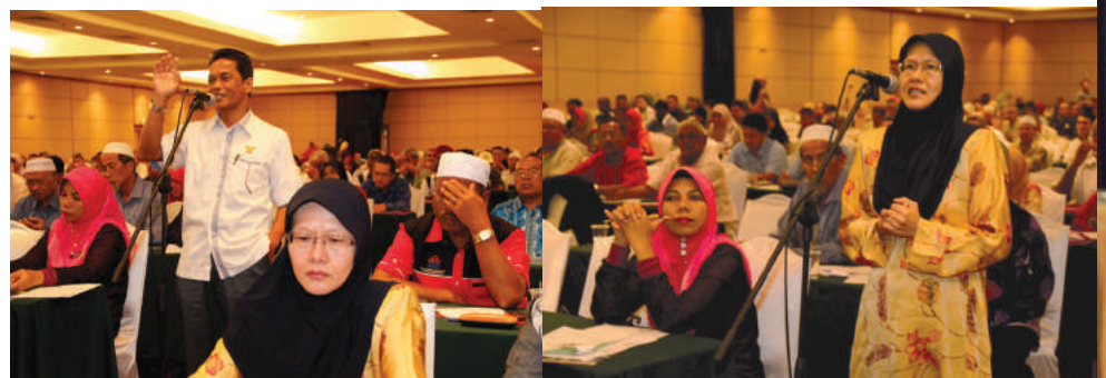
Sesi soal jawab