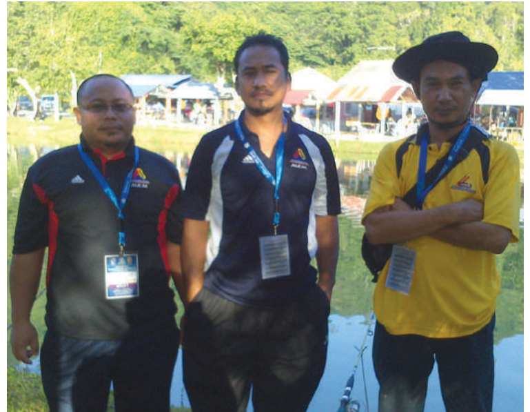
Pasukan memancing MKM