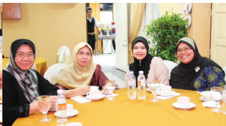
Tetamu jemputan menikmati juadah berbuka puasa