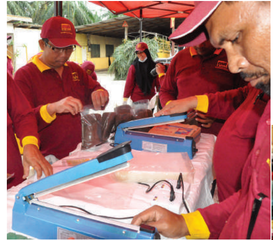
Proses pembungkusan baja organik

Maklum balas diberikan oleh peserta ialah kursus ini dapat membantu perniagaan penternakan mereka untuk