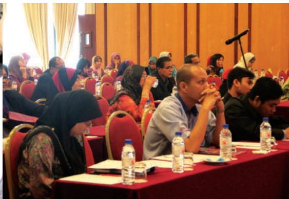
Khusyuk mendengar ceramah