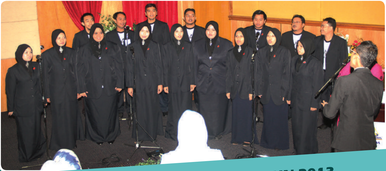
KUMPULAN KOIR MKM 21 JUN 2013