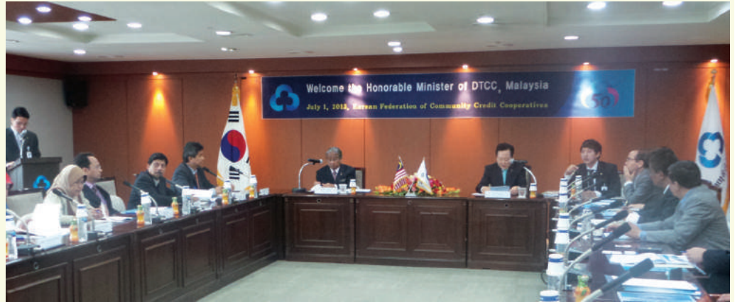
YB Menteri dan rombongan ketika perbincangan bersama KFCC