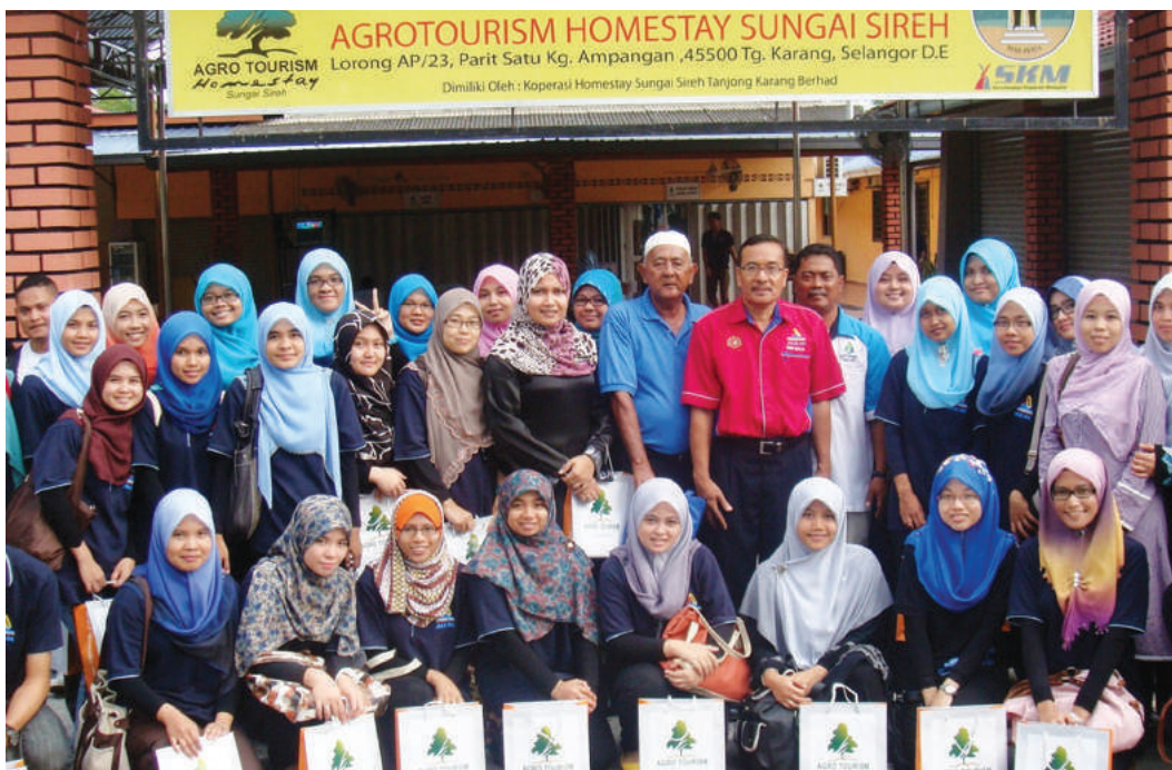
Bergambar sebelum berangkat pulang

dan Kepimpinan Koperasi) kepada Koperasi Homestay Sungai Sireh Tanjung Karang Berhad Tanjung Karang, Kuala Selangor. Sebelum pulang, kami diberikan kesempatan untuk mengelilingi kampung Sungai Sireh tersebut dengan menaiki jentera beramai-ramai. Perasaan kami sekali lagi teruja kerana barangkali ada antara kami baru pertama kali