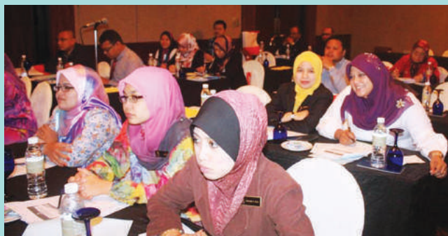
Antara peserta program kolokium 2013 yang hadir