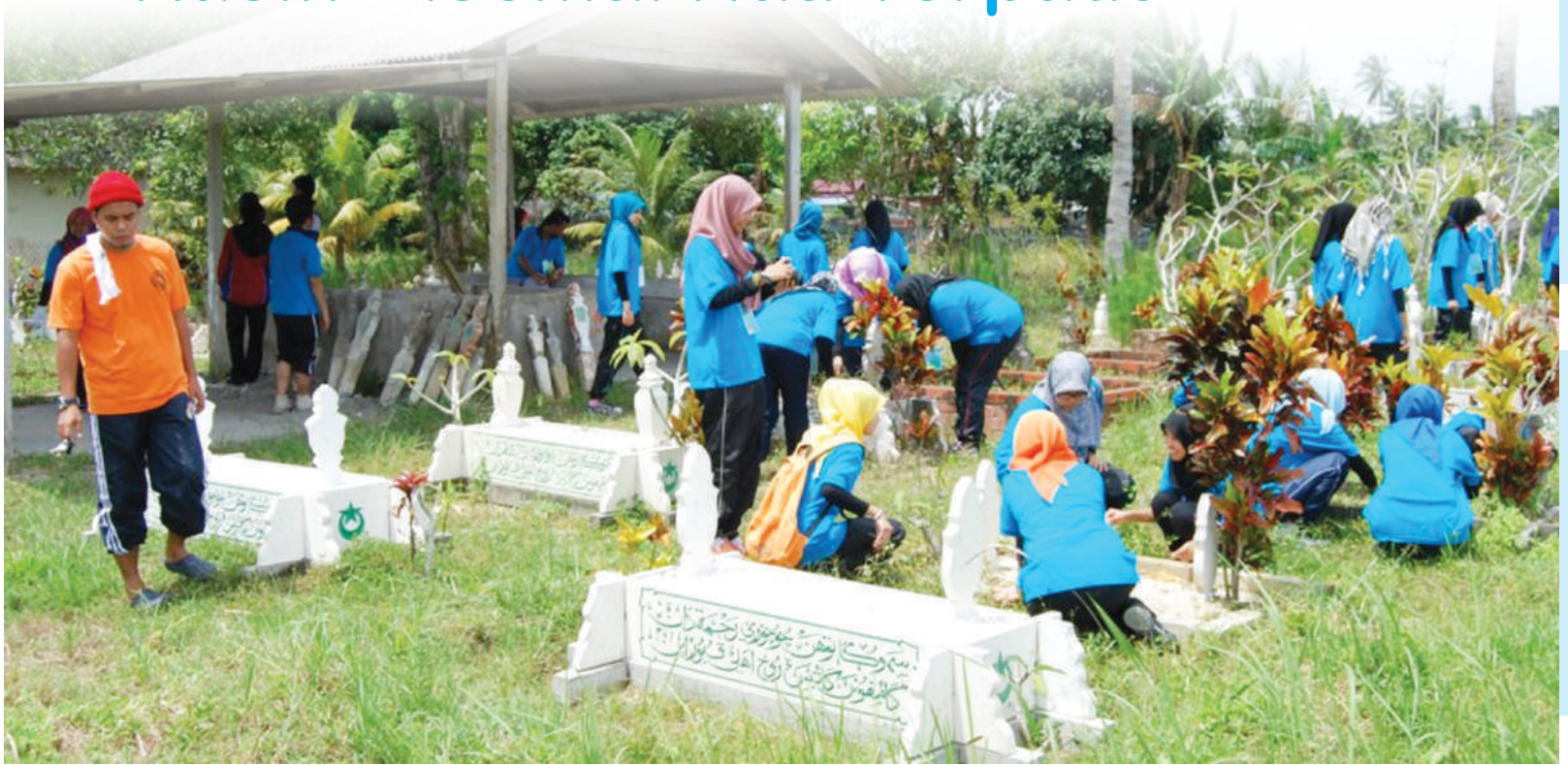
Gotong royong membersihkan kawasan kubur