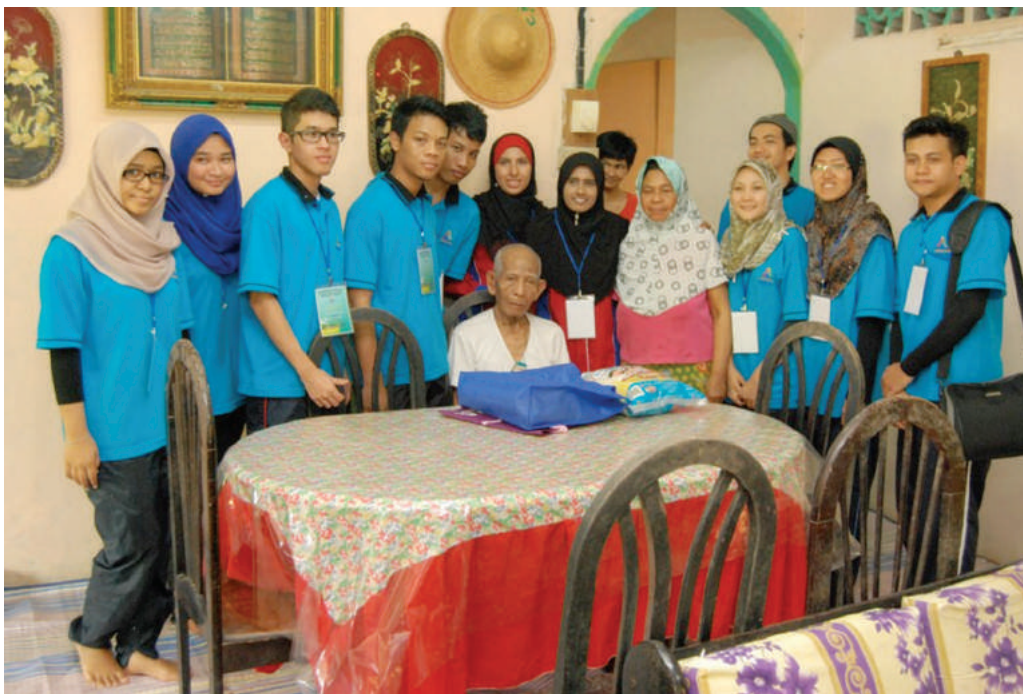
Lawatan ke rumah keluarga angkat

Pada 22-24 Februari 2013, Pusat Antarabangsa dan Pendidikan Tinggi Maktab Koperasi Malaysia di bawah subjek Kokurikulum telah menganjurkan Program Keluarga Angkat “Kasih Disemai Hati Terpaut” di Kampung Tenglu Mersing Johor yang melibatkan seramai 38 peserta program dan 20 orang ahli jawatankuasa pelaksana. Para peserta serta ahli jawatankuasa pelaksana terdiri daripada pelajar Diploma Pengurusan Koperasi Semester 2.