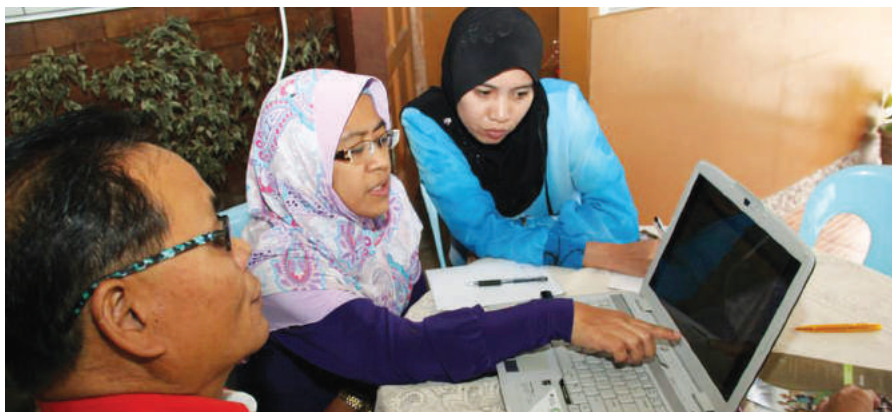
Perbincangan antara Pengarah MKM Caw. Sabah dan wakil dari Koperasi Walai Tokou

Kampung Sinsinan terletak di kaki Gunung Kinabalu, 13km dari Pekan Ranau dan 98km dari Kota Kinabalu. Kampung ini telah diwujudkan pada 1932 dan kini kampung ini dihuni oleh seramai 968 orang penduduk. Kebanyakan dari penduduknya bekerja sebagai petani dan pekebun manakala generasi muda lebih minat bekerja sebagai kakitangan Kerajaan atau pun syarikat swasta.