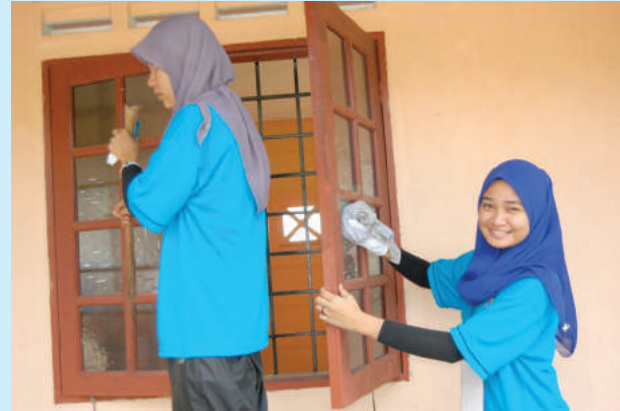
Gotong-royong membersihkan balai raya