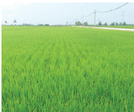
Sawah padi terbentang luas di Kampung Sungai Sireh Tanjung Karang