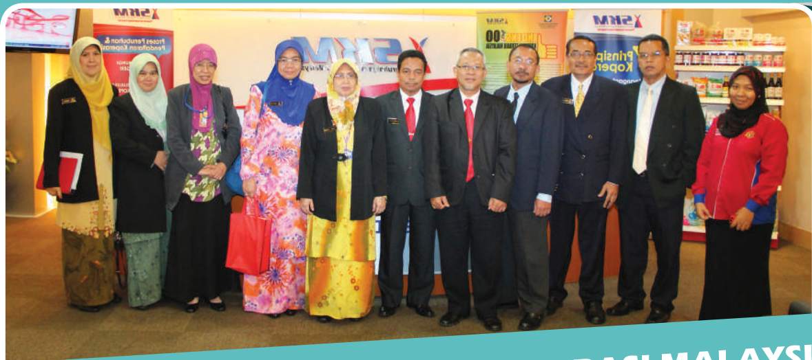
LAWATAN KE SURUHANJAYA KOPERASI MALAYSIA 27 FEBRUARI 2013