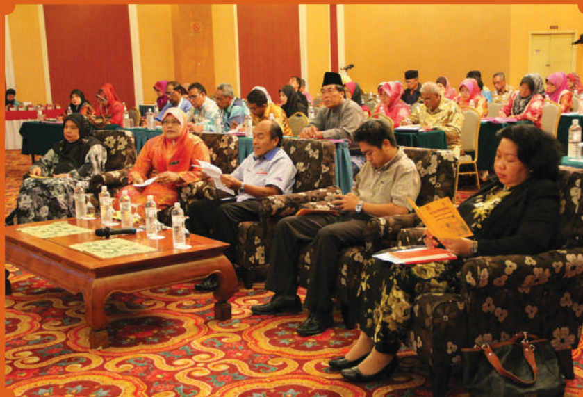
Antara peserta bicara profesional dan tetamu kehormat yang hadir