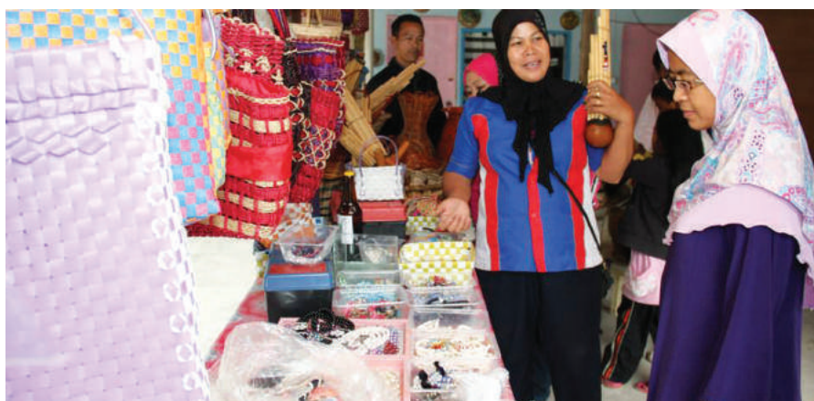
Hasil kraf tangan untuk dijual kepada pengunjung