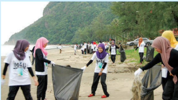
Gotong-royong membersihkan kawasan pantai