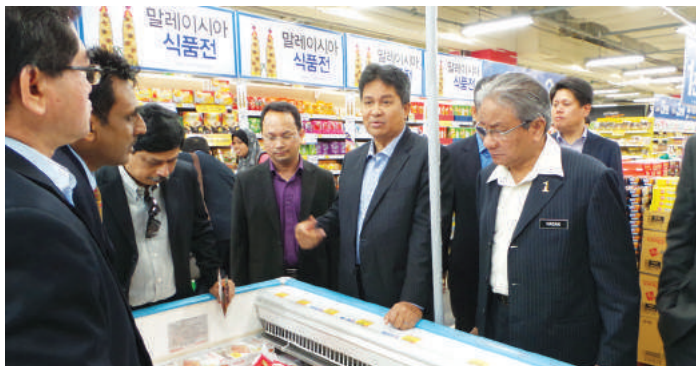
YB Menteri dan rombongan ketika meneliti produk IKS Malaysia di salah sebuah cawangan Homeplus

Di samping itu, YB Menteri dan rombongan turut melawat Seoul National University Co-operative . Koperasi ini dimiliki oleh Seoul National University. Koperasi ini banyak memberi faedah dan kebajikan kepada pelajar universiti bagi memenuhi keperluan mereka. Pelajar sebagai anggota koperasi memperoleh faedah potongan harga bagi alat tulis dan