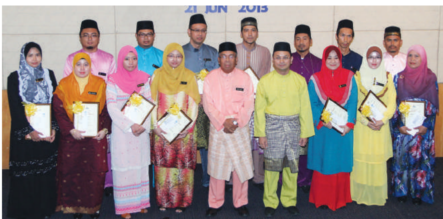
Penerima Anugerah Perkhidmatan Cemerlang 2012