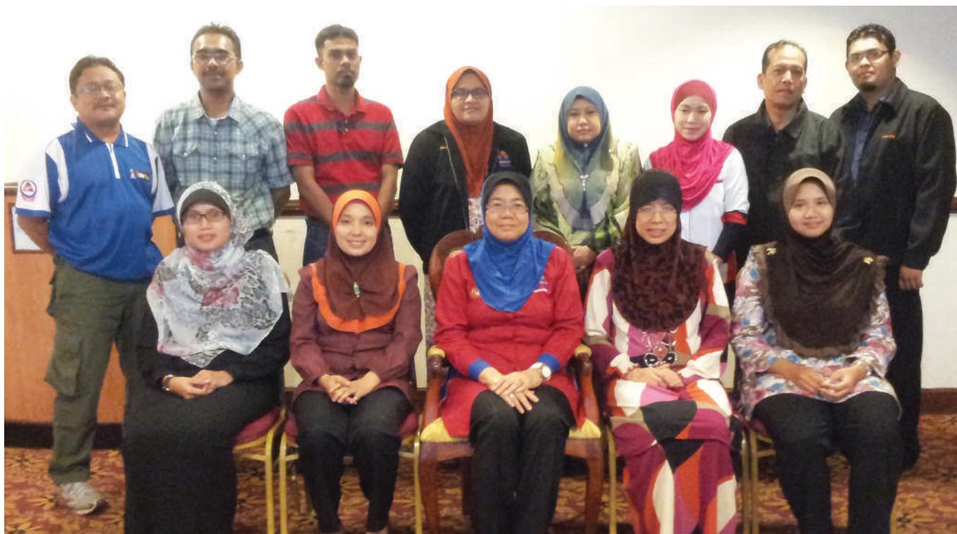
Ahli mesyuarat MBJ

Pada 28 Jun 2013 yang lalu, Maktab Koperasi Malaysia (MKM) telah mengadakan Mesyuarat Bersama Jabatan (MBJ) di Holiday Villa, Alor Setar Kedah. Seramai tiga belas orang ahli mesyuarat MBJ telah menghadiri mesyuarat tersebut.