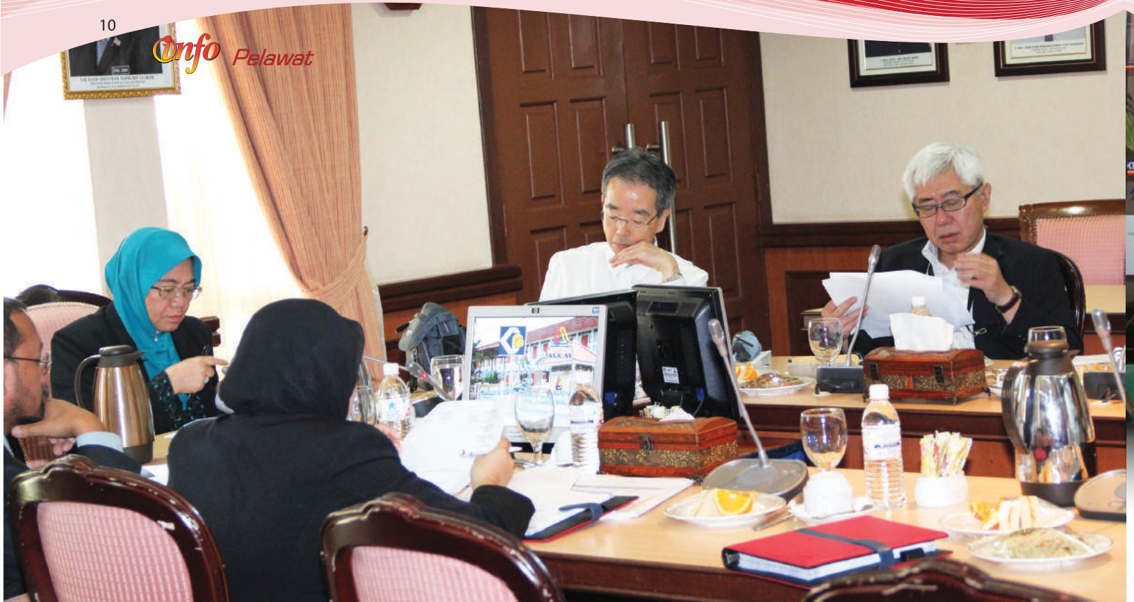
Ahli mesyuarat sedang mendengar pembentangan keberkesanan program luar negara