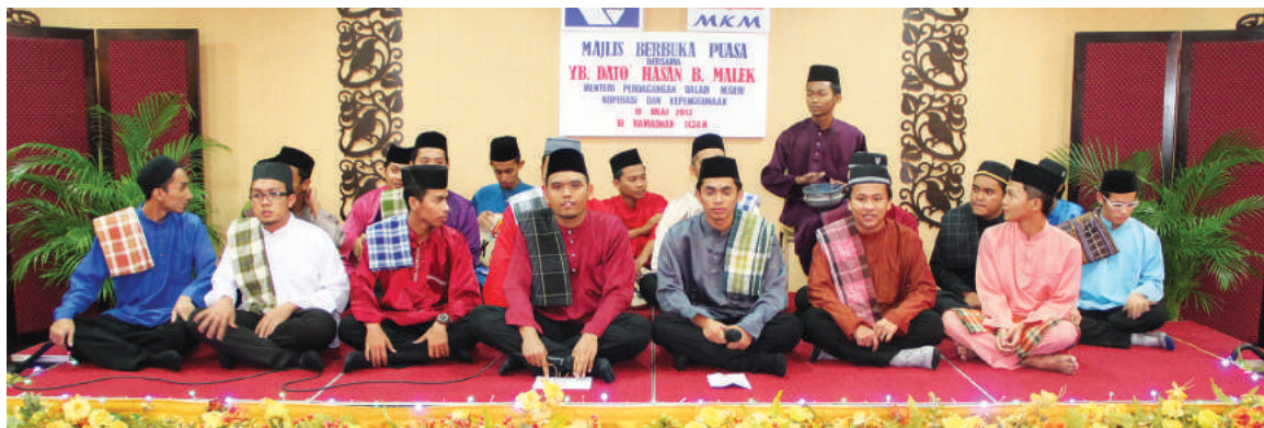
Persembahan qasidah oleh pelajar MKM