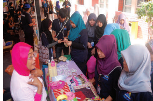
Sebahagian pameran dari MAKNA dan AADK