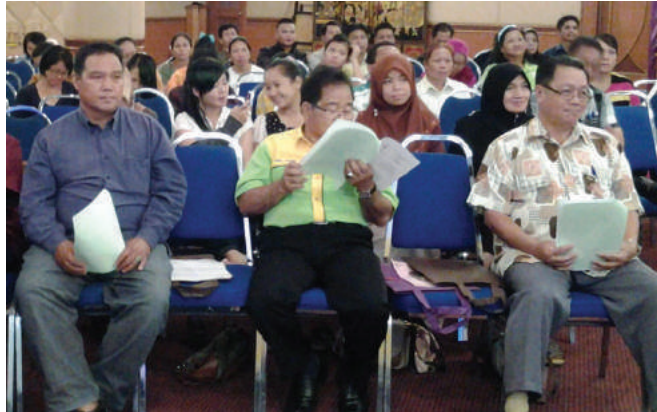
Antara peserta yang turut hadir