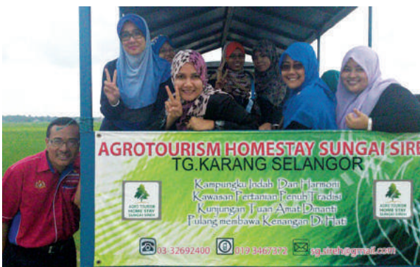
Jentera yang membawa kami mengelilingi Kampung Sungai Sireh Tanjong Karang