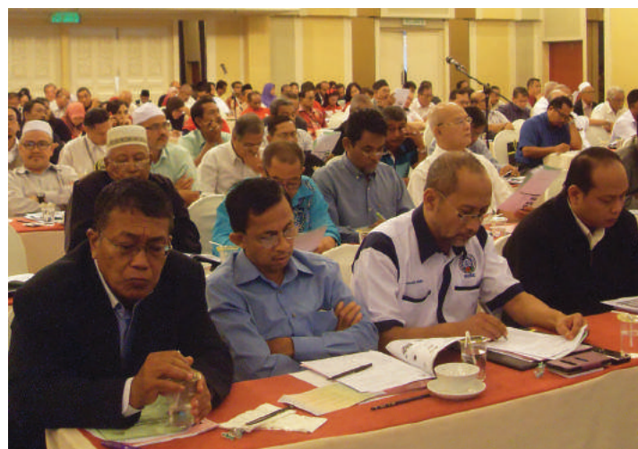
Antara peserta yang hadir