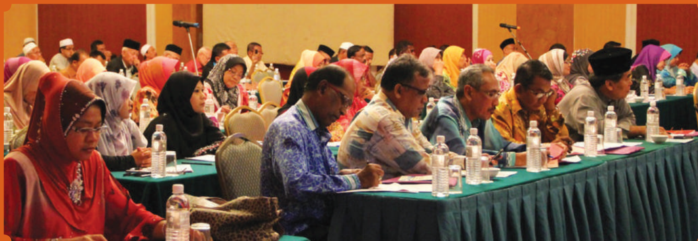
Barisan koperator yang hadir sekitar wilayah Johor dan Melaka