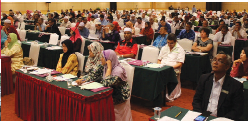
Sebahagian peserta Bicara Profesional

Pematuhan terhadap perundangan koperasi merupakan suatu perkara yang signifikan dan perlu dititikberatkan oleh koperasi. Ia mencerminkan konsep tadbir urus yang baik bagi sesebuah koperasi. Peruntukan Seksyen 86B Akta Koperasi 1993, telah menzahirkan kuasa kepada pihak Suruhanjaya Koperasi Malaysia (SKM) untuk mengeluarkan garis panduan yang perlu untuk memberi kuat kuasa sepenuhnya kepada peruntukan Akta. Justeru, semua koperasi dikehendaki untuk mematuhi peruntukan yang terdapat dalam garis panduan yang dikeluarkan oleh SKM.