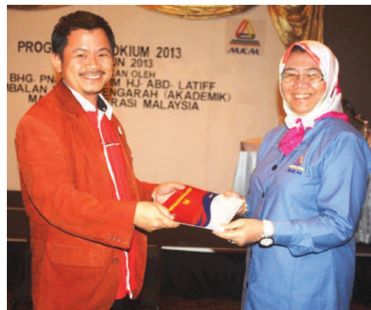
Penyampaian cenderamata dan sijil

pengurusan yang membincangkan isu dan masalah berkaitan pentadbiran dan pengurusan koperasi yang boleh menjadi bahan rujukan kepada tenaga pengajar untuk merancang dan memimpin pembelajaran yang lebih sistematik semasa menggunakan kajian kes ini sebagai bahan pengajaran.