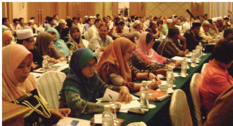
Sebahagian peserta yang menghadiri Bicara Profesional