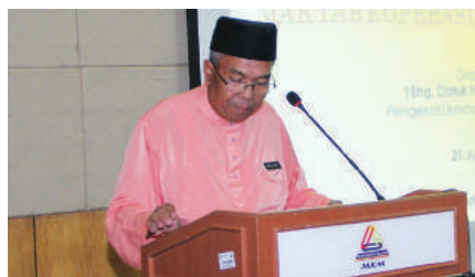
Dato' Hj. Md. Yusof bin Samsudin merasmikan majlis

Selaras dengan transformasi negara ke arah budaya kerja cemerlang, Anugerah Perkhidmatan Cemerlang (APC) merupakan penghargaan Kerajaan kepada pegawai perkhidmatan awam yang telah memberi perkhidmatan cemerlang di samping pengiktirafan terhadap perkhidmatan yang bermutu tinggi berdasarkan prestasi tahunan pegawai. Ini bertujuan untuk mengiktiraf prestasi kerja anggota berkenaan di samping mengambil kira sumbangannya yang