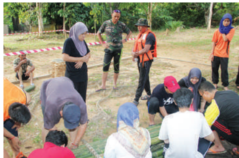
Gigih menyiapkan rakit