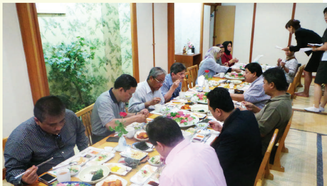
Makan tengah hari bersama YB Menteri dan rombongan yang telah dihoskan oleh MKM