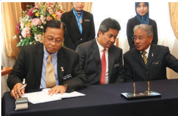
YB Dato' Hasan Malek (kanan) menandatangani portfolio penyerahan tugas sebagai Menteri PDNKK

Tanggal 22 Mei 2013, bertempat di Kementerian Perdagangan Dalam Negeri, Koperasi dan Kepenggunaan (KPDNKK) telah diadakan Majlis Serah Tugas antara Mantan Menteri KPDNKK YB Dato' Sri Ismail Sabri bin Yaakob dengan Menteri KPDNKK yang baru iaitu YB Dato' Hasan bin Malek serta Mantan Timbalan Menteri KPDNKK YB Datuk Hj. Rohani Abd. Karim dengan YB Dato' Paduka Ahmad Bashah bin Md. Hanipah sebagai Timbalan Menteri KPDNKK yang baru.