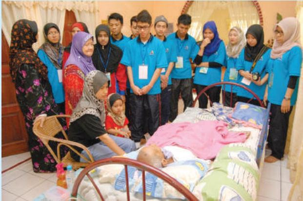
Lawatan ke rumah penduduk kampung yang uzur