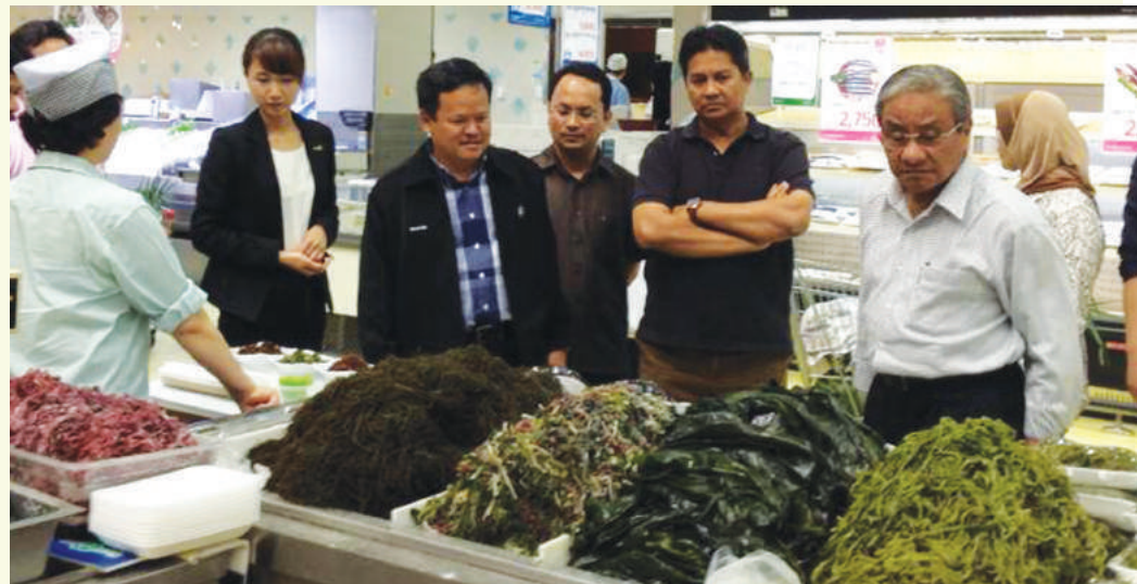
YB Menteri dan rombongan ketika melawat Hanaro Club Mart