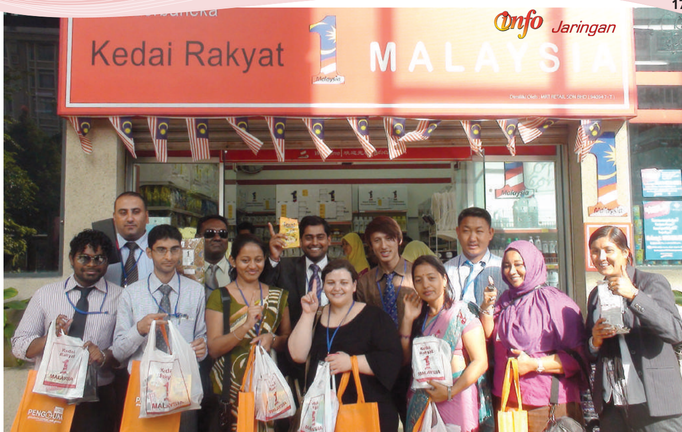
Lawatan ke Kedai Rakyat 1 Malaysia (KR1M) di Kementerian Perdagangan Dalam Negeri Koperasi dan Kepenggunaan