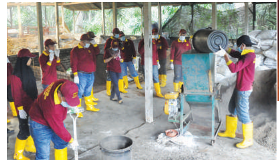
Latihan amali untuk menghancurkan tinja