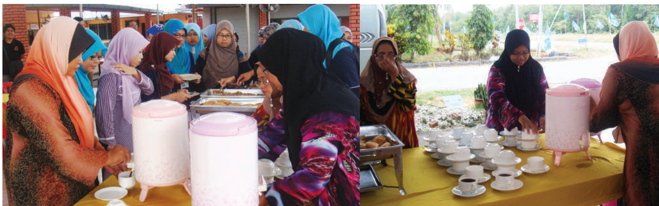
Layanan yang diberikan oleh Anggota Koperasi Homestay