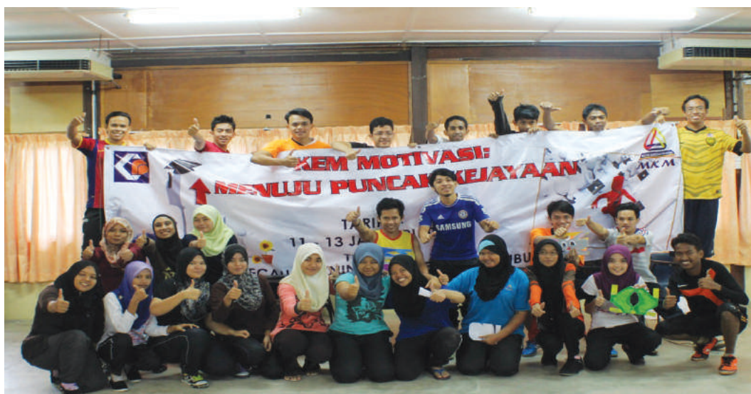
Pelajar bergambar kenangan

Pada 11-13 Januari 2013, Pusat Antarabangsa dan Pendidikan Tinggi telah menganjurkan program Kem Motivasi di Kem Bina Semangat Ampang Pecah Training Centre. Seramai 26 orang pelajar Diploma Pengurusan Koperasi telah mengikuti program ini. Empat orang fasilitator turut terlibat dalam program ini.