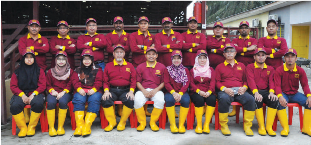
Peserta kursus Pemprosesan Baja Organik Tinja Kambing & Lembu Secara Komersial