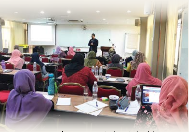
Antara peserta yang hadir sewaktu bengkel.