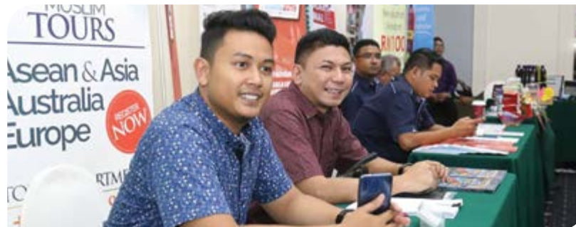
Kopetro Travel & Tours Sdn. Bhd. dan Agensi HRDF juga hadir bagi memeriahkan lagi program seminar halal pada kali ini.