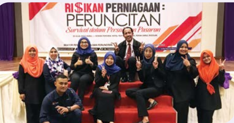
Sekretariat IKM yang terlibat.