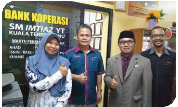
KP bergambar bersama ALK Kop. SM Imtiaz YT Kuala Terengganu Bhd.