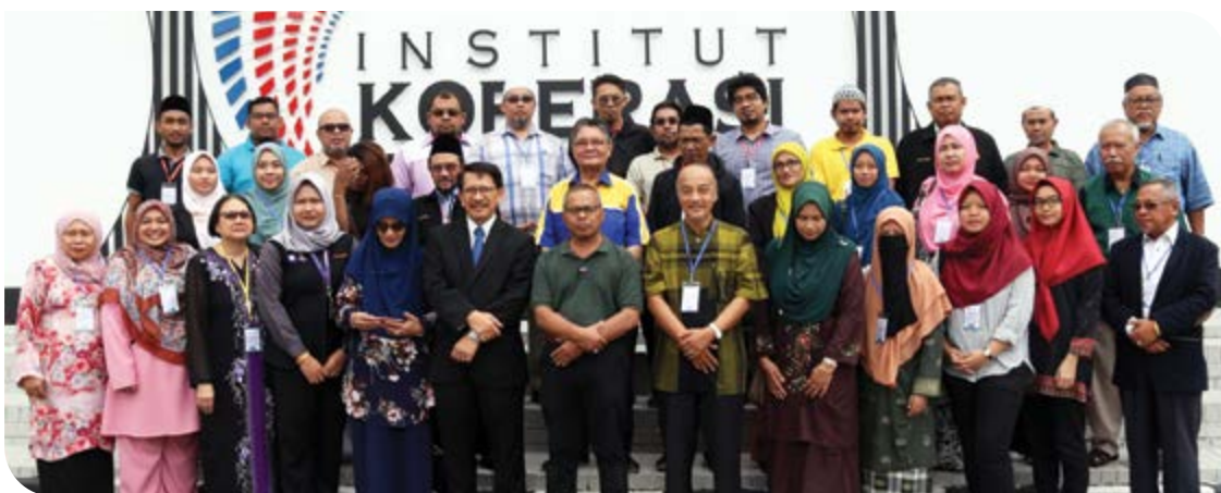
Para peserta bergambar kenangan.

Sebagai kemuncak program, peserta telah menduduki peperiksaan bagi menguji sejauh mana kefahaman mereka berkenaan dengan tugas kesetiausahaan dan telah mendapat markah yang tinggi dan lulus dengan cemerlang. Pihak Zon Tengah dan Pembangunan Koperasi berharap agar segala ilmu dan pendedahan yang diberikan dapat sedikit sebanyak membantu para peserta menjalankan tugas-tugas setiausaha dengan lebih berintegriti dan berkemampuan.