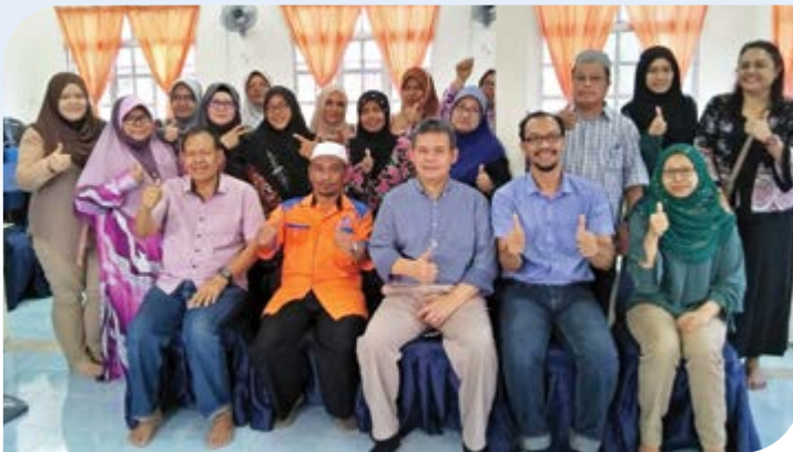
Barisan delegasi IKM bergambar bersama ALK Koperasi Rukun Tetangga Telaga Batin Terengganu Bhd.