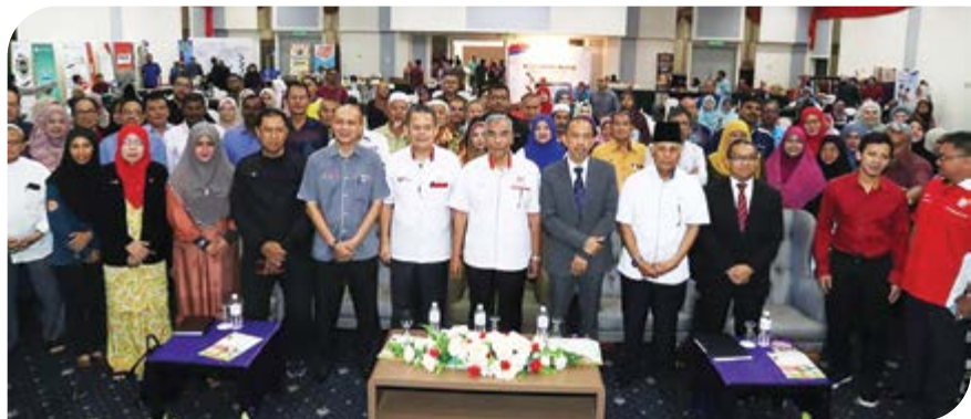
Para peserta seminar berkesempatan bergambar kenangan bersama YB. Datuk Wira Dr. Mohd Hatta Md Ramli serta tetamu kehormat yang hadir.

Pada 31 Julai hingga 01 Ogos 2019 yang lalu, telah berlangsung satu seminar bertajuk “Tingkatkan Pendapatan Perniagaan dengan Pensijilan Halal” bertempat di Grand Beach Resort, Port Dickson, Negeri Sembilan anjuran Pusat Pengurusan Perniagaan (PPP), Institut Koperasi Malaysia (IKM).