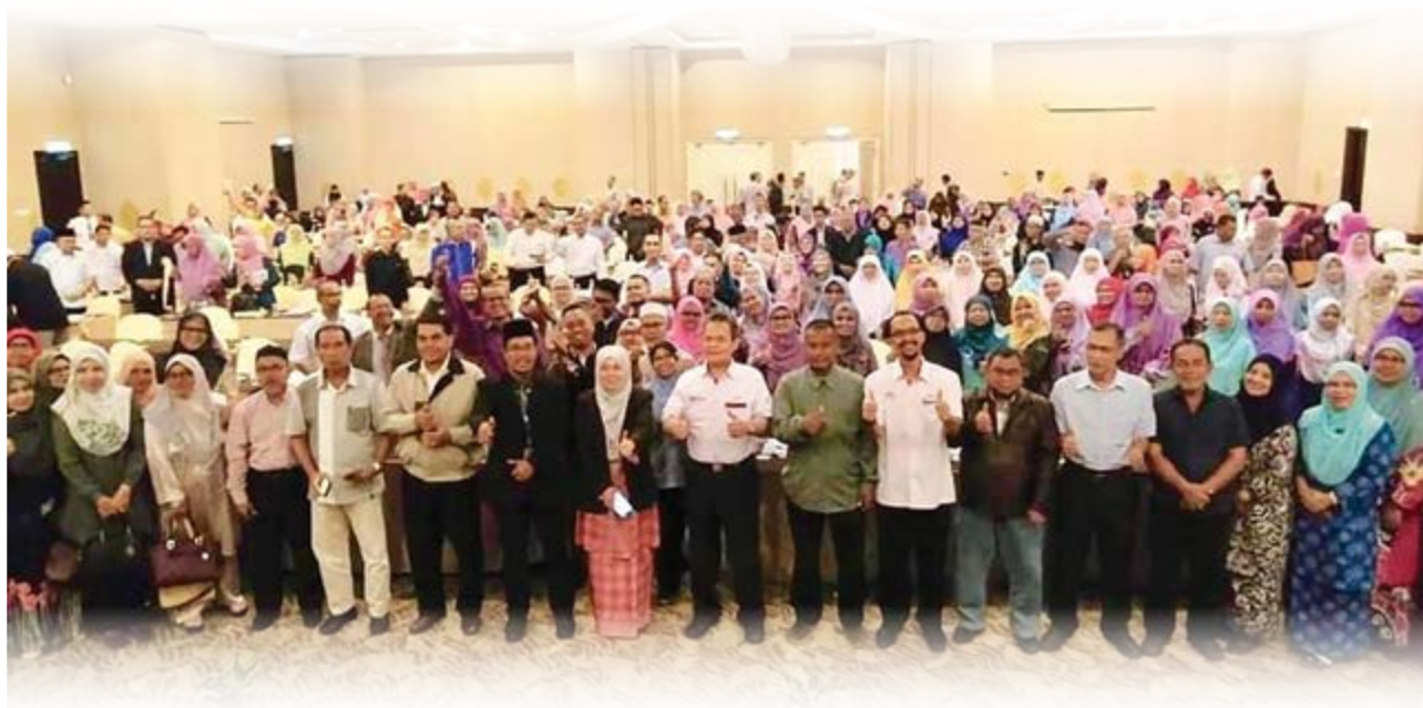
Ketua Pengarah IKM bergambar bersama peserta yang hadir.