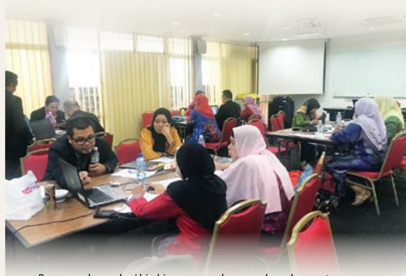
Penceramah memberi bimbingan secara langsung kepada peserta.