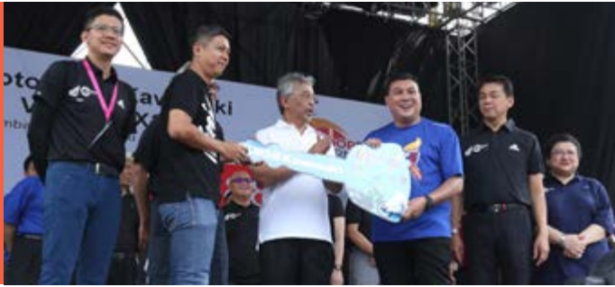
MED COOPRENEUR CARNIVAL 2019 08 - 10/11/2019