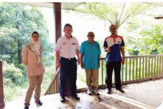
Melawat tapak kawasan yang bakal dibangunkan sebagai chalet koperasi.