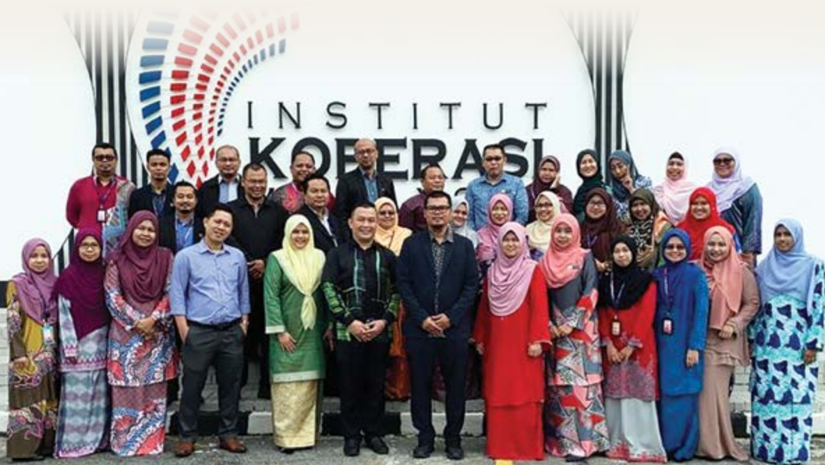
Peserta Bengkel Penulisan Artikel Jurnal bergambar bersama penceramah.

Pada awal sesi bengkel, penceramah telah memberi gambaran secara umum tentang artikel jurnal dan memberi sedikit motivasi kepada para peserta dalam menulis dan menerbitkan artikel jurnal. Penceramah juga menerangkan topik-topik yang akan dibincangkan sepanjang dua hari bengkel. Dalam menulis dan menerbitkan artikel jurnal, penceramah telah menerangkan lima asas (keutamaan) yang perlu diambil kira dalam memilih