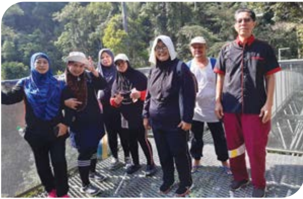
Peserta bergambar di Tree Top Walk (laluan jambatan gantung besi terpanjang di dunia ~ 950 meter panjang yang berada pada ketinggian 50 meter dari tanah).