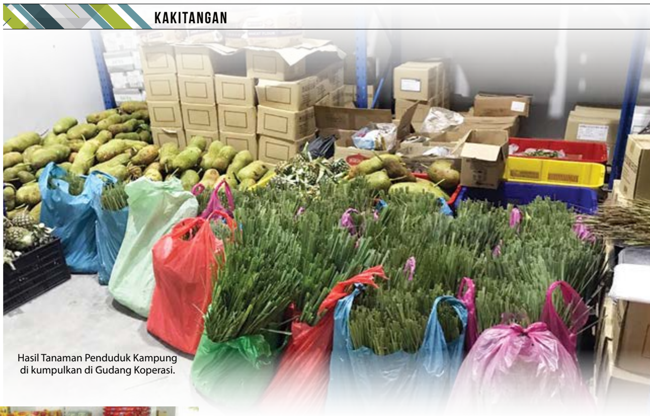
Hasil Tanaman Penduduk Kampung di kumpulkan di Gudang Koperasi.