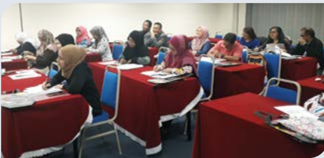
Peserta kursus ketika sesi ceramah di IKM.

Objektif kursus ini adalah untuk memberi kefahaman & pengetahuan tentang potensi perniagaan Spa dan memberi pendedahan berkaitan persediaan koperasi untuk membuka perniagaan Spa. Kursus ini telah mendapat kerjasama dan komitmen yang baik daripada semua peserta. Di samping itu, peserta juga dapat merasai pengalaman sebenar dalam menjalankan aktiviti perniagaan Spa sebenar ketika melawat perniagaan Spa bertaraf lima bintang iaitu Chi The SPA di Hotel Shangri La Tanjung Aru. Selain itu, antara pengisian aktiviti selain sesi ceramah para peserta dapat melakukan aktiviti praktikal dalam teknik urutan muka, kaki dan urutan Malaysia.