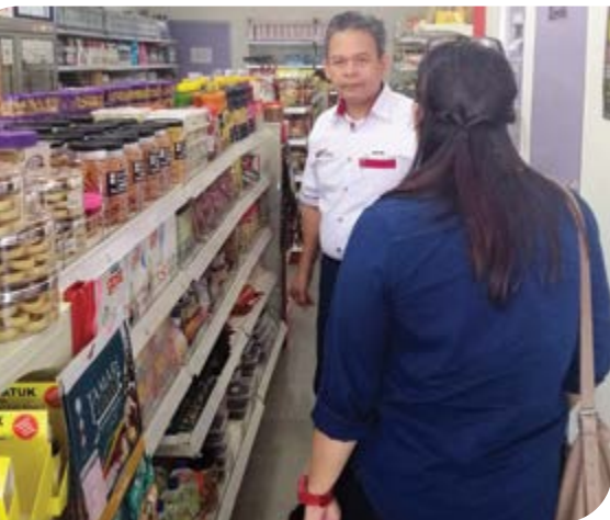
Melawat salah satu kedai menjual produk koperasi dan barangan halal di KOBİ.