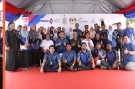
SEMINAR PENYELIDIKAN 2019 "MEMACU KECEMERLANGAN KOPERASI MELALUI PENYELIDIKAN BERIMPAK TINGGI" 12 - 13/12/2019