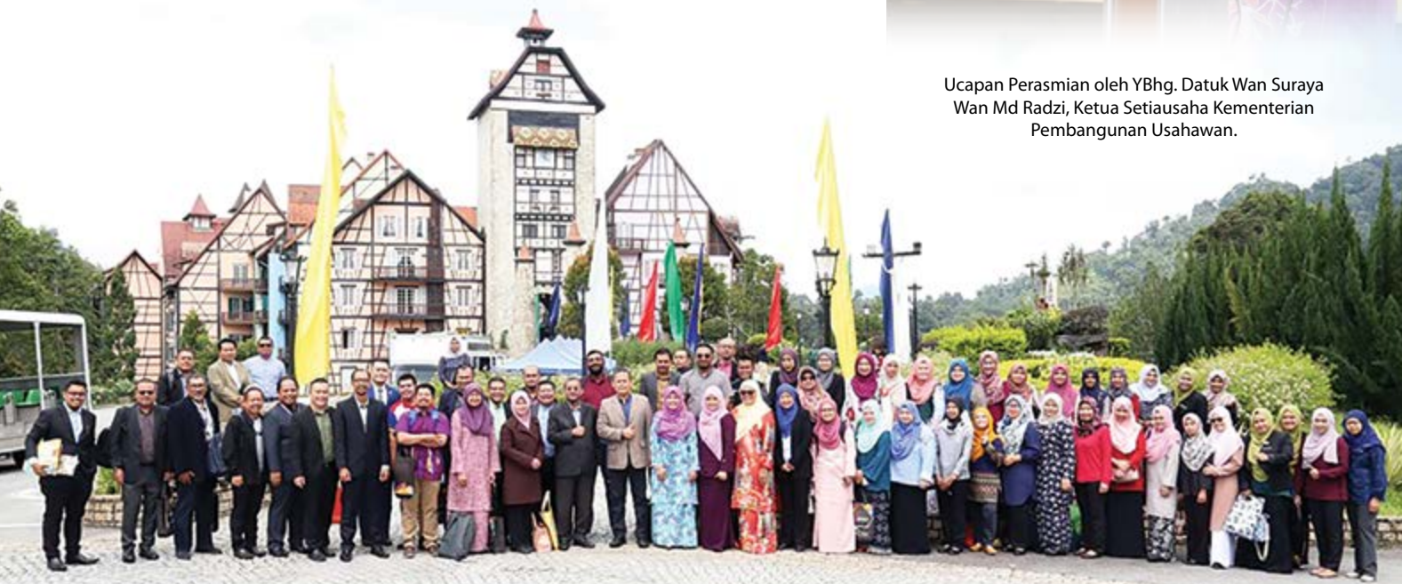
Ketua Pengarah IKM bergambar kenangan bersama peserta Program Kolokium IKM 2019.

M enyedari kepentingan ilmu dalam meningkatkan kualiti Pegawai Latihan, Institut Koperasi Malaysia (IKM) melalui Pusat Penyelidikan telah menganjurkan Program Kolokium IKM 2019 kali ke-12 pada 20 – 21 Jun 2019 bertempat di Colmar Tropicale, Berjaya Hills, Bukit Tinggi. Seramai 85 orang peserta yang terdiri daripada warga kerja IKM, wakil Kementerian dan wakil koperasi terlibat dalam berkongsi pendapat dan perbincangan secara