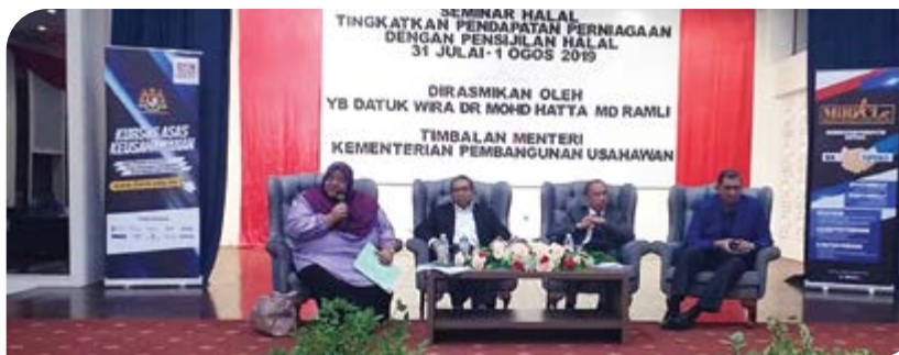
Semasa sesi forum.