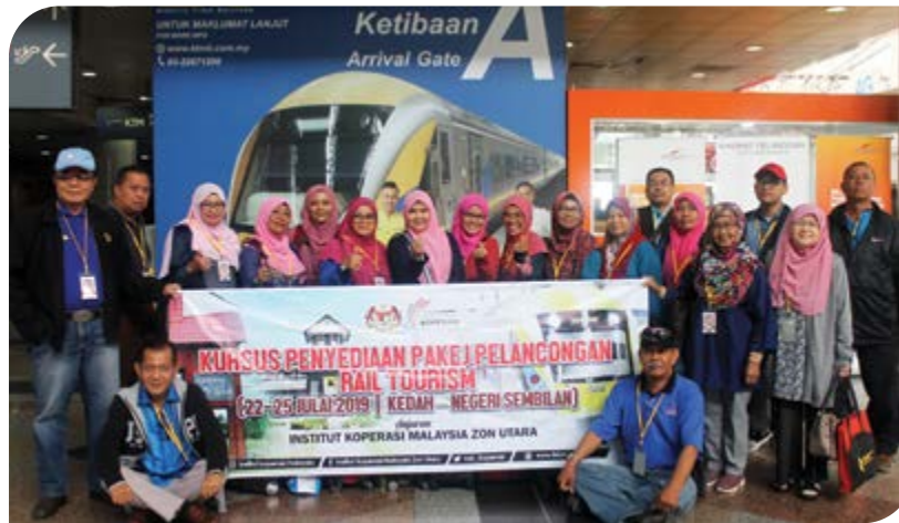
Tiba di KL Sentral.

Pada hari pertama, peserta diberi taklimat dalam kelas tentang pengenalan pelancongan dalam negara dan jenis-jenis pakej pelancongan. Pada hari kedua, peserta menaiki ETS dari Stesen Keretapi Alor Setar ke KL Sentral dan menaiki bas untuk bertolak ke Port Dickson, Negeri Sembilan. Lawatan pertama peserta adalah di Blue Lagoon, Tanjung Tuan sambil melihat keindahan pantai Port Dickson serta menikmati panorama sunset .