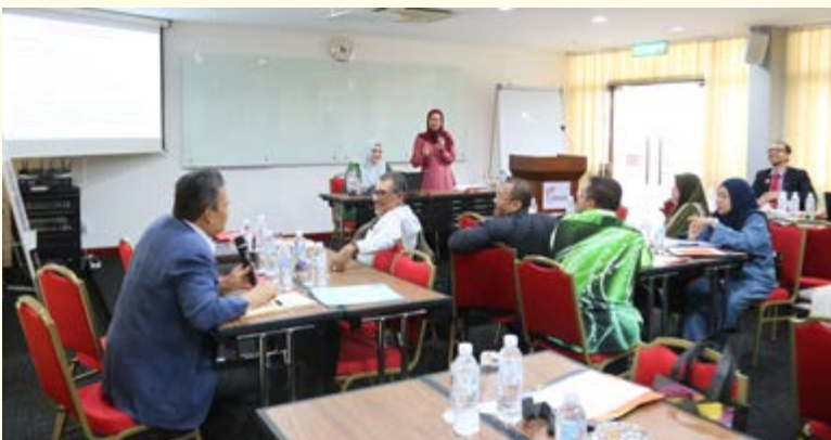
Peserta mendengar pembentangan dari zon-zon bagi koperasi yang berpotensi.