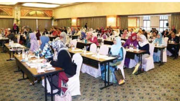
Suasana dalam dewan seminar.

agar setiap perancangan yang dibincangkan dalam program kolokium ini, IKM perlu memastikan bahawa semua program yang dijalankan dan disasarkan mempunyai outcome dalam membantu Kementerian mencapai misi dan visi yang ditetapkan.