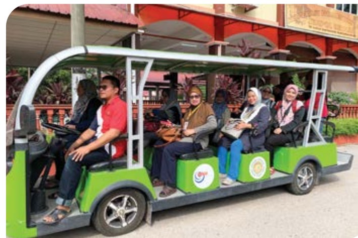
Peserta menaiki trem KOLONEK.