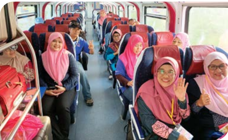
Peserta menaiki Electric Train Service (ETS).