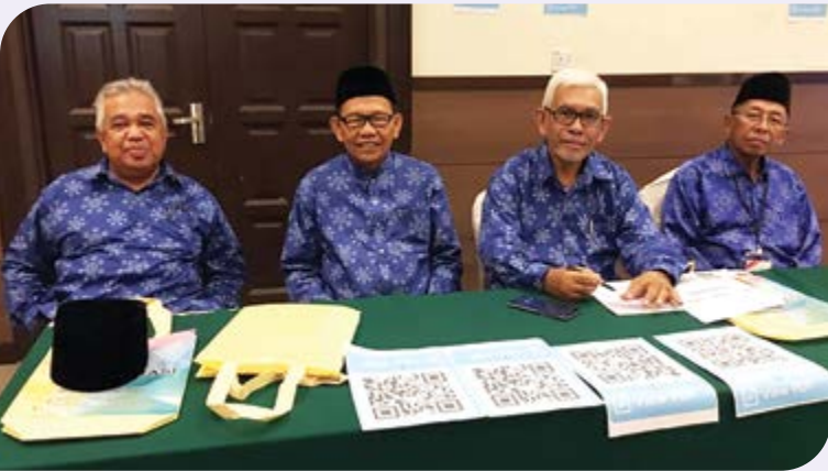
Ahli Jawatankuasa Perhubungan Negeri Perak yang hadir.