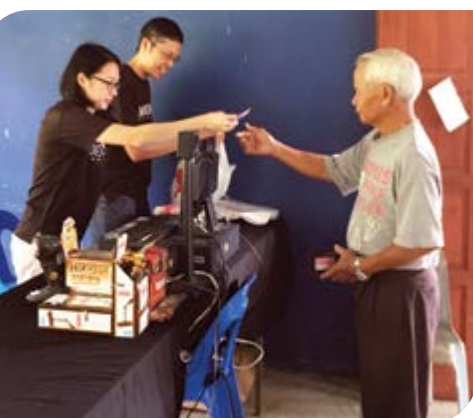
Penduduk kampung membayar tunai kepada juruwang setelah membeli barangan runcit di koperasi.

Menurut En. Darren, pengerusi KOWR, program tersebut telah berjaya memberi keuntungan sekitar RM10,000 – RM12,000 dalam sehari kepada penduduk luar bandar melalui pembelian hasil pertanian mereka. Manakala pihak koperasi juga berjaya mengutip purata hasil jualan bernilai RM10,000 semasa program tersebut berlangsung.