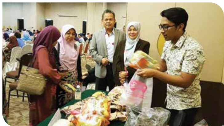
Gerai jualan produk Koperasi Groom Big Terengganu Berhad.