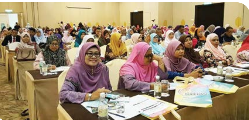
Antara peserta yang hadir ke program 'Coffee Talk' Cipta Nilai, Lonjak Pendapatan!

IKM Zon Timur juga mengambil inisiatif membuka gerai bagi koperasi yang mempunyai produk untuk membuat jualan pada hari program. Antara koperasi yang membuka gerai jualan produk koperasi adalah Koperasi Groom Big Terengganu Berhad, Koperasi Ummu Wahidah Terengganu Berhad dan Koperasi YaPIEM Terengganu Berhad. Secara keseluruhannya, program ini mencapai objektif yang disasarkan. Peserta telah didedahkan dengan peluang dan ruang yang wujud dalam gerakan koperasi bagi meningkatkan sosioekonomi pada masa hadapan. Program ini juga berjaya mengumpulkan para usahawan dan koperasi yang berminat untuk menceburi bidang perniagaan baru iaitu aktiviti perniagaan ternakan arnab pedaging. Diharap IKM Zon Timur dapat menganjurkan program-program seumpama ini lagi pada masa akan datang. Tahniah!