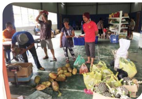
Koperasi menimbang hasil tanaman penduduk kampung.