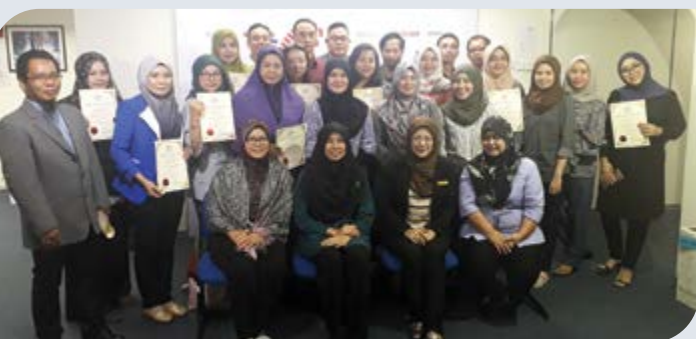
Peserta menerima sijil dari Lembah Impian Spa.

Para peserta telah memberi maklum balas yang positif terhadap inti pati program ini dan bersungguh-sungguh untuk menjalankan perniagaan terapi Spa apabila balik ke koperasi masing-masing bagi membantu meningkatkan ekonomi koperasi dan secara tidak langsung dapat membantu komuniti setempat. Justeru, menjalankan perkhidmatan terapi Spa pastinya membawa pulangan ekonomi kepada koperasi yang terlibat menceburi bidang ini.