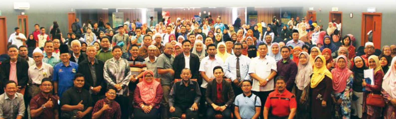
Sebahagian peserta yang hadir di program Bicara Ilmu.