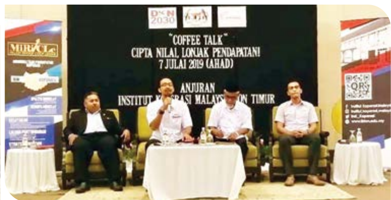
Sesi dialog bersama agensi di bawah Kementerian Pembangunan Usahawan.