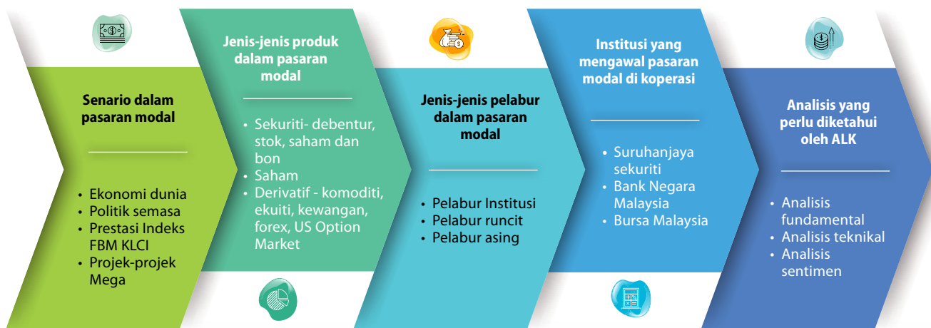
Rajah 1: Panduan pelaburan dalam pasaran modal

Info menarik dalam kursus ini adalah berkaitan lima langkah yang perlu dititikberatkan oleh ALK sebelum mengambil keputusan untuk melabur dalam pasaran modal. Ia kerana untuk mengelakkan koperasi tidak mudah ditipu penyelewangan wang dan lain-lain oleh pihak luar. Antara perkara-perkara yang perlu dititikberatkan oleh ALK adalah: