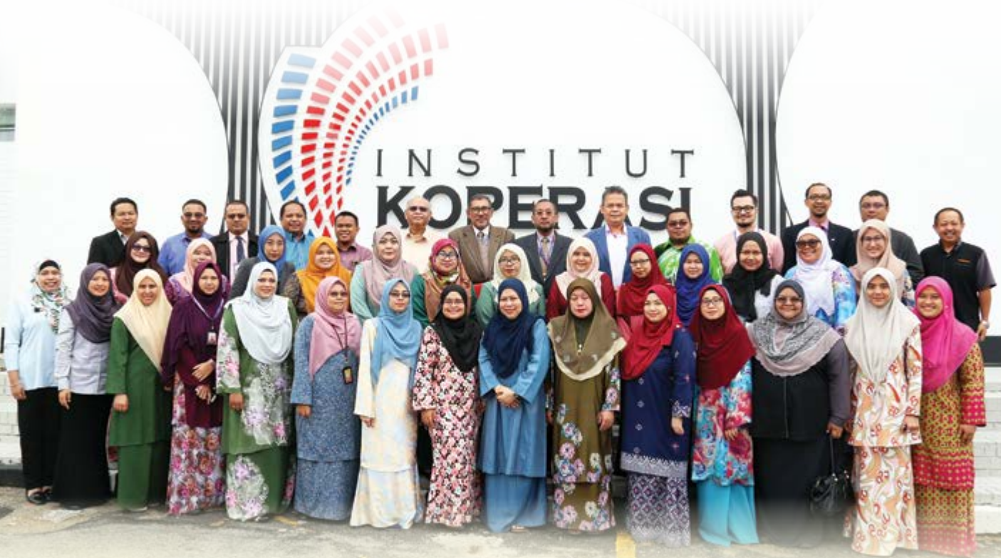
Pegawai yang terlibat dengan Bengkel Analisa Khidmat Perundingan Siri 1.