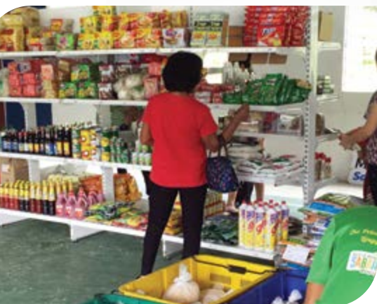
Penduduk kampung sedang membeli barang keperluan.

Modus operandi program tersebut ialah koperasi akan datang ke kampung yang terpilih dan menjadikan balai raya sebagai “meeting point” bagi membekal barang keperluan penduduk pada harga yang sama dengan kawasan bandar, manakala penduduk kampung akan menghantar hasil pertanian mereka kepada pihak koperasi. Hasil tanaman tersebut akan dibawa ke pusat pengumpulan koperasi yang terletak di gudang penyimpanan koperasi di Taman Perindustrian Kota Kinabalu, Sepanggar. Selepas proses pembungkusan, koperasi seterusnya mengedarkan hasil pertanian tersebut ke pasar raya seperti Giant dan Bataras serta restoran di sekitar Kota Kinabalu, Inanam dan Tuaran.