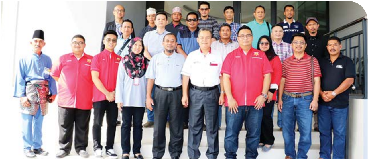
Gambar kenangan peserta kursus bersama Ketua Pengarah IKM.