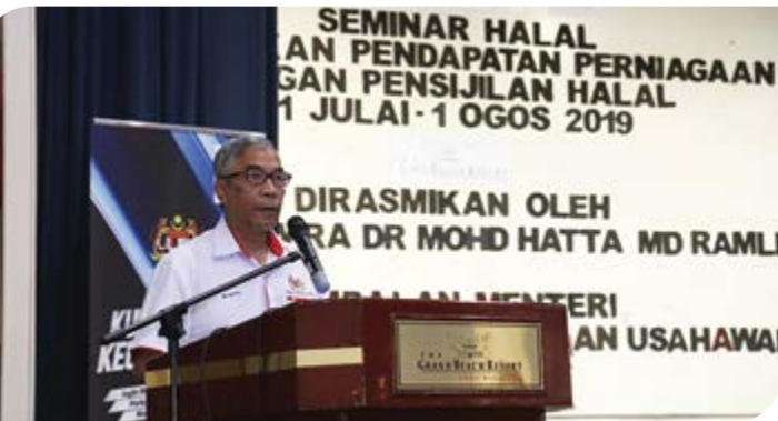
Perasmian Seminar oleh YB. Datuk Wira Dr. Mohd Hatta Md Ramli, Timbalan Menteri Kementerian Pembangunan Usahawan.