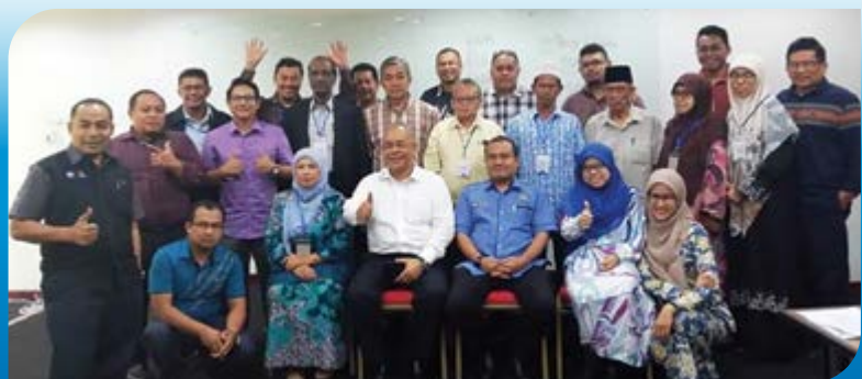
Sesi fotografi peserta bersama penceramah.