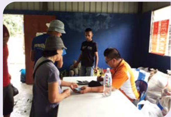
Koperasi membayar secara tunai hasil jualan tanaman penduduk kampung.