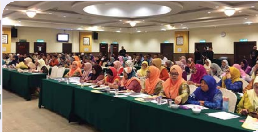
Sambutan yang menggalakkan daripada koperator dan usahawan dari Zon Utara.