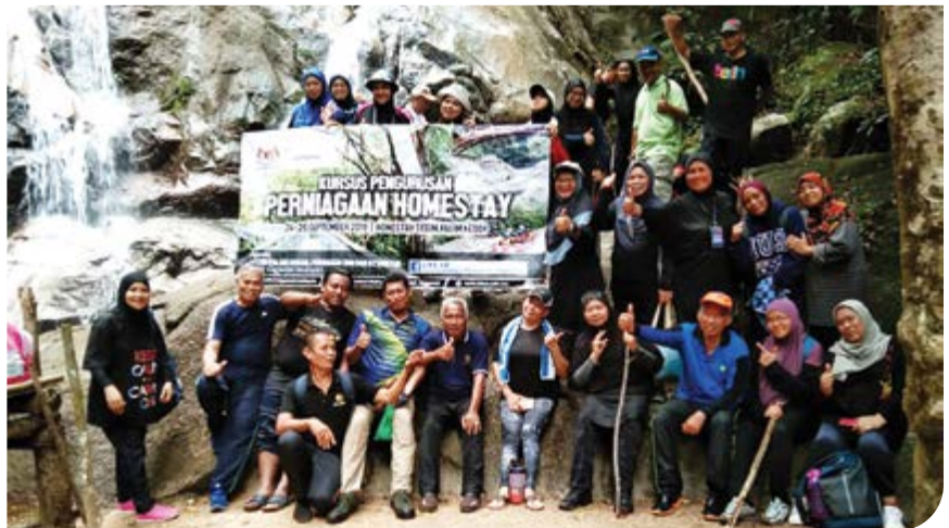
Peserta bergambar di kawasan Air Terjun Hutan Lipur Sedim.

Pada 24 hingga 26 September 2019 yang lalu, telah berlangsung kursus "Pengurusan Perniagaan Homestay" anjuran Sektor Pelancongan, Penjagaan Diri dan Kesihatan, Institut Koperasi Malaysia (IKM) di Koperasi Homestay Pembangunan Mukim Sedim, Sedim Kulim Berhad, Kedah. Program ini dihadiri oleh 44 orang peserta daripada seluruh semenanjung Malaysia. Program ini dikendalikan oleh Sektor Pelancongan, Penjagaan Diri dan Kesihatan (SPPDK), IKM bersama Angkatan Koperasi Kebangsaan Malaysia Berhad (ANGKASA).