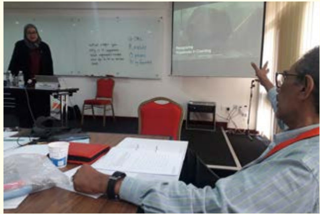
Sesi penerangan coaching kepada peserta IKM.