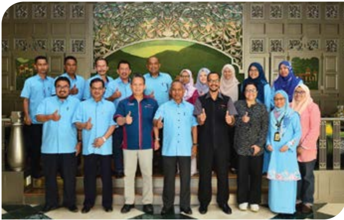
Bersama barisan ALK Koperasi Kakitangan Istana Terengganu Bhd.