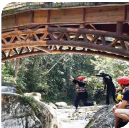
Setiap peserta diwajibkan untuk melakukan water confident (terjun ke dalam jeram) sebelum aktiviti water rafting dan water tubing .

Objektif kursus ini adalah untuk meningkatkan pengetahuan dan kemahiran peserta dalam menguruskan perniagaan homestay. Kursus Pengurusan Perniagaan Homestay merupakan kursus lanjutan di mana peserta akan merasai pengalaman tinggal di homestay bersama keluarga angkat dan menyertai aktiviti homestay yang ditawarkan. Program homestay merupakan aktiviti perniagaan di dalam industri pelancongan di Malaysia.