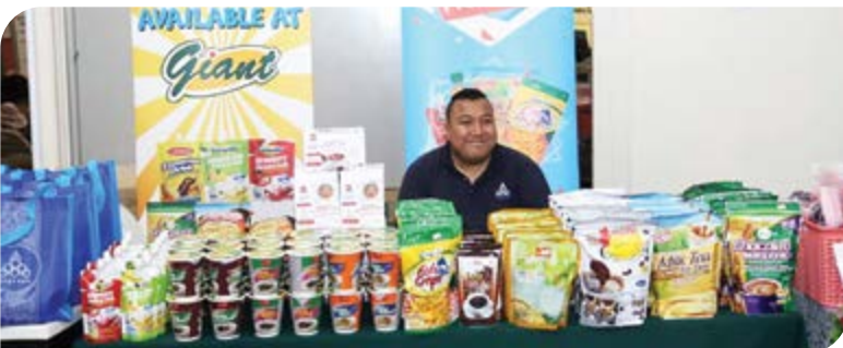
ANGKASA juga tidak melepaskan peluang untuk bersama-sama menyertai program ini dengan membuka gerai jualan produk koperasi.

Secara keseluruhannya, Seminar “Tingkatkan Pendapatan Perniagaan dengan Pensijilan Halal” ini telah mendapat maklum balas yang baik daripada para peserta dan telah mencapai objektifnya. Program ini telah berjaya memberikan pendedahan berkenaan isu-isu pensijilan halal dan potensinya kepada para peserta secara lebih mendalam. Program ini juga telah berjaya memberikan panduan kepada peserta tentang prosedur dan permohonan sijil halal yang betul dan tepat seterusnya membolehkan para peserta menggunakan ilmu tersebut bagi diaplikasikan dalam perniagaan masing-masing.