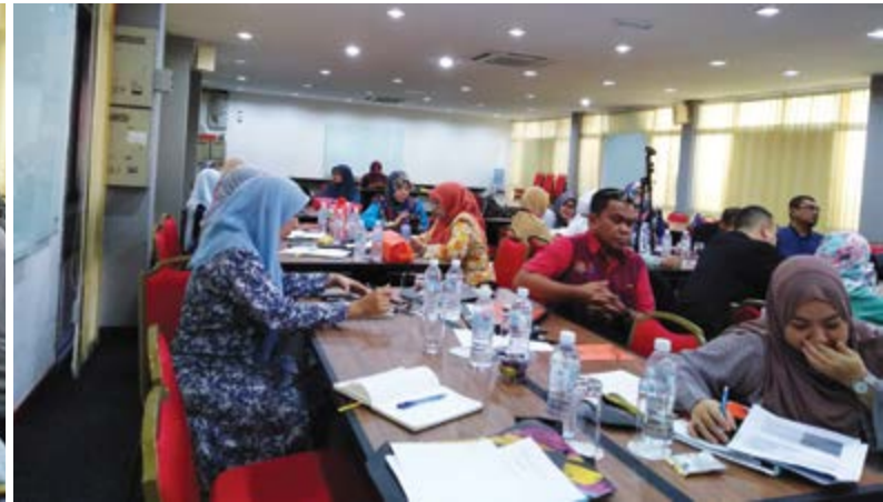
Sesi percambahan idea dan perkongsian maklumat.