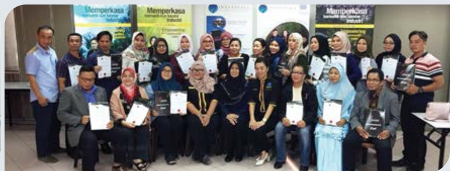
Peserta menerima sijil dari IKM & Inner Peace Spa.