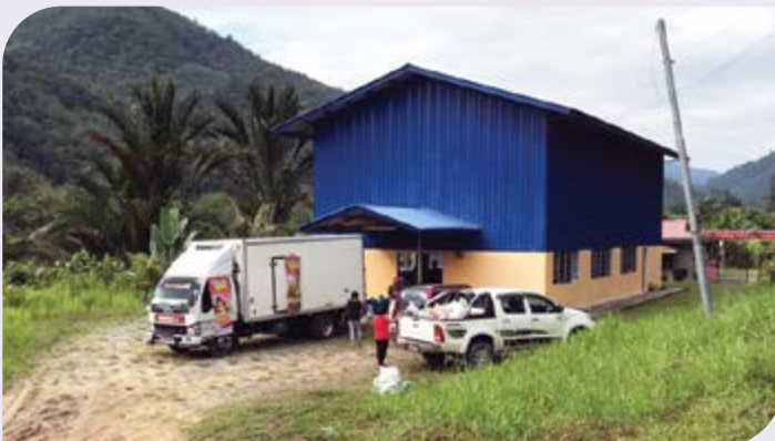
Dewan Kampung Tulung, Kiulu tempat penjualan barang keperluan runcit & pengumpulan hasil tanaman untuk penduduk kampung.