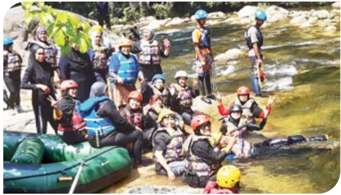
Peserta bersedia untuk aktiviti water rafting di Sungai Sedim yang merupakan jeram terbaik di Malaysia dan mempunyai arus terderas di dunia.