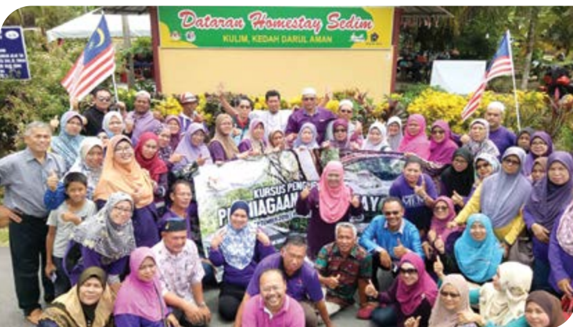
Bergambar kenangan sebelum bertolak pulang.

Secara keseluruhannya, kursus ini telah membuka minda para koperator bahawa aktiviti homestay mampu menjana pendapatan koperasi termasuk anggota-anggota koperasi. Oleh yang demikian, IKM sebagai institusi latihan dan pendidikan koperasi akan terus peka kepada program-program yang sesuai dengan persekitaran bagi membantu gerakan koperasi dengan ilmu-ilmu yang berguna untuk lebih berdaya maju, berdaya saing, kreatif dan inovatif.