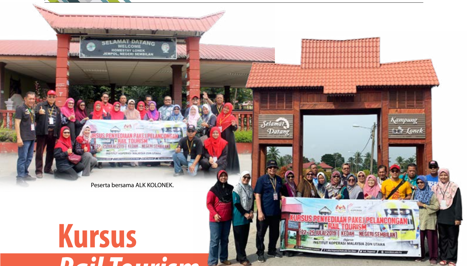
Peserta bersama ALK KOLONEK.