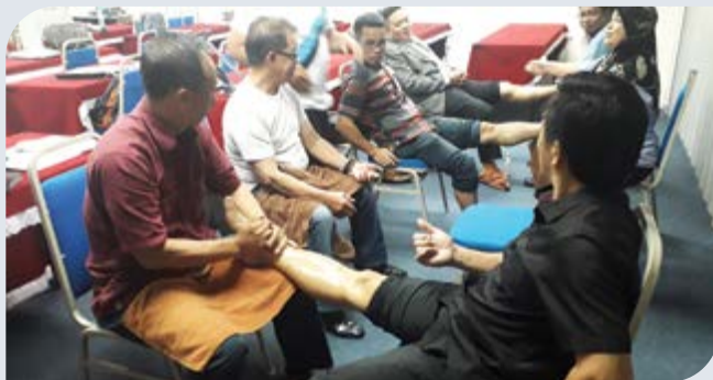
Peserta kursus ketika sesi ceramah di IKM.

Objektif kursus ini adalah untuk memberi kefahaman & pengetahuan tentang potensi perniagaan Spa dan memberi pendedahan berkaitan persediaan koperasi untuk membuka perniagaan Spa. Kursus ini telah mendapat kerjasama dan komitmen yang baik daripada semua peserta. Di samping itu, peserta juga dapat merasai pengalaman sebenar dalam menjalankan aktiviti perniagaan Spa sebenar ketika melawat perniagaan Spa bertaraf lima bintang iaitu Chi The SPA di Hotel Shangri La Tanjung Aru. Selain itu, antara pengisian aktiviti selain sesi ceramah para peserta dapat melakukan aktiviti praktikal dalam teknik urutan muka, kaki dan urutan Malaysia.