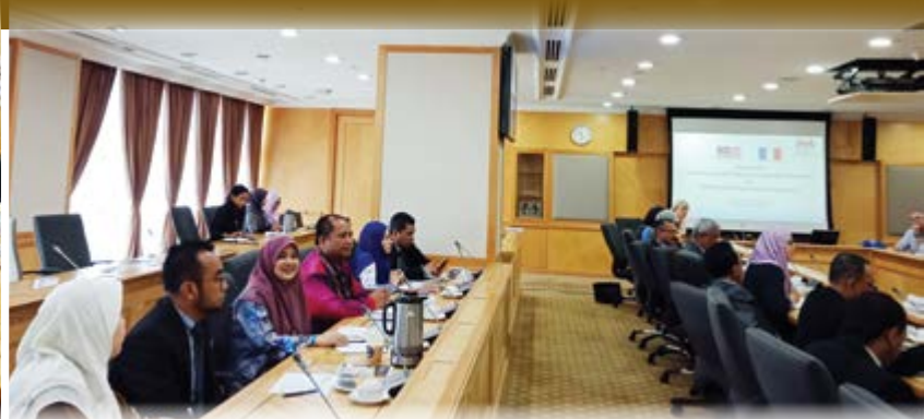
Wakil - wakil yang hadir dari IKM, SKM dan ANGKASA.

Satu lawatan kerja ke Malaysia telah diadakan pada 24 Oktober 2019 yang lalu. Seramai 29 orang delegasi dari koperasi Perancis khususnya dalam sektor perumahan telah terlibat dalam lawatan ini. Ia adalah rentetan lawatan hormat daripada TYT Frederic Laplanche, Duta Besar Perancis ke Malaysia. Beliau telah mengadakan kunjungan hormat pada 6 Ogos 2019 di Pejabat YB Menteri Pembangunan Usahawan. Lawatan kerja ini bertujuan untuk mengetahui lebih lanjut mengenai pasaran perumahan mampu milik Malaysia dan perbincangan untuk mengadakan kerjasama dalam sektor perumahan. Di samping itu, delegasi Perancis bersedia untuk berkongsi pengalaman mereka dalam sektor perumahan yang mampu dimiliki yang diamalkan di Perancis.