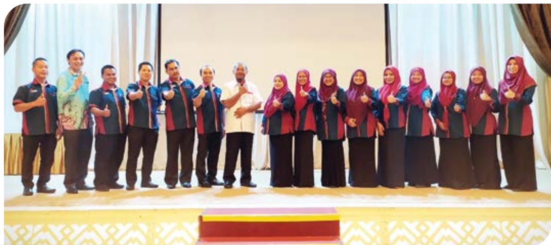
Warga Kerja IKM Zon Sabah bergambar kenangan bersama Timbalan Ketua Pengarah (Akademik).