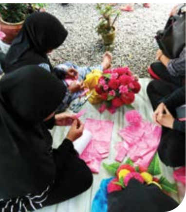
Aktiviti mempelajari seni kraftangan bunga yang dihasilkan dari beg plastik.