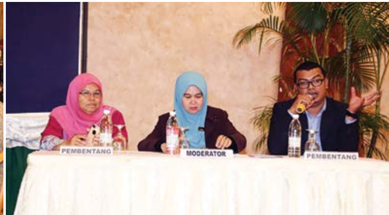
Pembentang dan moderator sesi 2.