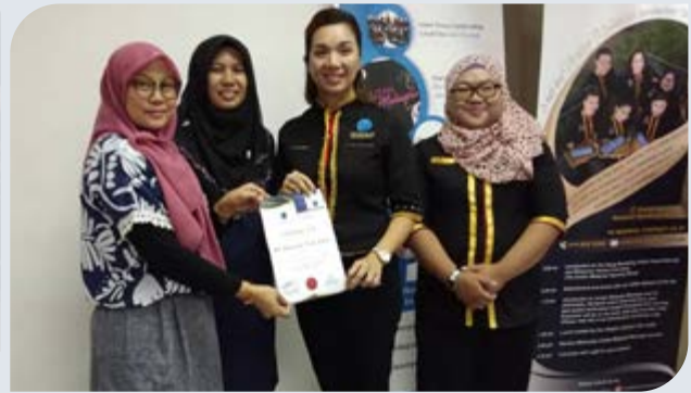
Penyampaian sijil dari Inner Peace Spa.