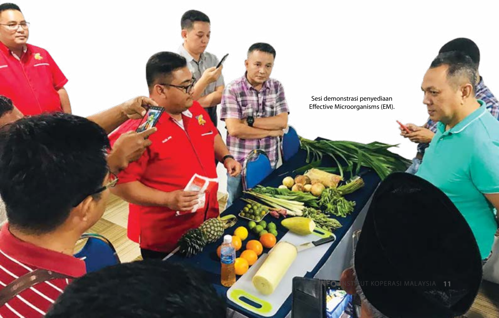
Sesi demonstrasi penyediaan Effective Microorganisms (EM).

penternakan arnab pedaging usahawan digalakkan untuk menceburi bidang penternakan arnab pedaging kerana arnab mempunyai potensi dan kelebihan dalam menjana keuntungan. Arnab merupakan haiwan yang mudah diternak, cepat membiak dan membesar serta boleh menghasilkan anak yang banyak pada setiap kelahiran. Bahkan, arnab