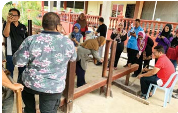
Aktiviti demo dodol dan mengemping padi.

Secara keseluruhannya, kursus ini telah mendapat reaksi yang positif daripada para peserta dan telah mencapai objektifnya. Kursus ini telah berjaya memberi pendedahan berkenaan konsep dan jenis pakej pelancongan Rail Tourism serta memberikan panduan kepada para koperator untuk mempertingkatkan koperasi dalam merebut peluang dalam sektor pelancongan demi memperkasakan gerakan koperasi di Malaysia. Kursus Rail Tourism ini pastinya akan menjadi satu pengalaman yang akan dihargai oleh setiap peserta.