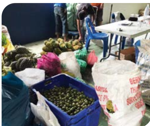
Hasil tanaman penduduk kampung setelah melalui proses penimbangan.