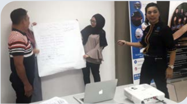
Pembentangan pelan tindakan.