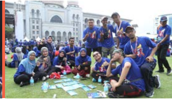
MINI KARNIVAL KEUSAHAWANAN KOPERASI 16/11/2019