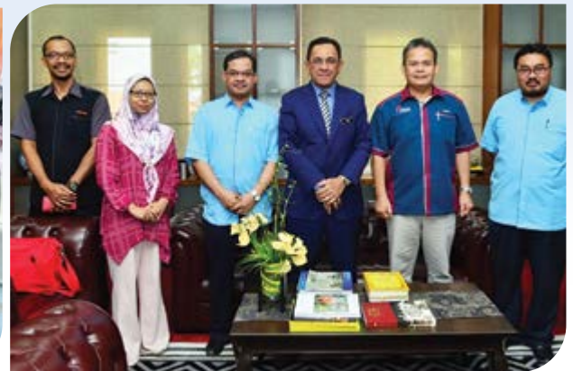
Bergambar bersama ALK KOIST.