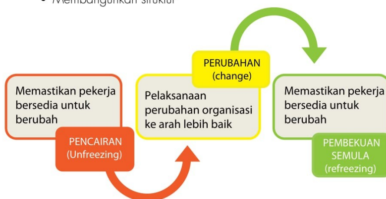
Rajah 2: Model Perubahan Kurt Lewin

Model seperti rajah 2 di atas memberi penekanan bahawa sistem organisasi yang berada dalam suasana stabil perlu mendapat sokongan padu pihak pengurusan sebelum melakukan perubahan. Pihak yang terlibat perlulah membangkitkan kehendak mereka untuk melakukan sesuatu perubahan. Dari sini perubahan