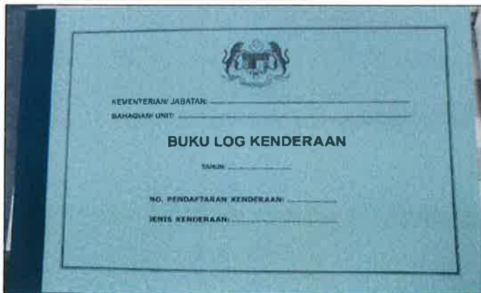
BUKU LOG KENDERAAN