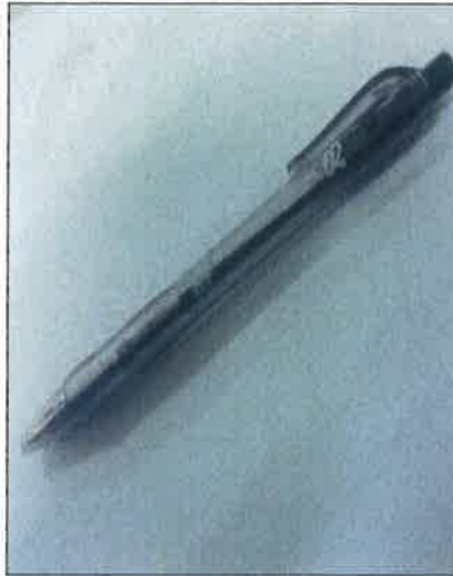
PEN TULIS (WRITING PEN)