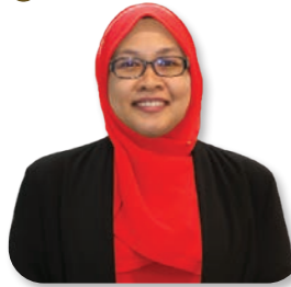
NOR ARMA ABU TALIB