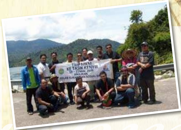
LAWATAN KE TASIK KENYIR