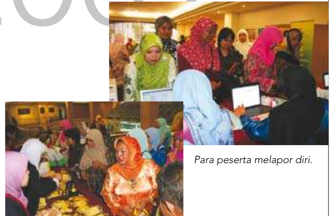
Para peserta melapor diri.

Seminar ini merupakan satu mekanisme bagi perkongsian maklumat, pengetahuan, pengalaman dan perbincangan di kalangan pegawai-pegawai agensi yang terlibat secara langsung dalam gerakan koperasi dan koperator-koperator wanita di Malaysia. Seminar ini memberi ruang kepada para peserta untuk mengetahui senario semasa koperasi wanita di Malaysia. Di samping itu para peserta turut didedahkan dengan perkembangan koperasi wanita di Indonesia sehingga mampu menggerakkan koperasi mereka sehingga berjaya hingga kini.