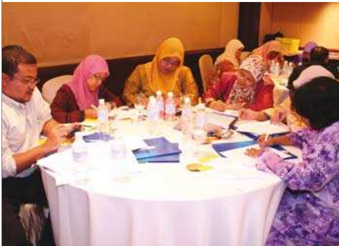
Peserta bengkel tekun menulis tips-tips penting dalam penulisan artikel jurnal. ▲

Antara aspek-aspek yang diterangkan oleh beliau adalah seperti "Getting published – An overall perspective, Academic writing - Article structure and Citing references, From research to academic paper, Preparing article/manuscript and Commencing the writing". Sesi bengkel ini juga melibatkan perbincangan dalam kumpulan dan pembentangan oleh peserta pada akhir sesi.