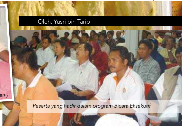
Peserta yang hadir dalam program Bicara Eksekutif

Ucapan perasmian yang dibacakan oleh Pengarah MKM cawangan Sabah <