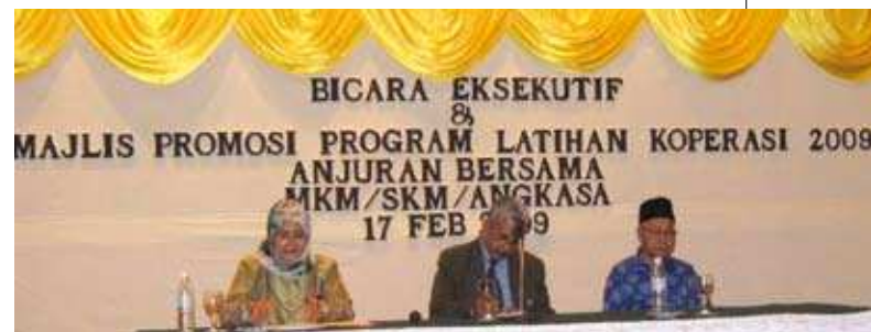
Barisan penceramah yang terlibat. ▲

Selaras dengan itu, pada tanggal 17 Februari 2009 bertempat di Hotel Impiana Casuarina, Ipoh, Perak, satu program Bicara Eksekutif telah diadakan oleh Maktab Kerjasama Malaysia (MKM) bertemakan "Ke Arah Pengurusan Koperasi Dinamik". Program ini telah diadakan bersama-sama program Taklimat Latihan Koperasi 2009 dengan kerjasama Suruhanjaya Koperasi Malaysia (SKM) dan Angkasa.