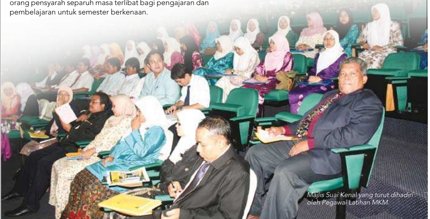
Majlis Suai Kenal yang turut dihadiri oleh Pegawai Latihan MKM.