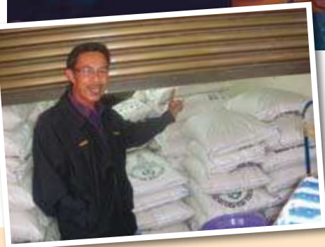
Stor penyimpanan gula di kedai koperasi ◀

Objektif pasar mini ini ditubuhkan adalah untuk memberi perkhidmatan menjual dan membekal barangan runcit dan barangan keperluan dengan harga yang berpatutan kepada anggota/bukan anggota, pihak syarikat, kontraktor dan orang ramai. Keduanya bagi memenuhi tanggungjawab sosial dengan menyediakan peluang pekerjaan kepada anak-anak anggota koperasi serta menambah keuntungan kepada koperasi dengan peningkatan bayaran dividen kepada anggota-anggota. Akhir sekali adalah untuk menjimatkan masa, kos pengangkutan, kos barangan dan kos sara hidup anggota.