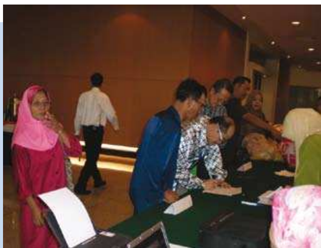
Para peserta melapor diri. ▲

Objektif utama program ini dianjurkan adalah untuk memberi pendedahan tentang peluang dan potensi perniagaan yang boleh diceburi oleh gerakan koperasi dalam Koridor Tenaga Diperbaharui Sarawak (SCORE) selain memberi pendedahan kepada para koperator berkenaan peluang-peluang yang ditawarkan oleh SKM dan mewujudkan jalinan kerjasama antara para koperator dengan usahawan, syarikat dan agensi yang berkaitan di dalam Projek SCORE.