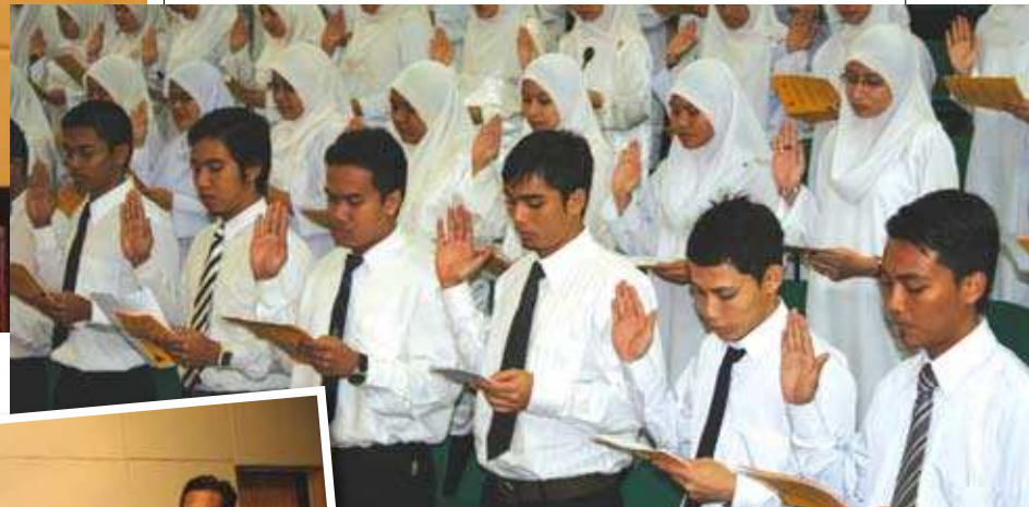
Bacaan ikrar oleh sebahagian pelajar baharu MKM ▲