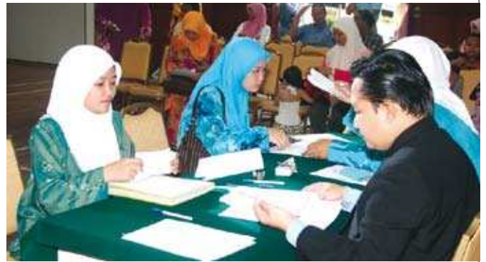
Pelajar perempuan turut melapor diri pada sesi pendaftaran. ▲