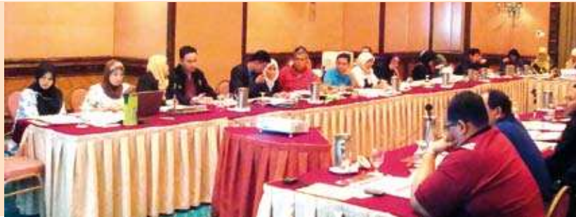
Sebahagian peserta bengkel Bengkel Kajian Semula Pencapaian KPI 2008 dan Perancangan 2009 <

Maktab Kerjasama Malaysia (MKM) telah menetapkan Pelan Strategiknya dalam tempoh 5 tahun iaitu bermula 2007 hingga 2011. Pelan ini akan dikaji semula setiap tahun bagi mendapatkan indeks pencapaian setiap strategi yang telah ditetapkan dalam Scorecard MKM iaitu dari aspek Stakeholder , Customer , Internal Process dan Learning & Growth .