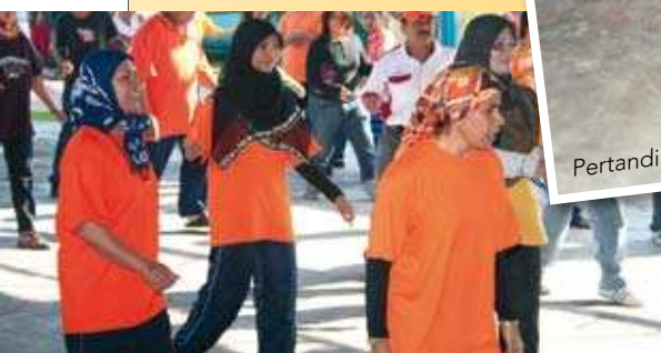
Tarian poco-poco <