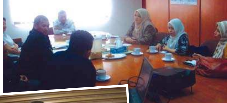
Taklimat daripada ALK Koperasi Gula Perlis Berhad ▲

Koperasi ini juga mempunyai sebuah pasar mini yang dipanggil "Kedai Koperasi Gula". Kami telah dibawa ke kedai koperasi untuk melihat keadaan sebenar perniagaan runcit yang dijalankan oleh koperasi ini. Kedai Koperasi Gula terletak di Chuping, Perlis dan telah dibuka pada 09 Oktober 2003 dengan modal permulaan berjumlah RM 70 000.