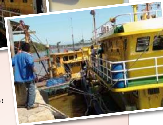
Bahagian hadapan bot menangkap ikan. ➤

"Mereka hanya perlu menjadi anggota koperasi dan sama-sama terlibat dalam usaha kami menambah tangkapan ikan yang boleh menjana pendapatan anggota koperasi," katanya kepada rombongan pengurusan Maktab Kerjasama Malaysia (MKM) yang melawat koperasi tersebut pada 22 Januari 2009 yang lalu.