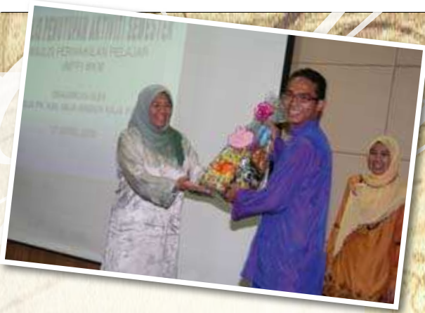
MAJLIS PENUTUP SEMESTER