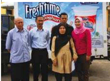
Lawatan ke KPSBU di Lembang ▲

Kami juga berasa gembira kerana berpeluang untuk berbincang dan bertukar pengalaman dengan Institut Pengurusan Koperasi Indonesia (IKOPIN) yang turut menjalankan program-program diploma dan ijazah dalam bidang koperasi. Hasil daripada mesyuarat dan lawatan tersebut akan direalisasikan dengan program-program yang akan dijalankan oleh MKM dan LAPENKOP pada tahun 2009 ini.