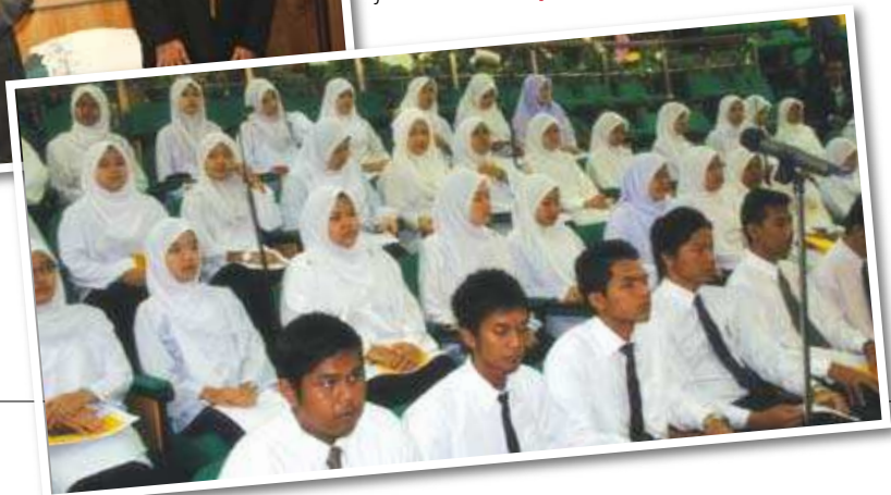
Sebahagian daripada pelajar baharu Ijazah di MKM ▼