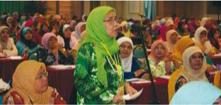
Peserta bertanyakan soalan kepada penceramah. ^

Lantaran itu, seminar ini amat berfaedah kepada koperator-koperator wanita khususnya dan gerakan koperasi di Malaysia amnya kerana dapat memantapkan lagi pengetahuan dan amalan yang terbaik bagi memajukan koperasi wanita di negara ini.