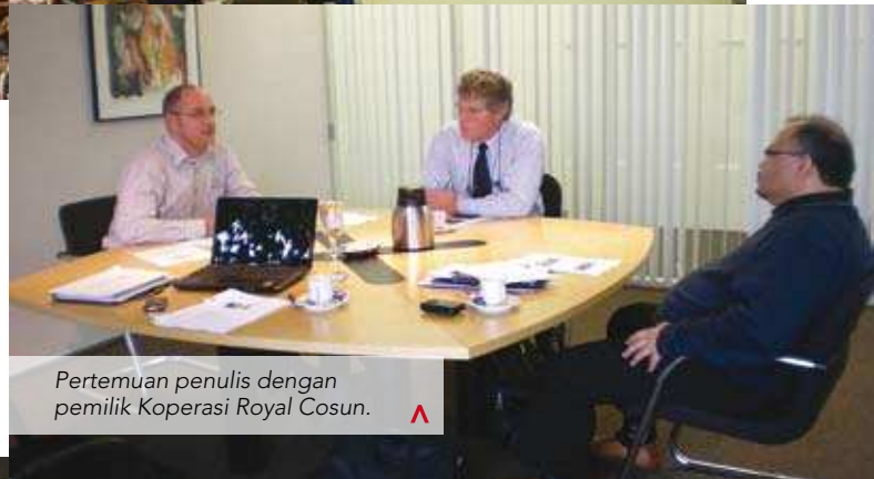
Pertemuan penulis dengan pemilik Koperasi Royal Cosun. A