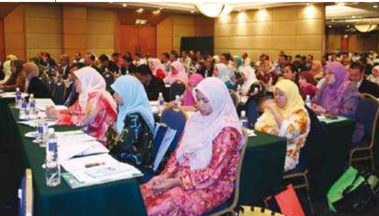
Sebahagian peserta Kolokium yang memenuhi dewan. ▲