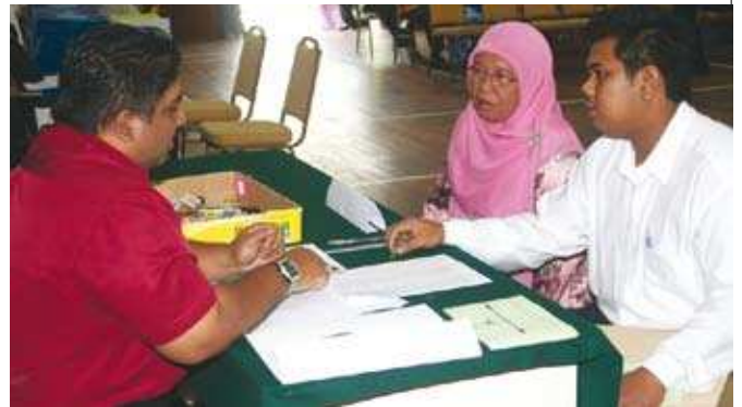
Pelajar lelaki melapor diri pada sesi pendaftaran. ▲

Kuliah bagi semester pertama bermula pada 30 Disember 2008 sehingga 17 April 2009. Seramai 8 orang pensyarah yang terdiri daripada 4 orang Pegawai Latihan MKM dan 4 orang pensyarah separuh masa terlibat bagi pengajaran dan pembelajaran untuk semester berkenaan.