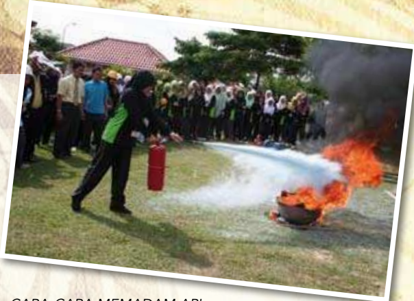
CARA-CARA MEMADAM API KEBAKARAN