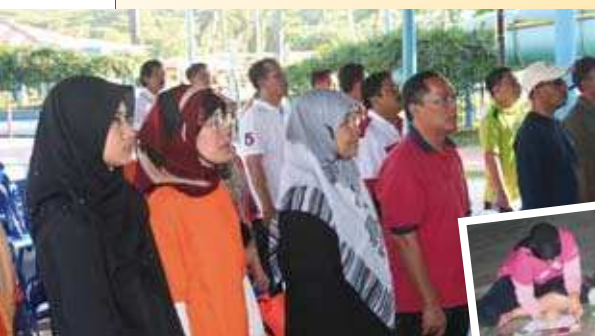
Nyanyian lagu negaraku <