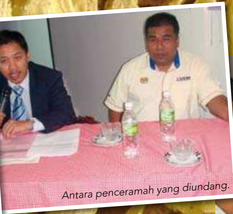
Antara penceramah yang diundang.

Ucapan perasmian yang dibacakan oleh Pengarah MKM cawangan Sabah <