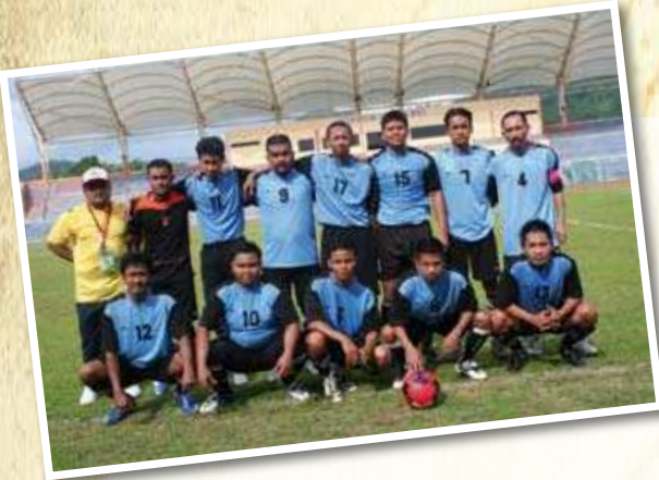
PASUKAN BOLA SEPAK MKM