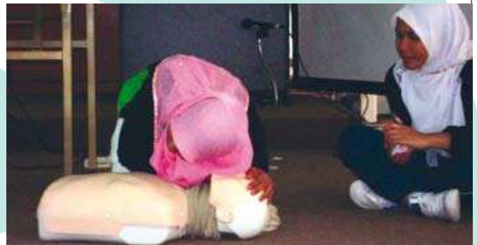
Pelajar juga turut diajar mengenai kaedah mengesan pernafasan "mangsa" menerusi teknik CPR. ▲