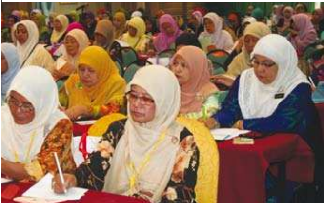
Para koperator-koperator. ^

MKM mengharapkan agar dengan adanya seminar seperti ini dapat membantu para koperator wanita khususnya dalam meningkatkan lagi ilmu pengetahuan dan semangat untuk terus berdaya saing dalam dunia perniagaan yang kompetitif. MKM akan sentiasa berusaha untuk terus membantu koperator-koperator di negara ini dalam meningkatkan kemampuan mereka di dalam ilmu perniagaan agar koperator-koperator ini dapat terus bersaing di pasaran