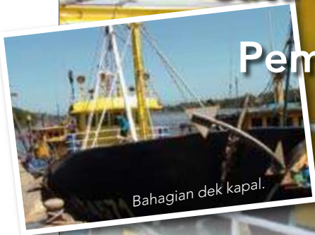
Bahagian dek kapal.

D i kalangan nelayan tradisional ramai yang tidak memiliki bot moden berkuasa tinggi yang boleh membawa mereka ketengah lautan untuk menangkap ikan. Mereka akan memulakan rutin harian belayar ke laut menaiki bot kayu yang selalunya sudah goyah dan usang dimakan hari, dan hanya pulang tatkala senja dengan hasil tangkapan mereka.