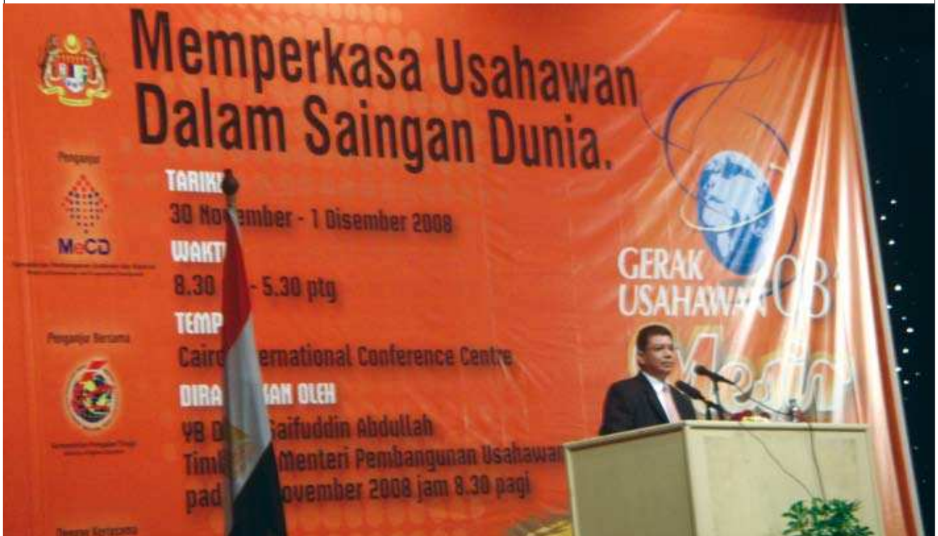
Mantan Timbalan Menteri Pembangunan Usahawan dan Koperasi, Y.B. Datuk Saifuddin Abdullah memberikan ucapan kepada hadirin. ▲

Berikutan sambutan yang baik terhadap pelaksanaan Program Gerak Usahawan di Mesir serta maklumbalas yang diterima daripada pihak pelajar bagi kesinambungan program pembudayaan keusahawanan ini, beberapa cadangan telah diusulkan seperti berikut: