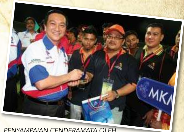
PENYAMPAIAN CENDERAMATA OLEH TIMBALAN MENTERI BELIA & SUKAN, WEE JECK SENG KEPADA SETIAUSAHA KSS MKM.