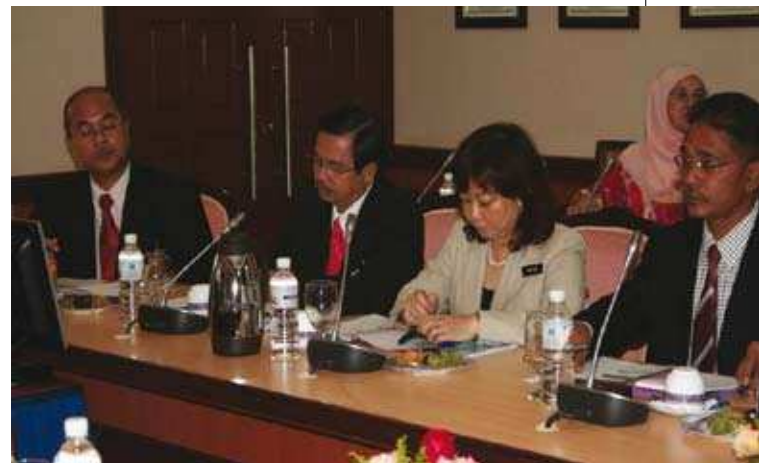
Rombongan Kementerian Perdagangan Dalam Negeri, Koperasi dan Kepenggunaan (KPDNKK) ▲

Setelah berakhirnya sesi taklimat khas, Y.B. Menteri kemudiannya turut dibawa melawat sekitar kawasan di MKM yang menempatkan kemudahan-kemudahan seperti perpustakaan, bilik kuliah dan pasar mini.