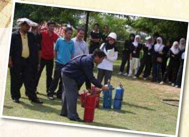
KURSUS PERTOLONGAN CEMAS