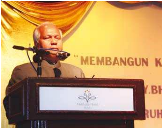
Timbalan Pengerusi Majlis MKM, Y. Bhg. Dato' Mangsor bin Saad merasmikan majlis. ▲

Seminar telah dirasmikan oleh Yg. Bhg. Dato' Mangsor bin Saad, Pengerusi Eksekutif, Suruhanjaya Koperasi Malaysia (SKM).