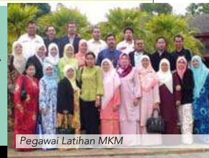
Pegawai Latihan MKM

Rata-rata peserta kursus di kalangan Pegawai Latihan MKM yang mengajar program Diploma MKM menyuarakan bahawa kursus ini amat baik sekali dijalankan bagi memantapkan ilmu dan kemahiran P&P mereka, di samping memudahkan proses P&P untuk program Diploma MKM. Sehubungan itu, mereka mencadangkan agar Kursus P&P tahap II dan tahap III dijalankan dalam masa yang terdekat supaya kesinambungan Kursus P&P Tahap I dapat berjalan dengan lancar dan berterusan.