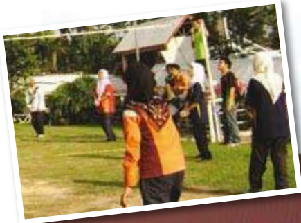
Pasukan Bola Tampar

Meskipun permainan ini memerlukan ketahanan fizikal yang kental, namun pelajar wanita tetap memperlihatkan semangat juang yang tidak mudah berputus asa yang menjadikan perlawanan ini sangat menarik. Pertandingan ini dijuarai oleh Kumpulan EAGLE bagi pasukan lelaki yang sekaligus dilihat sebagai juara keseluruhan perlawanan ini kerana turut memenangi perlawanan bola jaring dan juga futsal. Manakala pasukan wanita dijuarai oleh kumpulan DELTA .