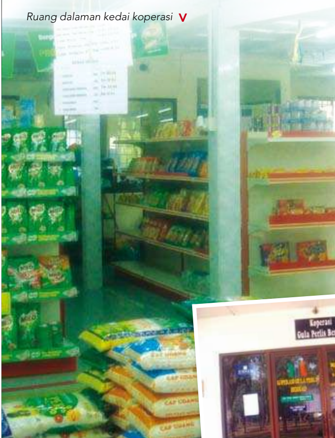
Ruang dalaman kedai koperasi ▼

Hasil daripada lawatan ini didapati bahawa Koperasi Gula Perlis Berhad boleh dijadikan contoh kepada koperasi-koperasi di luar sana yang berminat untuk menjalankan perniagaan peruncitan sebagai salah satu aktiviti koperasi. Semoga dari lawatan ini akan mengeratkan lagi jalinan kerjasama antara MKM dan koperasi dalam memajukan gerakan koperasi di Malaysia.