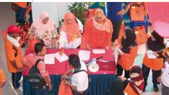
Sesi pendaftaran <

Bagi program tahun ini KSS MKM akan menganjurkan Program Hari Kakitangan yang akan berlangsung pada 19 hingga 20 Jun 2009 bertempat di Tiara Beach Resort, Port Dickson, Negeri Sembilan. Program ini dianjurkan bersama MKM untuk Majlis Anugerah Khidmat Cemerlang (AKC) dan Anugerah Kualiti.