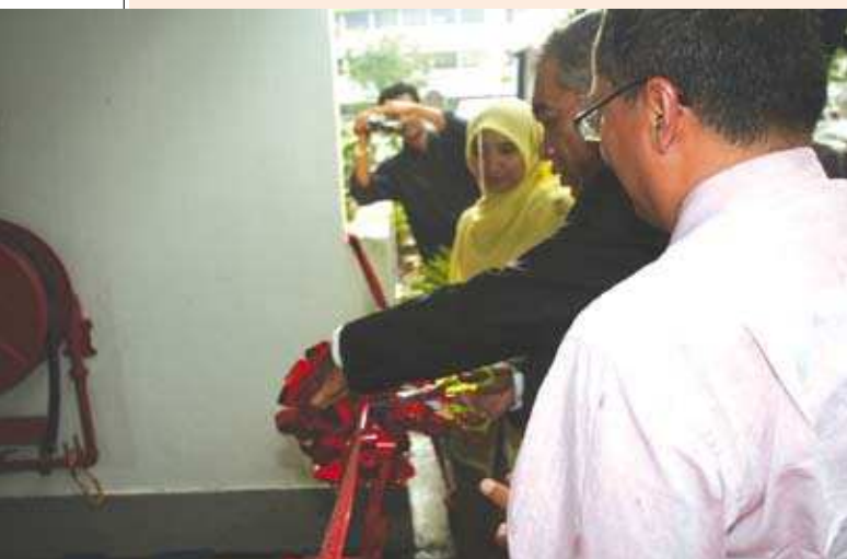
Majlis Perasmian Kolej Kediaman MKM. ▲

Majlis perasmian dimulai dengan solat Asar berjemaah dan diikuti dengan bacaan Yassin oleh kakitangan dan pelajar MKM. Majlis turut dimeriahkan dengan kehadiran beberapa tetamu jemputan termasuklah barisan Ahli Majlis MKM, Pegawai ANGKASA dan juga Pegawai yang mewakili pihak UDA Holding. Meskipun cuaca pada petang itu tidak mengizinkan, namun majlis tersebut tetap berjalan dengan lancar.