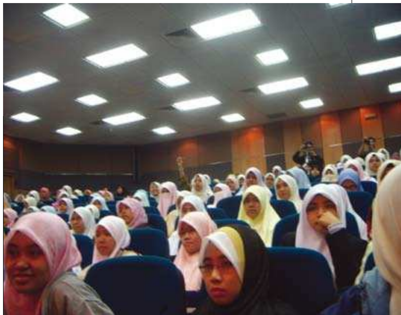
Sebahagian pelajar yang menghadiri program. ▲

Hasil daripada Program Gerak Usahawan tersebut, Koperasi Usahawan Malaysia Mesir Berhad telah berjaya ditubuhkan dengan disertai oleh 250 orang ahli yang mengadakan mesyuarat agung buat kali pertama yang dirasmikan oleh