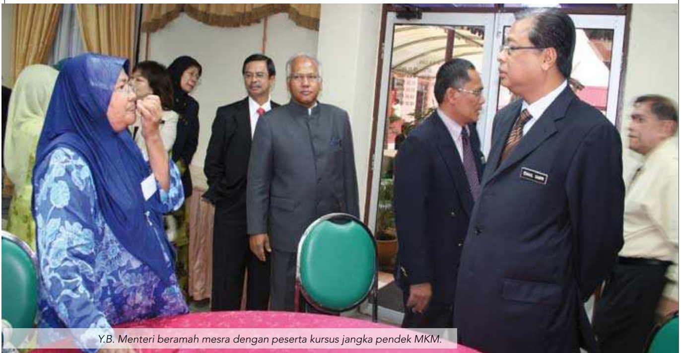
Y.B. Menteri beramah mesra dengan peserta kursus jangka pendek MKM.