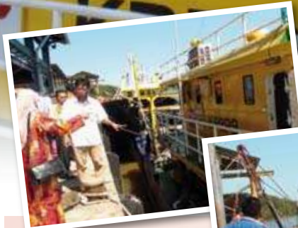
Lawatan ke bot menangkap ikan. ▲

Katanya lagi matlamat program ini ialah untuk membantu para nelayan yang meraih pendapatan di bawah RM660 sebulan untuk meningkatkan perolehan tangkapan ikan dan pendapatan mereka.