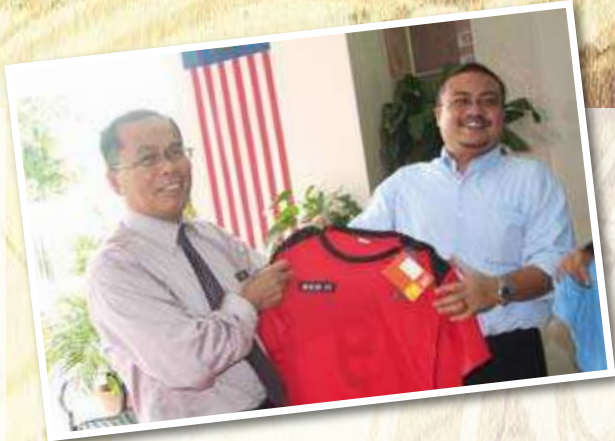
PENYERAHAN JERSI KSS