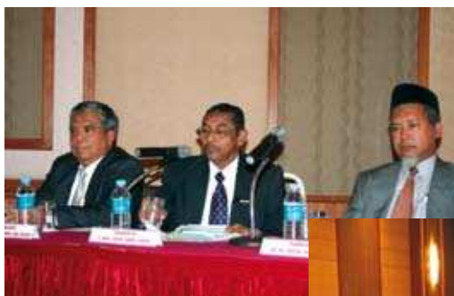
Barisan Panel Pembentang ▲