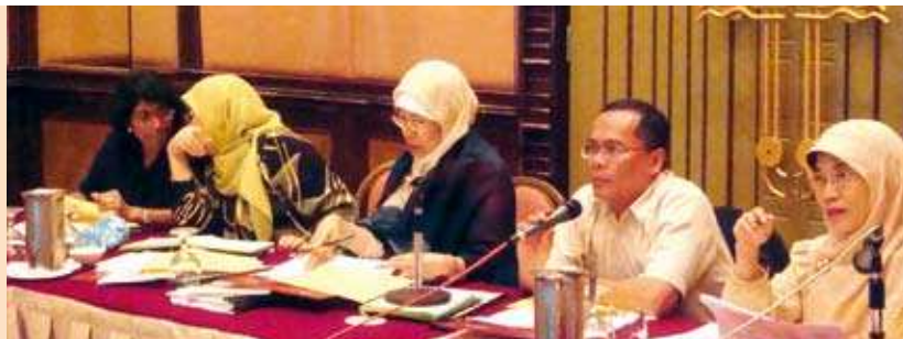
Sesi brainstorming yang dipengerusikan oleh Pengarah MKM >

Pada 22 hingga 24 Januari 2009, MKM telah melaksanakan Bengkel Kajian Semula Pencapaian Key Performance Indeks (KPI) 2008 dan Perancangan 2009 bertempat di Hotel Awana Kijal Golf, Beach & Spa Resort, Terengganu. Seramai 39 orang kakitangan telah menghadiri bengkel ini yang terdiri daripada Pengarah, Timbalan Pengarah, Pendaftar, Ketua-Ketua Pusat, Pengarah Cawangan, Ketua-Ketua Unit dan seorang lagi wakil pusat dan unit. Secara umumnya, tujuan bengkel ini diadakan adalah untuk menilai pencapaian setiap Pusat dan Unit sepanjang tahun 2008 dan menetapkan sasaran bagi tahun 2009.