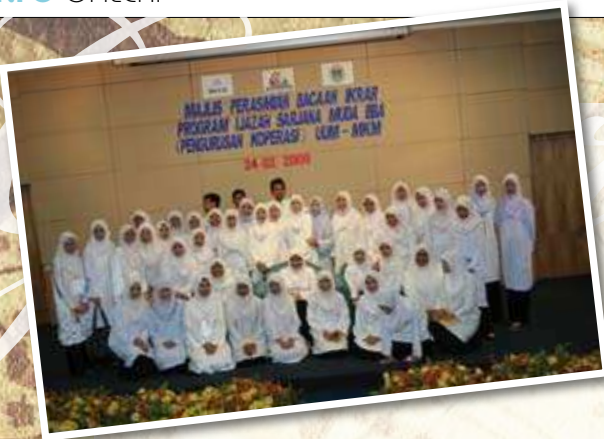
BACAAN IKRAR PELAJAR IJAZAH