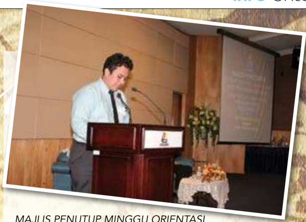
MAJLIS PENUTUP MINGGU ORIENTASI PELAJAR IJAZAH