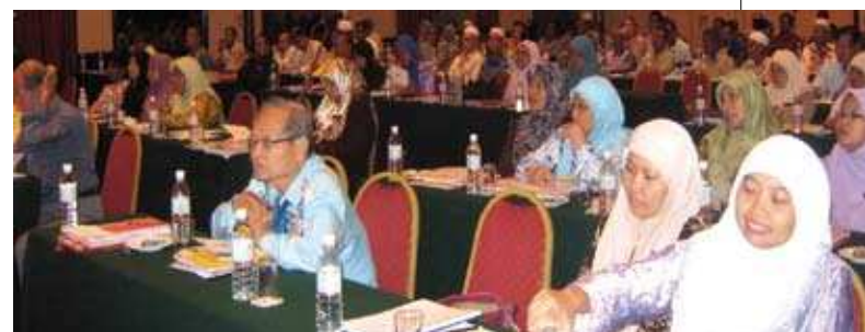
Peserta yang hadir pada majlis tersebut. ▲