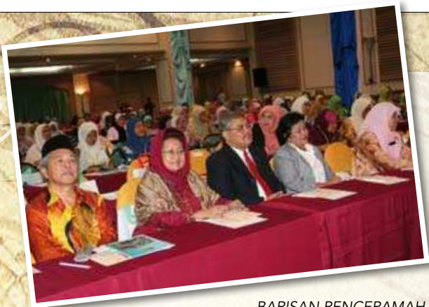
BARISAN PENCERAMAH SEMINAR WANITA