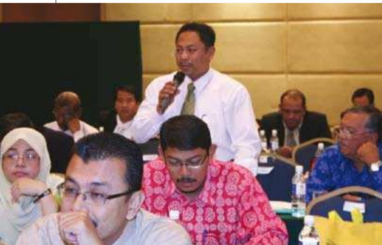
Peserta bertanyakan soalan kepada para pembentang kertas kerja. ▲

Pendekatan latihan baharu dan berkesan yang berorientasikan perkongsian maklumat, pengetahuan dan pengalaman melalui penyelidikan, kajian kes, penulisan program sangkutan dan lawatan ke koperasi-koperasi dalam dan luar negara perlu diaplikasikan di dalam kelas. Sehubungan itu, kolokium merupakan satu platform yang boleh digunakan untuk melaksanakan aktiviti berdiskusi dan perkongsian maklumat atau pengalaman di kalangan mereka yang terlibat secara langsung atau tidak langsung dalam akademik.