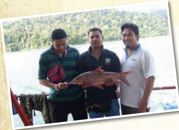
TASIK KENYIR DITAWAN