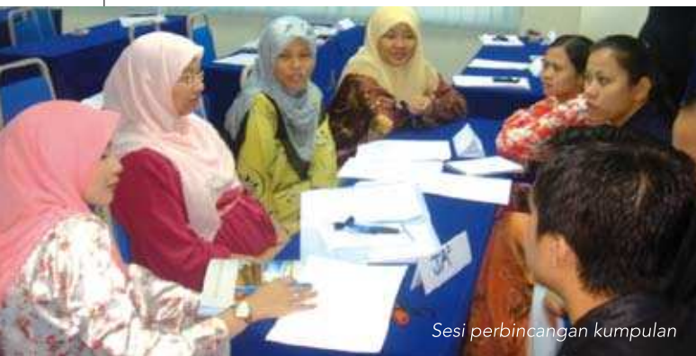
Sesi perbincangan kumpulan

Antara tajuk-tajuk ceramah yang telah disampaikan dalam kursus ini termasuklah Memahami Pemikiran Kreatif, Mengenalpasti Ciri-ciri Pemikir yang Kreatif, Memahami Cara Otak Manusia Berkerja, Berfikir di Luar Kotak Sebagai Proses Kreatif, Alat-alat Berfikir Secara Kreatif iaitu APC (Alternatives, Possibilities, Choices) dan PMI (Plus, Minus, Interesting) dan Membudayakan Kreativiti Dalam Pekerjaan.