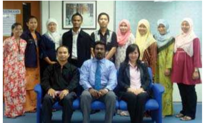
Sesi bergambar bersama fasilitator ▲

Pada 12 dan 13 November 2008, MKM Sabah telah menganjurkan kursus dalaman untuk warga kerja di cawangan. Kursus yang bertajuk Berfikir Di Luar Kotak – Kreativiti yang julung kali dianjurkan ini adalah selaras dengan hasrat MKM dan juga kerajaan untuk melahirkan modal insan yang kreatif dan inovatif dalam menjalankan tugas yang dipertanggungjawabkan. Kursus yang dijalankan