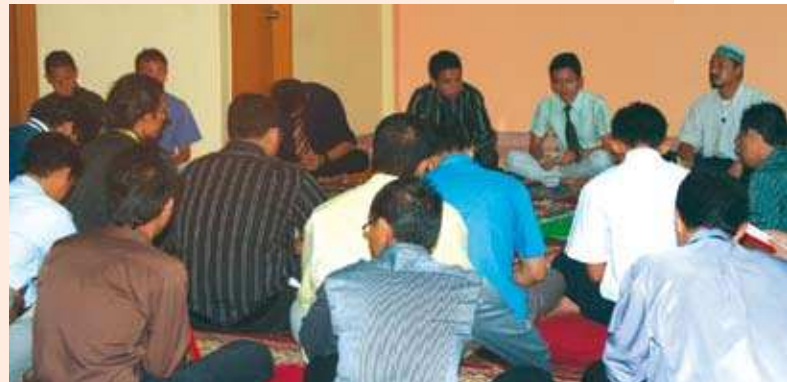
Majlis bacaan Yassin ▲

Kolej yang diberi nama "Kolej Kediaman Maktab Kerjasama Malaysia" telah dipilih sebulat suara oleh Mesyuarat Pengurusan sebelum ini. Bangunan yang berbentuk apartmen ini terdiri daripada dua blok utama. Setiap blok mempunyai enam unit apartmen yang terdapat empat buah bilik dan boleh menempatkan antara 10 hingga 12 orang pelajar.