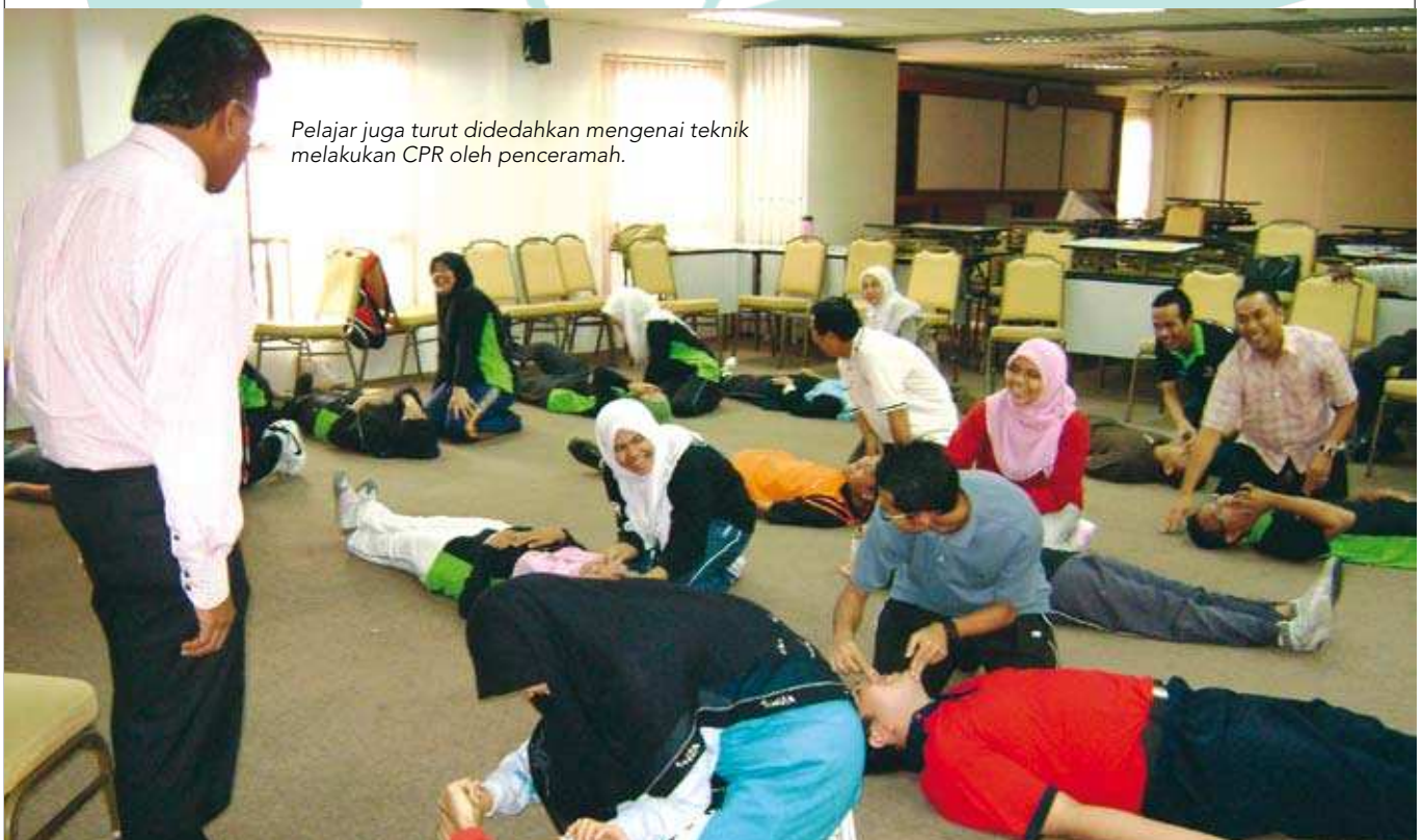
Pelajar juga turut didedahkan mengenai teknik melakukan CPR oleh penceramah.