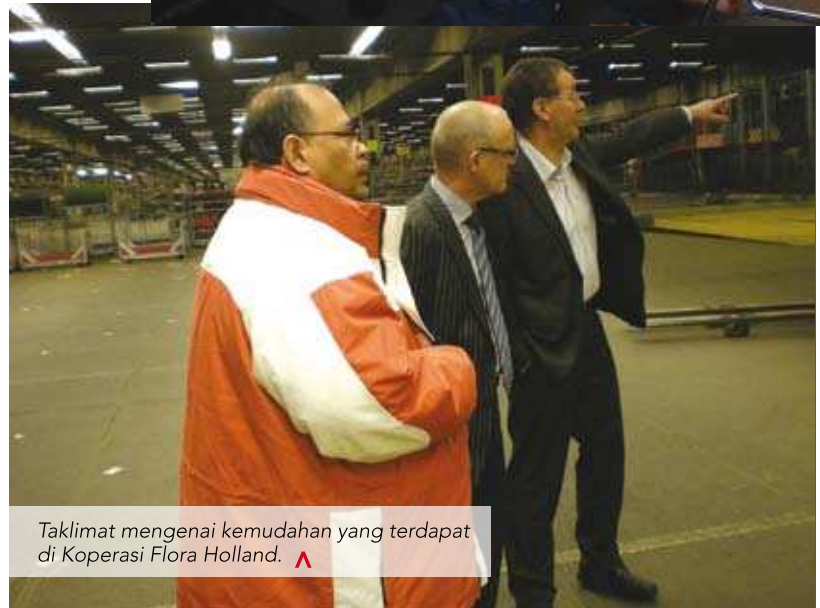
Taklimat mengenai kemudahan yang terdapat di Koperasi Flora Holland. A