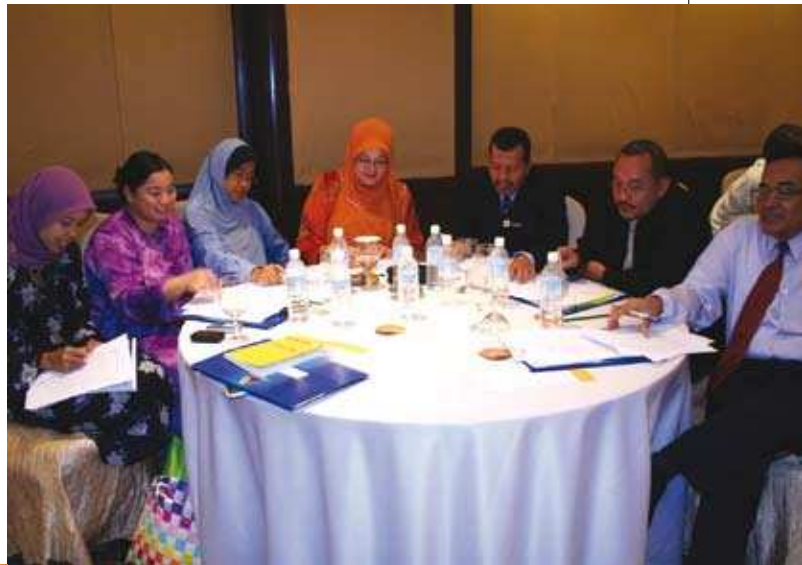
Sebahagian daripada peserta bengkel yang hadir. ▲