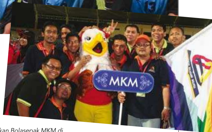
Pasukan Bolasepak MKM di Stadium Langkawi. ^

Pasukan Bola Tampar Pantai MKM bertemu dengan Pasukan dari FRIM. >