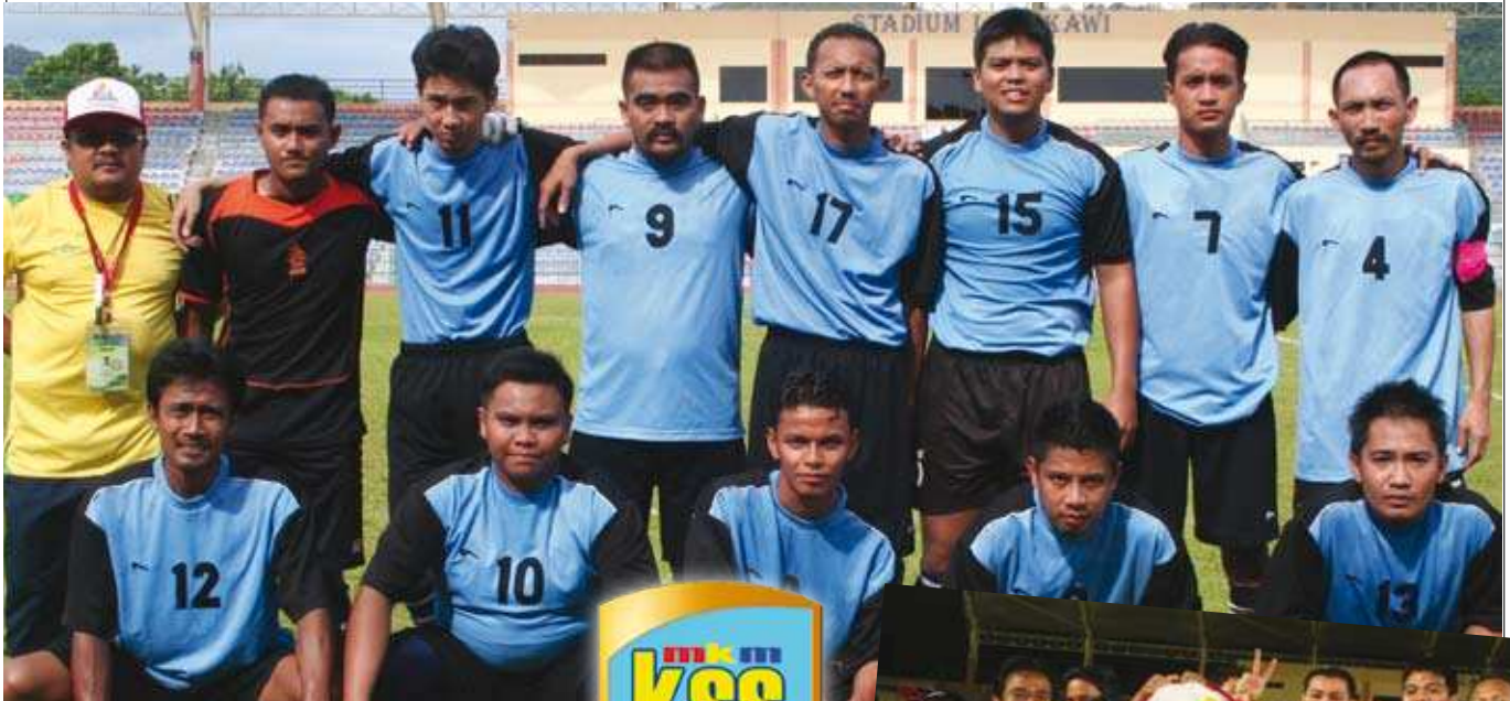
Oleh: Rasid Abd Hair (Setiausaha KSS MKM)