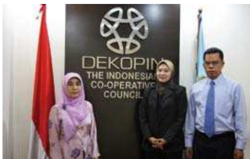
Resolusi Mesyuarat di DEKOPIN ▲