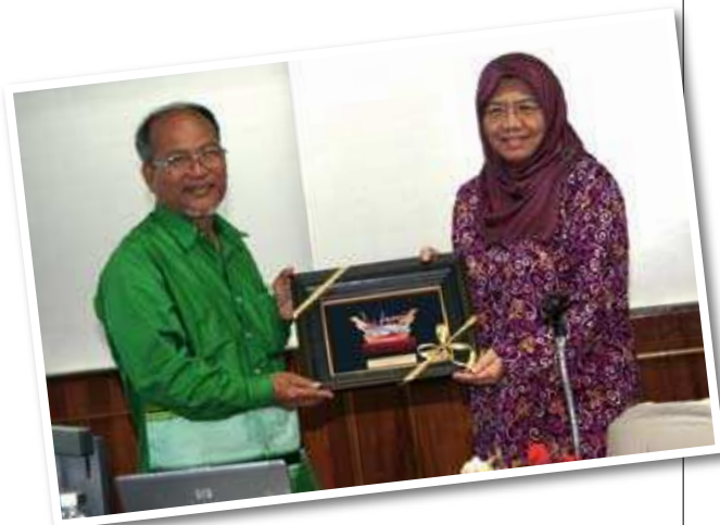
Penyampaian Cenderamata ▲