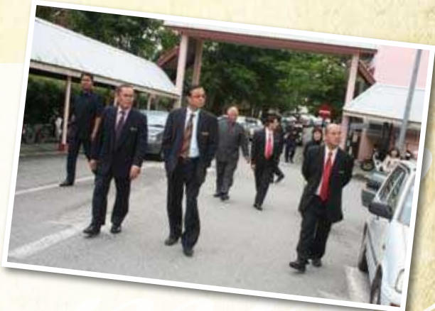
LAWATAN Y.B. MENTERI KPDNKK