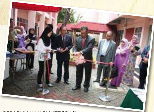
PERASMIAN HARI INTEGRASI