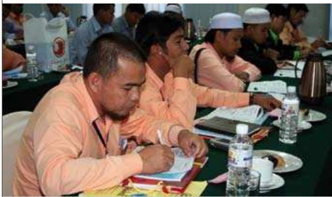
Anggota Lembaga KIIAP ▲

Ahli rombongan juga turut diberi peluang untuk mengutarakan sebarang persoalan dan cadangan. Antara cadangan yang dikemukakan ialah ingin mengadakan hubungan dua hala dengan MKM (MoU), menubuhkan seminar dengan menggabungkan semua koperasi Islam di ASEAN, mewujudkan sebuah kumpulan penyelidik gabungan antara MKM dan KIIAP serta menyuarakan minat mereka untuk menyertai kursus-kursus jangka pendek yang ditawarkan di MKM terutamanya kursus-kursus wajib yang melibatkan Ahli Lembaga Koperasi.