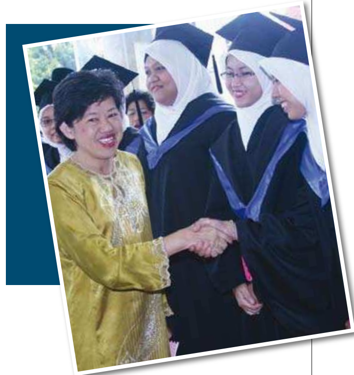
Y.B. Timbalan Menteri KPDNKK bersalaman dengan bakal graduan MKM seurus tiba di Dewan Auditorium Dato' A. Majid, MKM.

Dalam usaha melahirkan graduan yang berkualiti, cekap dan berkaliber, pengajian Diploma Pengurusan Koperasi ini mengambil masa selama 2 ½ tahun untuk memberikan input bermutu kepada para graduan. Sehingga kini, MKM telah berjaya menghasilkan 345 orang graduan Diploma Pengurusan Koperasi yang mana majoriti daripada para