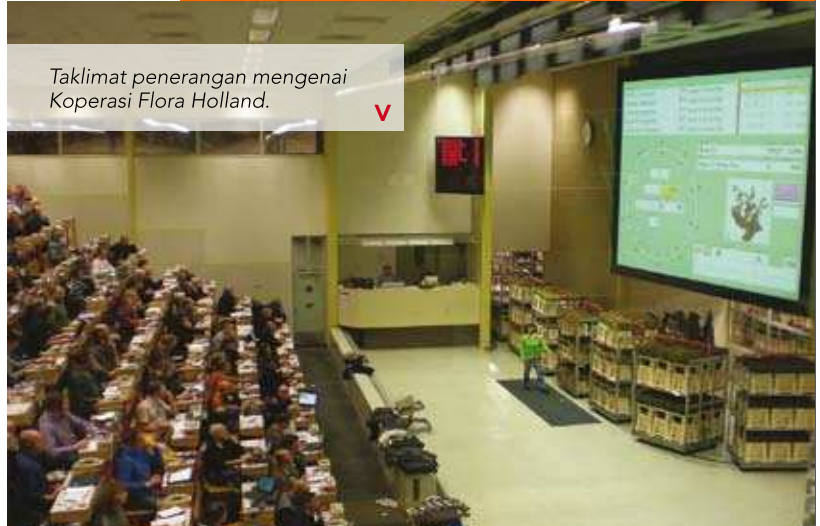
Taklimat penerangan mengenai Koperasi Flora Holland. V

Sehubungan itu, program seperti ini harus diteruskan lagi dengan menghantar beberapa prang Pegawai Latihan MKM untuk mempelajari tentang perkembangan koperasi di negara-negara yang lebih maju yang akhirnya boleh dibawa balik untuk disesuaikan dan diaplikasikan dalam gerakan koperasi di Malaysia.