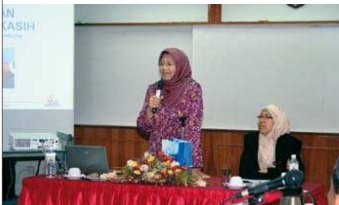
Taklimat Khas kepada Anggota Lembaga KIIAP ▲

Majlis diakhiri dengan pertukaran cenderamata daripada MKM dan KIIAP, diikuti dengan sesi bergambar. Rata-rata ahli rombongan ini amat berpuas hati dengan layanan dan sambutan yang diberikan oleh pihak MKM.