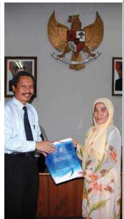
Sesi kunjungan ke IKOPIN ▲