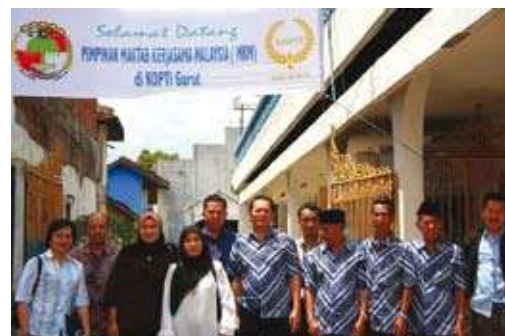
KOPTI yang menjalankan perniagaan tahu tempe <