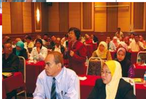
Peserta sedang bertanyakan sesuatu kepada panel penceramah. ➤