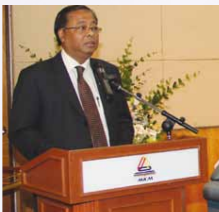
Ucapan perasmian oleh YB Dato' Sri Ismail Sabri bin Yaakob

Objektif penganjuran program ini adalah untuk mewujudkan peluang pembelajaran dengan mod pembelajaran yang lebih fleksibel berasaskan teknologi maklumat dan komunikasi. Selain itu, objektif program ini juga ialah untuk melahirkan graduan yang memiliki pengetahuan dan kemahiran dalam bidang pentadbiran perniagaan khususnya pengurusan koperasi bagi