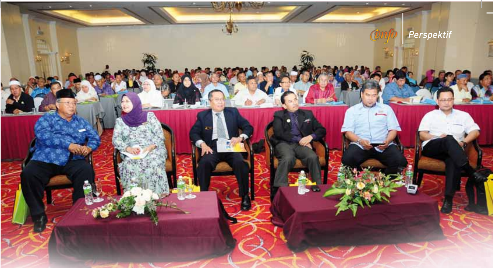
Antara peserta seminar dan VIP yang hadir