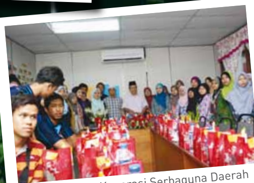
Lawatan ke Koperasi Serbaguna Daerah Jerantut, Berhad