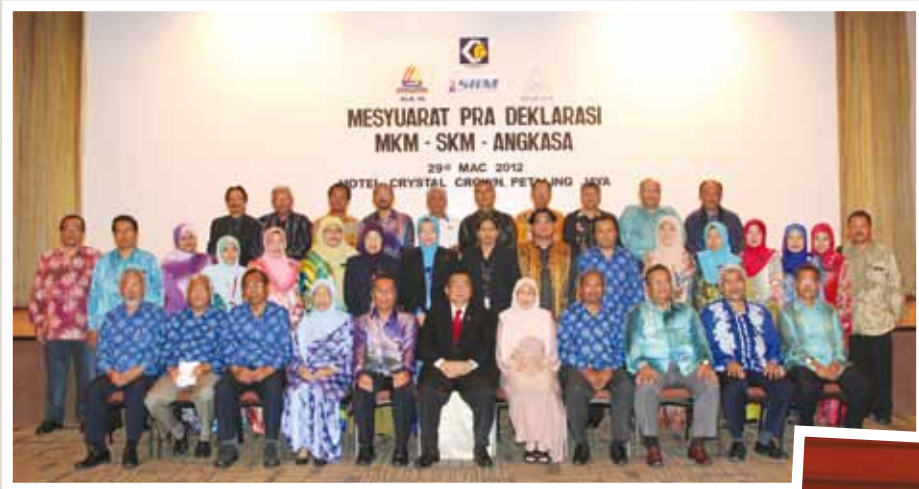
MESYUARAT PRA DEKLARASI MKM-SKM-ANGKASA 29.03.2012