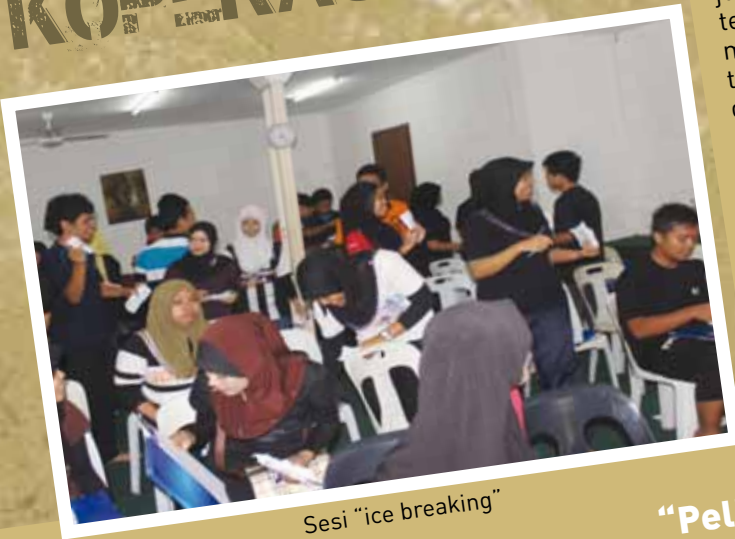
Sesi "ice breaking"

Pada 11-13 Januari 2012 bertempat di Bukit Nur Unggul, Bangi telah berlangsung Kem Motivasi yang julung-julung kali diadakan bagi pelajar DPK. Kem tersebut telah dihadiri 38 orang pelajar DPK yang akan menduduki peperiksaan re-sit. Pelbagai pengisian yang telah di atur bagi meningkatkan jati diri , keyakinan diri dan memupuk semangat kerjasama dalam kalangan pelajar seperti slot mengenal potensi diri, aktiviti 'fear factor', 'jungle trekking', SQ3R, tidur di dalam khemah dan solat berjemaah setiap kali waktu solat. Dalam kursus ini, setiap peserta diberikan barang amanah iaitu telur dan pita pengukur (setiap peserta dikehendaki menandakan mengikut umur sendiri) untuk dijaga dan dibawa sepanjang program. Pada akhir kursus ini satu majlis simbolik iaitu memotong pita pengukur yang dipakai peserta oleh fasilitator dan menyuapkan gula-gula dilakukan sebagai tanda baki usia peserta yang ada perlu digunakan sepenuhnya dengan baik dan cemerlang. -Norsyairawani