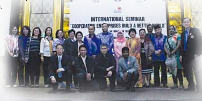
Peserta seminar dari luar negara bergambar kenangan bersama YB Dato' Sri Ismail Sabri bin Yaakob dan tetamu kehormat yang hadir

Bagi menyokong sambutan IYC ini, Malaysia telah melancarkan secara rasmi Sambutan Tahun Koperasi Antarabangsa 2012 pada 26 November 2011 di Taman Tasik Permaisuri, Cheras. Perasmian tersebut telah dilancarkan oleh Y.B. Dato' Sri Ismail Sabri bin Yaakob, Menteri Perdagangan Dalam Negeri, Koperasi Dan Kepenggunaan (KPDNKK). Untuk menyemarakkan lagi sambutan IYC 2012, Maktab Koperasi Malaysia (MKM) dengan kerjasama Angkatan Koperasi Kebangsaan Malaysia Berhad (ANGKASA) telah menganjurkan Seminar Antarabangsa "Cooperative Enterprises Build A Better World" untuk para koperator dalam dan luar negara.