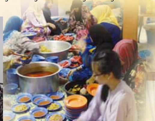
Jamuan makan malam selepas bacaan Yasin