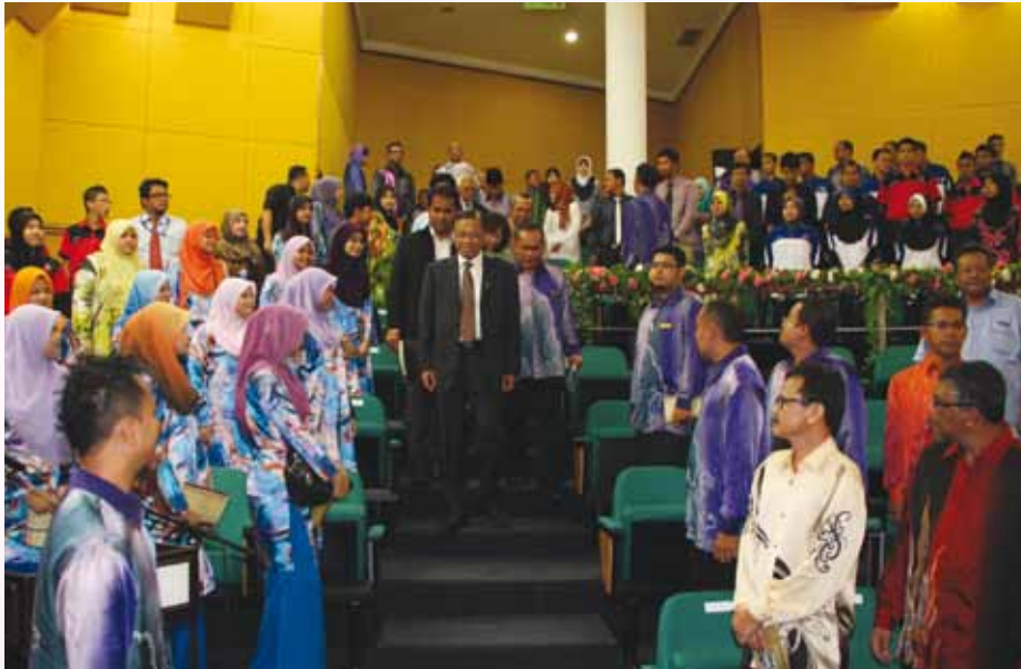
Ketibaan YB Menteri PDNKK