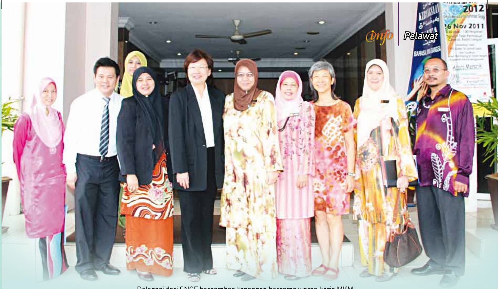
Delegasi dari SNCF bergambar kenangan bersama warga kerja MKM