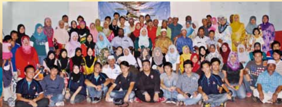
Kenangan bersama keluarga angkat dan Pegawai Jabatan Pembangunan Langkawi

Daerah Langkawi yang dikunjungi oleh peserta program bertempat di Pekan Kuah, Daerah Langkawi. Koperasi ini menjalankan kegiatan menjual motosikal, penginapan dorm dan pembinaan-pembinaan kecil, seperti pembinaan jalan raya dan kontraktor kelas F. Melalui lawatan ini, peserta program dapat menambah ilmu tentang ilmu pengkoperasian di samping dapat mengetahui sejarah pembangunan koperasi tersebut.