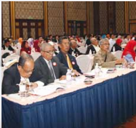
Para peserta seminar sedang tekun mendengar taklimat