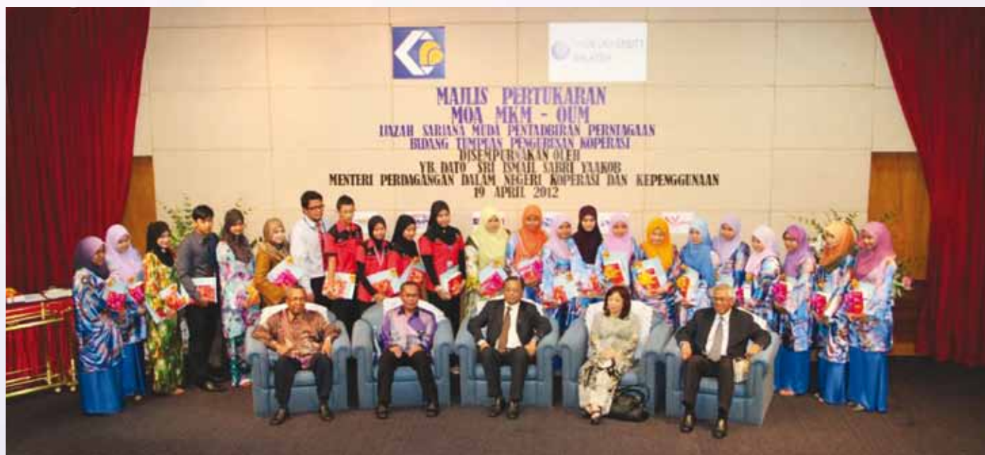
Bergambar kenangan bersama penerima Anugerah Pelajar Cemerlang DPK dan BBA