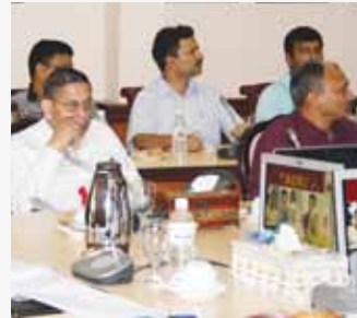
Antara peserta delegasi yang terlibat dalam lawatan ini