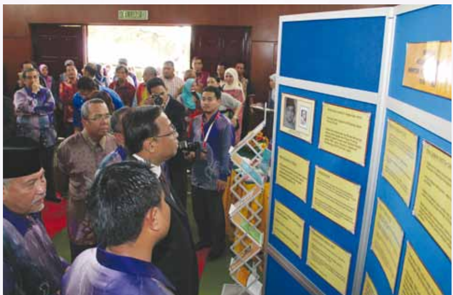
Sejarah penglibatan Allahyarham sepanjang menjadi Menteri Koperasi

MKM telah mengorak selangkah ke hadapan sebagai peneraju bidang latihan dan pendidikan koperasi dengan termeterainya Majlis Pertukaran Moa MKM-OUM. Program ini adalah usaha MKM dalam menyokong Gerakan Transformasi Kerajaan dengan mewujudkan pengajian ijazah secara dalam talian (e-pjj). Memorandum of Agreement (MoA) diadakan antara Maktab Koperasi Malaysia dan Open University Malaysia (OUM) bagi mengendalikan Program Ijazah Sarjana Muda Pentadbiran Perniagaan Dengan Kepujian Pengkhususan Pengurusan Koperasi secara e-PJJ. Ini adalah inisiatif MKM