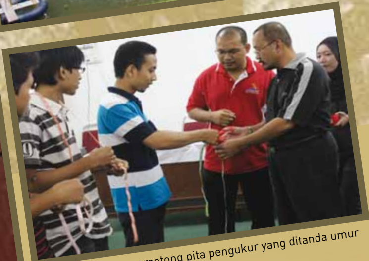
Acara simbolik memotong pita pengukur yang ditanda umur pelajar