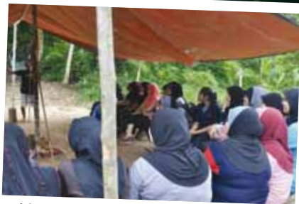
Mendengar penerangan mengenai cara hidup Orang Asli