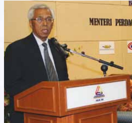
Ucapan oleh Profesor Emeritus Tan Sri Anuwar bin Ali, Presiden OUM

“Penganjuran program ini juga bertujuan untuk menambah peluang pendidikan ke peringkat Ijazah dalam bidang pentadbiran perniagaan khususnya pengurusan koperasi kepada peserta dalam dan luar negara.”