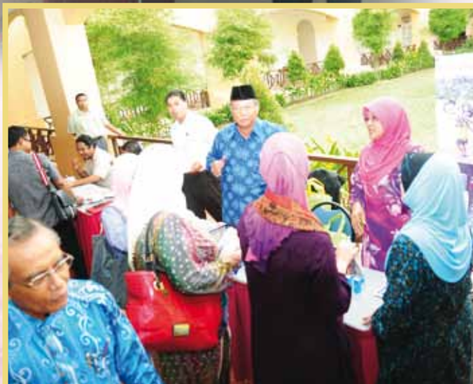
Suasana ruang pameran koperasi

Objektif utama program ini adalah untuk membuka ruang perniagaan baru kepada sektor koperasi dalam industri telekomunikasi yang boleh menjana pendapatan yang tinggi dan untuk memberi pendapatan hasil daripada penggunaan perkhidmatan telekomunikasi ahli-ahli koperasi untuk diagihkan melalui perkongsian pendapatan sesama ahli dan koperasi serta mempromosikan kursus-kursus yang akan dijalankan di MKM pada tahun 2012. Program telah dimulakan dengan sesi taklimat Program Latihan MKM 2012 yang telah disampaikan oleh Pn. Rahimah Abd. Samad selaku Pensyarah Kanan, Pusat Keusahawanan Koperasi dan Peruncitan, MKM dan bagi kertas kerja Bicara Eksekutif pula telah dibentangkan oleh En. Husnaidy Ibrahim selaku Ketua Projek Bahagian Usahawan, ANGKASA. Pembentangan daripada ANGKASA ini adalah mengenai Projek Clixter-MyCOOP iaitu satu projek perniagaan telekomunikasi yang boleh dipertimbangkan oleh koperasi untuk diceburi. Kertas kerja yang dibentangkan adalah merangkumi perkhidmatan Clixter-MyCOOP, pelan perniagaan dan pendapatan perniagaan.