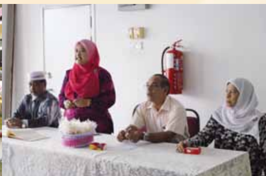
Lawatan sambil belajar ke Koperasi Pembangunan Daerah Langkawi