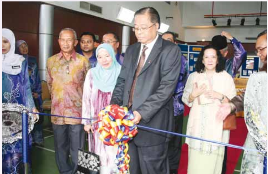
YB Menteri PDNKK menyempurnakan majlis perasmian

Bertempat di Ibu Pejabat Maktab Koperasi Malaysia Petaling Jaya, telah diadakan Majlis Pertukaran MoA MKM-OUM dan Perasmian Dewan Abdul Aziz Ishak. Majlis tersebut berlangsung pada 19 April 2012 yang telah dirasmikan oleh Menteri Perdagangan Dalam Negeri, Koperasi Dan Kepenggunaan (KPDNKK) YB Dato' Sri Ismail Sabri Yaakob. Seramai hampir 600 orang berkumpul di Ibu Pejabat MKM Petaling Jaya untuk meraikan majlis tersebut.