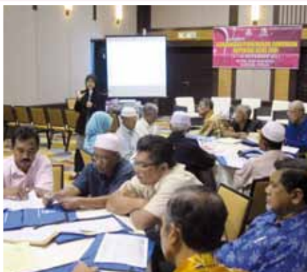
Pembentangan daripada pihak MKM