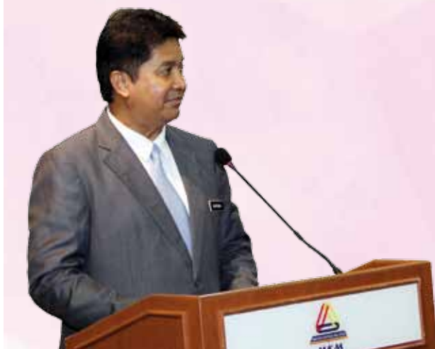
Ucapan perasmian oleh YBhg KSU KPDNKK