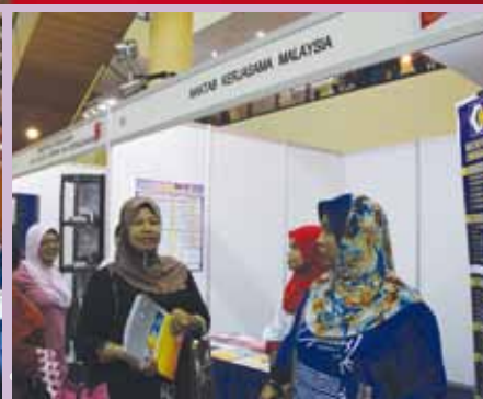
Pengunjung yang hadir

Pada 12 hingga 14 April 2012, MKMCS telah menjalinkan kerjasama dengan SKM Negeri Sembilan dengan mengadakan kursus asas anggota koperasi baru di Hotel M-Suites, Johor Bahru. Seramai 40 orang koperator koperasi baru Negeri Sembilan turut serta dengan kursus ini. Kursus ini berjalan dengan jayanya, dan dikesempatan ini juga, MKMCS telah menerima permohonan penyertaan kursus dari peserta-peserta koperasi Negeri Sembilan yang akan dilaksanakan bagi kursus-kursus berikutnya. -Afizah Abdul Jalal