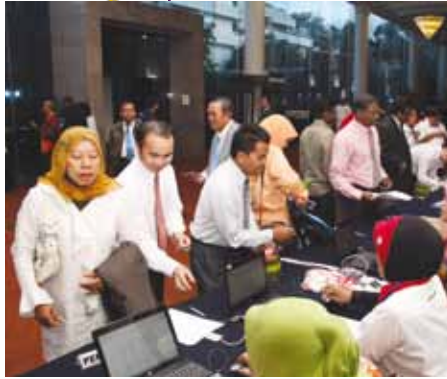
Sesi pendaftaran peserta seminar