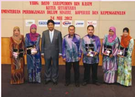
Penerima Anugerah Setia Dan Berjasa