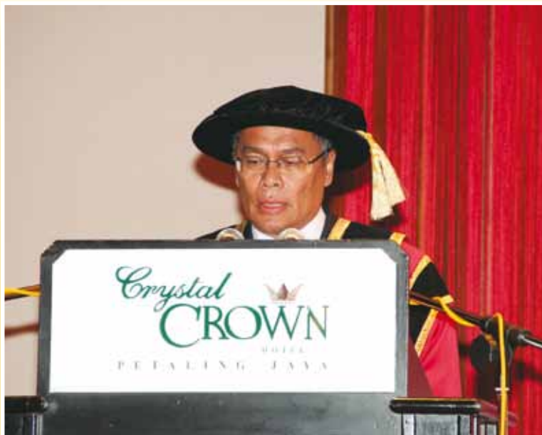
Ucapan atuan oleh YBhg. Tn. Hj. Idris bin Ismail, Ketua Pengarah MKM

Majlis Konvokesyen kali ke-16 ini bertujuan untuk meraikan para pelajar Maktab Koperasi Malaysia kerana berjaya menamatkan pengajian mereka. Pada tahun ini, seramai 108 graduan telah menerima Diploma Pengurusan Koperasi (DPK) dan 37 orang telah menerima Sijil Pengurusan Koperasi (SPK). Majlis ini telah diadakan di Hotel Crystal Crown, Petaling Jaya, Selangor.