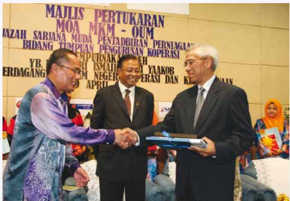
Sesi pertukaran MoA diantara MKM dan OUM sambil disaksikan oleh YB Dato' Sri Ismail Sabri bin Yaakob, Menteri PDNKK