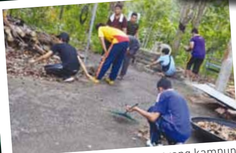
Bergotong-royong bersama orang kampung Kuala Tahan