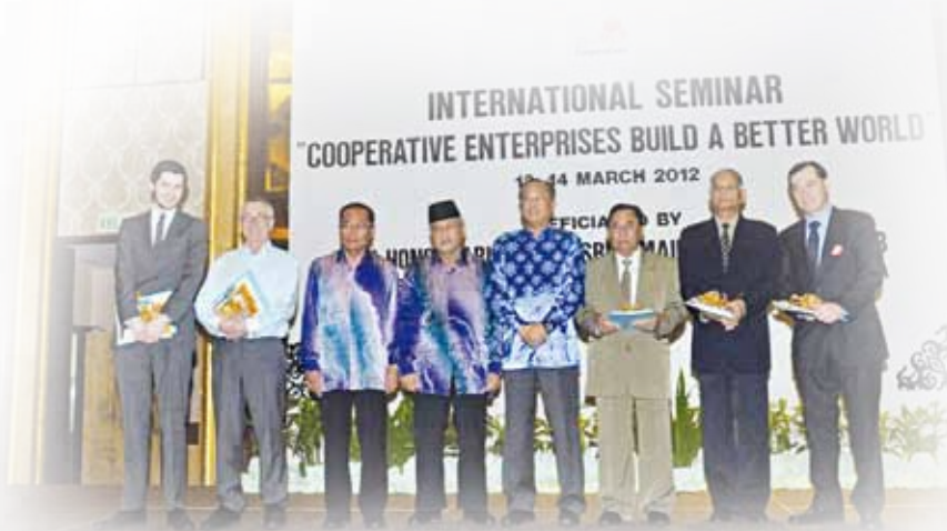
Barisan pembentang yang turut menjayakan seminar

Pertubuhan Bangsa-bangsa Bersatu (PBB) semasa Persidangan Agungnya yang ke-64 pada 18 Disember 2009 telah mengisytiharkan tahun 2012 sebagai Tahun Koperasi Antarabangsa ( International Year Cooperative - IYC ). Pengisytiharan ini jelas membuktikan bahawa badan dunia utama seperti PBB telah mengiktiraf peranan gerakan koperasi kepada masyarakat dunia secara amnya. Resolusi PBB yang bertajuk "Koperasi Pembangunan Sosial" mengakui koperasi mampu meningkatkan taraf kehidupan di samping membawa kesejahteraan kepada rakyat. Sumbangan gerakan koperasi ke arah pembangunan sosioekonomi, mengurangkan kemiskinan, mewujudkan peluang pekerjaan dan integrasi sosial sememangnya tidak dapat dinafikan. Ini juga bertujuan untuk memberi penjelasan kepada kerajaan agar mengambil langkah-langkah positif untuk mewujudkan lagi persekitaran yang menyokong pembangunan gerakan koperasi.