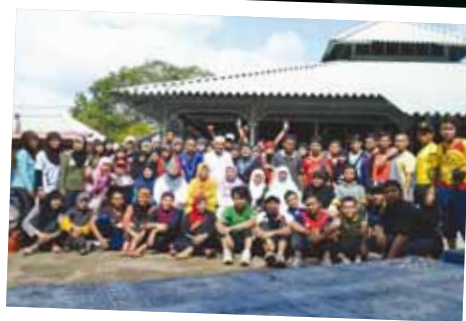
Bergambar selepas membersihkan kawasan masjid