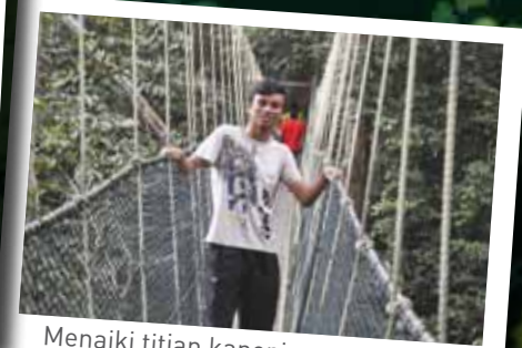
Menaiki titian kanopi sepanjang 400 meter