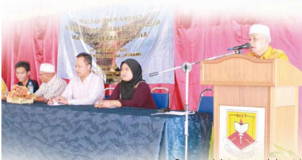
Sesi penyerahan anak angkat kepada keluarga angkat

Deruan ombak yang memukul pantai yang indah di pulau Lagenda Mahsuri, telah menarik minat pelajar DPK sem 2 Maktab Koperasi Malaysia untuk singgah melakukan program di