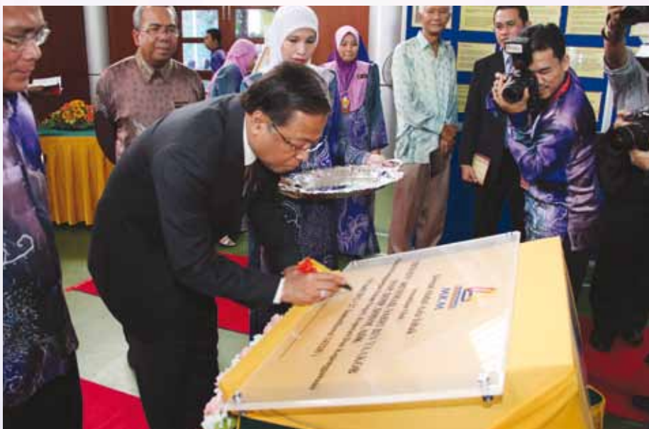
YB Menteri PDNKK merasmikan Dewan Abdul Aziz Ishak

Memetik ucapan YB. Dato' Sri Ismail Sabri bin Yaakob yang menyatakan Agenda Teknologi Maklumat Kebangsaan atau NITA telah dilancarkan pada 1996 oleh Tun Dr. Mahathir Mohamad yang menjadi Perdana Menteri pada ketika itu. Inisiatif NITA memperkenalkan pembangunan Koridor Raya Multimedia atau MSC, di mana e-pembelajaran adalah salah satu daripada tujuh flagship yang diberi perhatian. Sejak itu, semua institusi pengajian di negara kita telah mengambil inisiatif untuk memperkenalkan program pembelajaran cara baru ini. Dengan ini dapat dilihat bahawa MKM berada di landasan yang tepat untuk mengendalikan program ini.