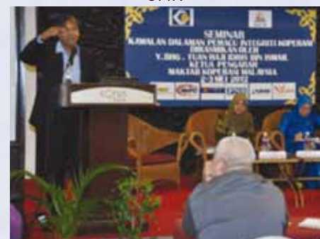
Sesi forum bertajuk “Kawalan Dalaman: Pemacu Integriti Koperasi”