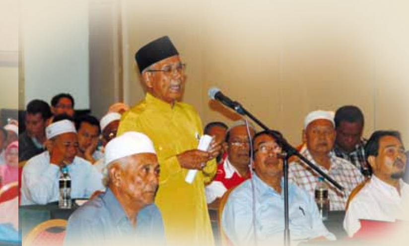
Salah seorang peserta yang mengajukan soalan

Halalan Thoyyiba yang maknanya “Yang halal lagi baik” iaitu makanan yang mampu (dengan izin Allah) mengubah pemikiran, perasaan, jiwa dan akhlak manusia dari kegelapan kepada petunjuk Ilahi. Oleh itu, dengan menjauhi produk yang syubhat dan haram akan menjadikan manusia lebih taat akan perintah Allah dan Rasul. Dengan berakhirnya Bicara Eksekutif ini, para peserta diharapkan akan memperoleh ilmu yang mempunyai nur iaitu hidayah dari Allah. Sepertimana firman Allah maksudnya: “Dikeluarkan mereka oleh Tuhan dari kegelapan (kebodohan dan kedunguan) kepada nur cahaya (ilmu pengetahuan)” (Al-Baqarah:257). Disamping itu, para peserta juga diharapkan akan dapat menilai pembabitan koperasi masing-masing dalam IMP dan seterusnya mengukuhkan lagi sumbangan koperasi dalam bidang pengilangan produk berlandaskan Islam. -Yusnita-