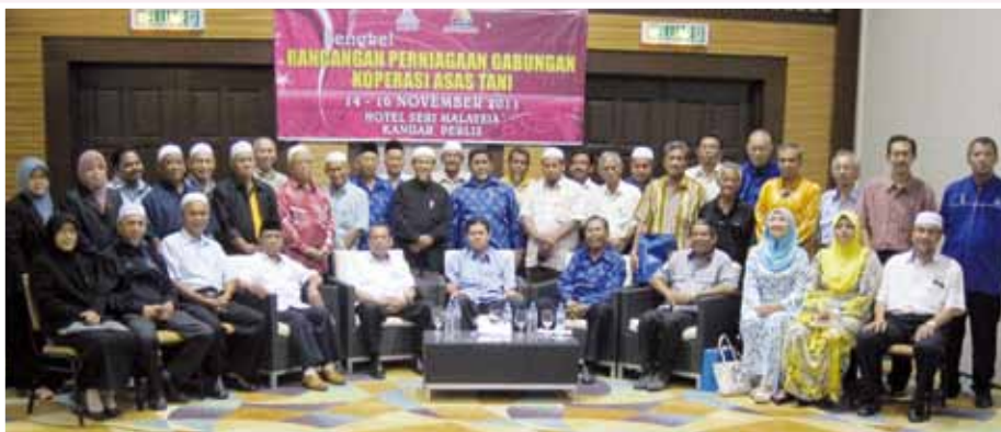
Para Peserta Bengkel Rancangan Perniagaan Gabungan Koperasi Asas Tani