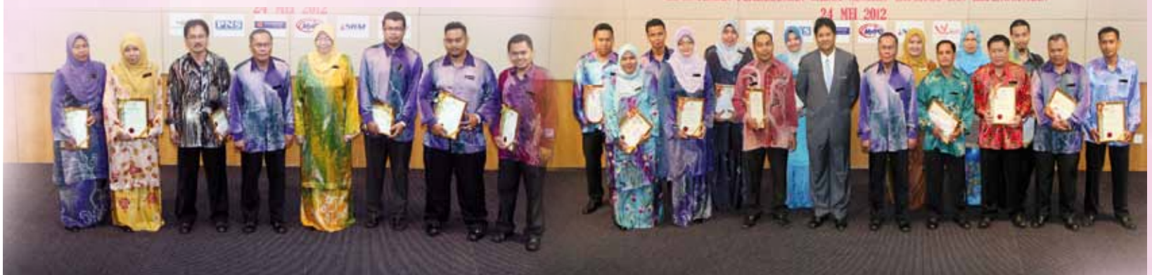
Penerima Anugerah Ketua Pengarah 2011