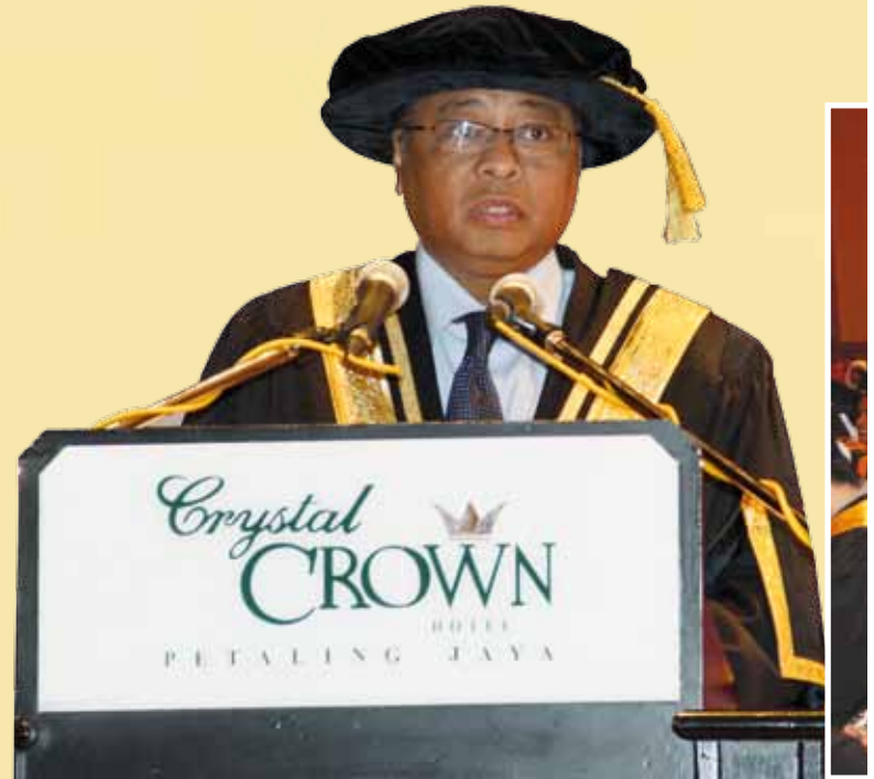
Ucapan perasmian oleh YB Dato' Sri Ismail Sabri bin Yaakob, Menteri PDNKK

“...seramai 11 orang graduan telah terpilih sebagai penerima graduan terbaik dan cemerlang.”