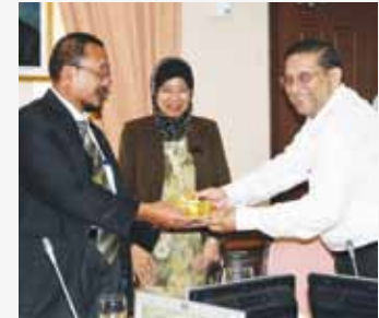
Sesi pemberian cenderamata dari IFFCO kepada MKM