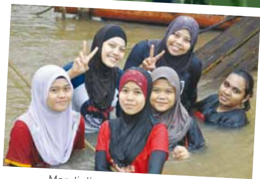
Mandi di sungai Kuala Tahan