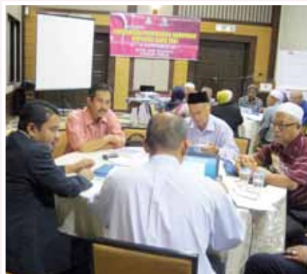
Semasa sesi perbincangan kumpulan

“...kursus ini adalah untuk memberi pendedahan tentang konsep dan kepentingan rancangan perniagaan, memberi kefahaman tentang komponen penting dalam rancangan perniagaan...”