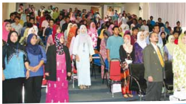
MAJLIS PENYAMPAIAN BAUCAR BUKU MALAYSIA 22.03.2012