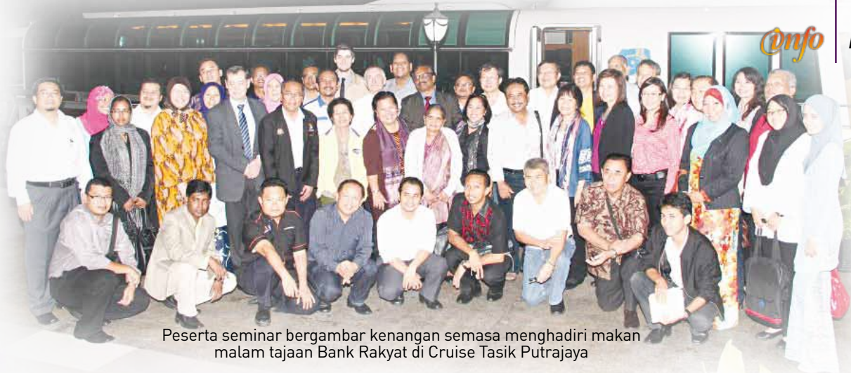
Peserta seminar bergambar kenangan semasa menghadiri makan malam tajaan Bank Rakyat di Cruise Tasik Putrajaya

Seminar Antarabangsa ini dianjurkan bagi membincangkan isu-isu sekeliling gerakan koperasi seperti peranan koperasi, keanggotaan, cabaran dan peluang koperasi dalam pasaran baru pada masa akan datang. Ini juga merupakan inisiatif bersama untuk berkongsi aspirasi, mewujudkan inovasi dan idea yang boleh membina dunia pada masa akan datang dengan lebih baik.