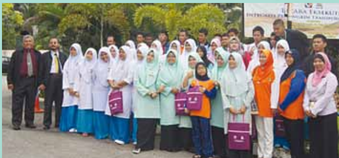
Ahli Koperasi SMK Bandar Kota Tinggi Berhad semasa lawatan sambil belajar ke MKM