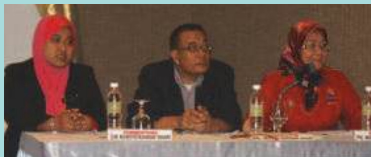
Sesi pembentangan kajian kes oleh pegawai latihan MKM

Program dua hari ini telah dihadiri oleh seramai 56 orang peserta yang terdiri dari Timb. Ketua Pengarah (Akademik), Pengarah Pusat dan Cawangan, pegawai latihan dari MKM Petaling Jaya, Cawangan Sabah, Sarawak, Utara, Timur, Selatan, dua orang pegawai dari KPDNKK Sarawak, dua orang pegawai SKM Sarawak dan seorang pegawai ANGKASA Sabah