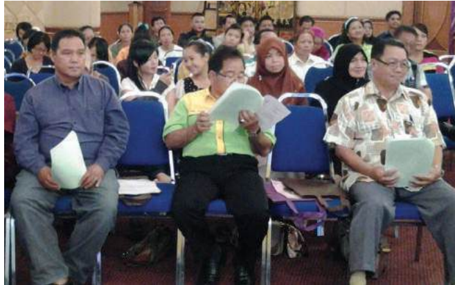
Antara peserta yang turut hadir