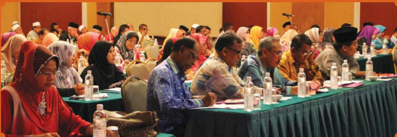
Barisan koperator yang hadir sekitar wilayah Johor dan Melaka