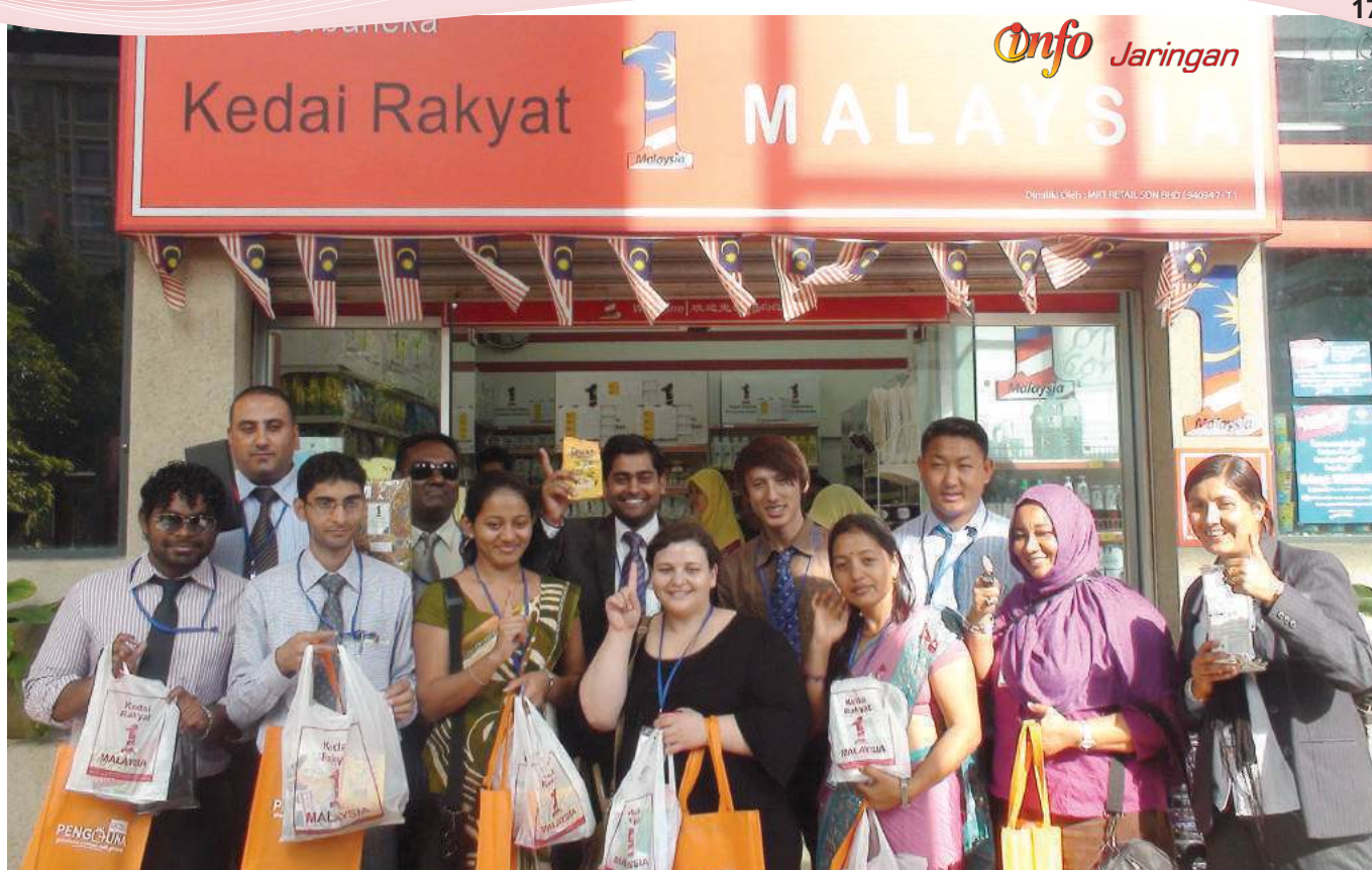
Lawatan ke Kedai Rakyat 1 Malaysia (KR1M) di Kementerian Perdagangan Dalam Negeri Koperasi dan Kepenggunaan