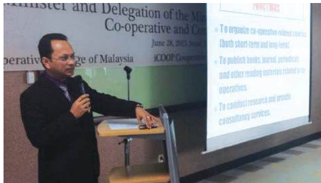
Ketua Pengarah MKM menyampaikan taklimat ketika lawatan di iCoop Cooperative Institute dan Sungkonghoe University