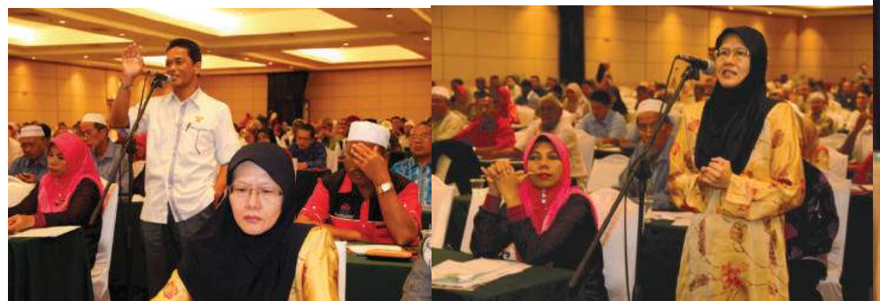
Sesi soal jawab