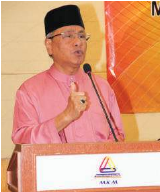
YB Menteri PDNKK menyampaikan ucapan