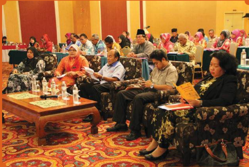
Antara peserta bicara profesional dan tetamu kehormat yang hadir