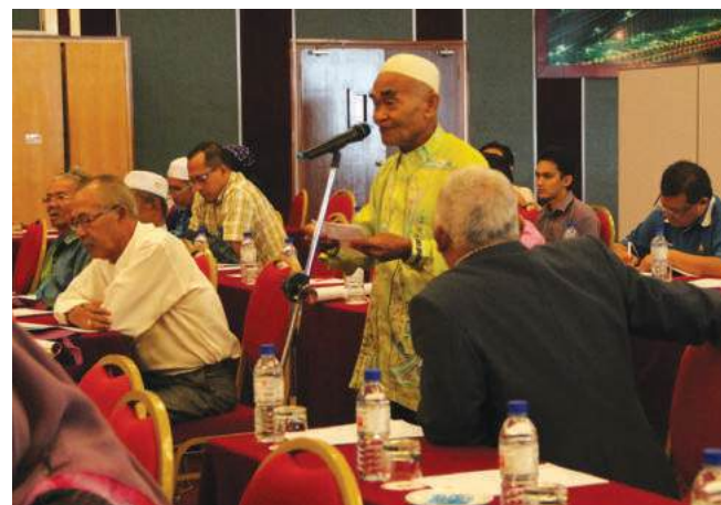
Sesi soal jawab