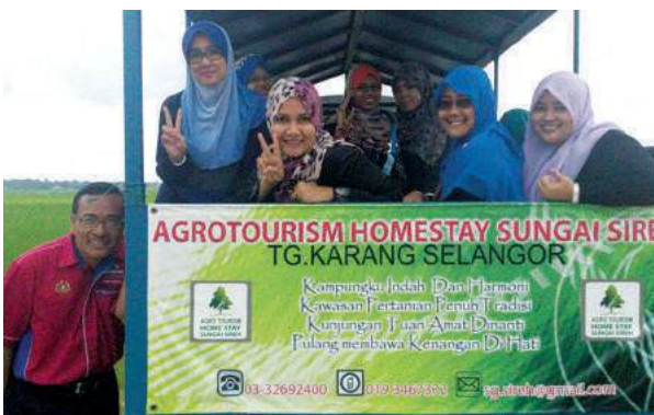
Jentera yang membawa kami mengelilingi Kampung Sungai Sireh Tanjong Karang