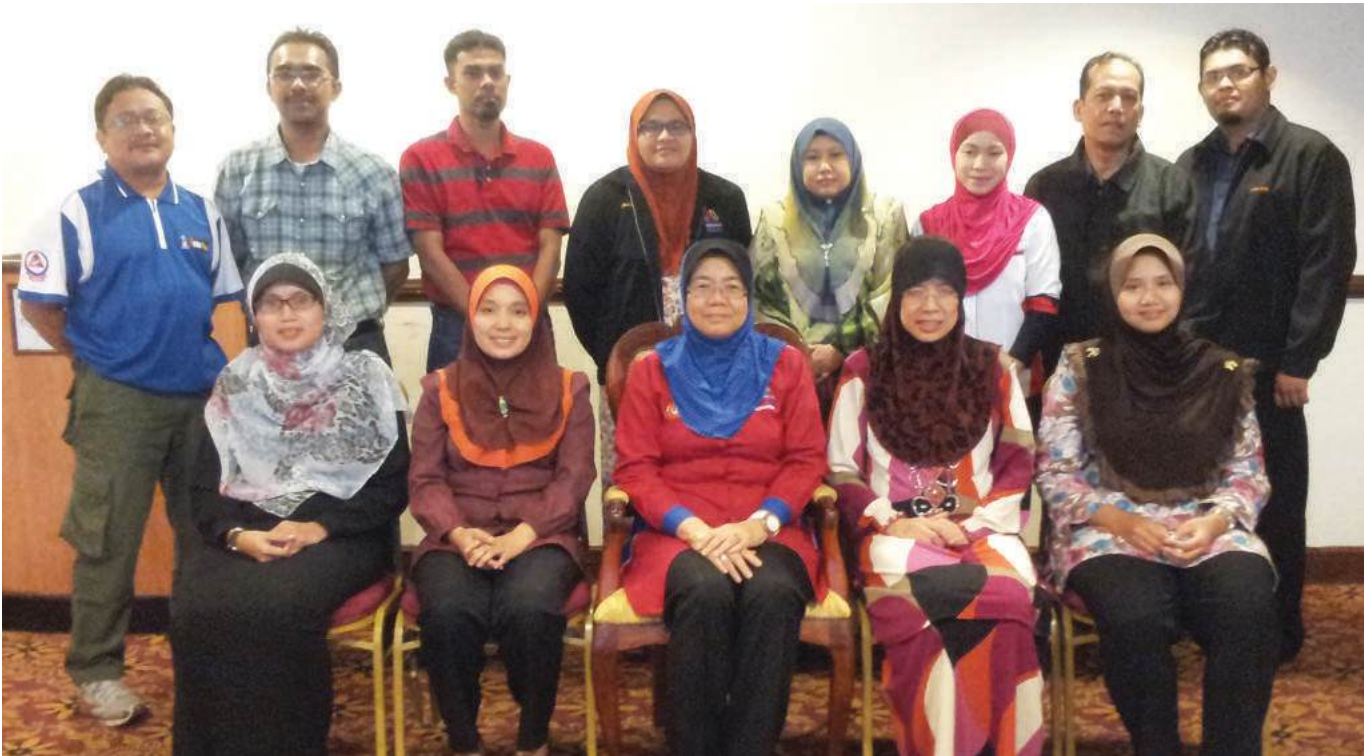
Ahli mesyuarat MBJ

Pada 28 Jun 2013 yang lalu, Maktab Koperasi Malaysia (MKM) telah mengadakan Mesyuarat Bersama Jabatan (MBJ) di Holiday Villa, Alor Setar Kedah. Seramai tiga belas orang ahli mesyuarat MBJ telah menghadiri mesyuarat tersebut.