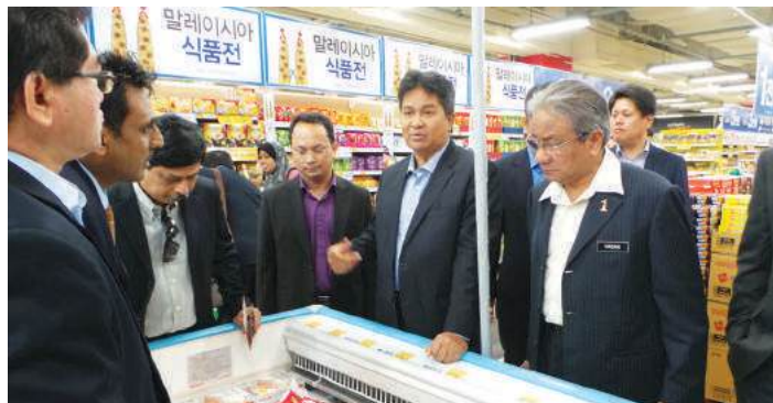
YB Menteri dan rombongan ketika meneliti produk IKS Malaysia di salah sebuah cawangan Homeplus

Di samping itu, YB Menteri dan rombongan turut melawat Seoul National University Co-operative . Koperasi ini dimiliki oleh Seoul National University. Koperasi ini banyak memberi faedah dan kebajikan kepada pelajar universiti bagi memenuhi keperluan mereka. Pelajar sebagai anggota koperasi memperoleh faedah potongan harga bagi alat tulis dan