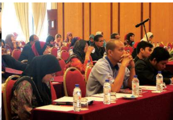
Khusyuk mendengar ceramah