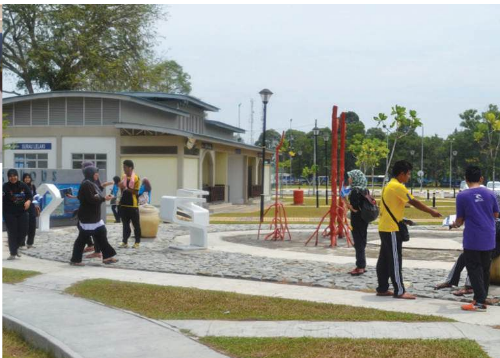
Kelihatan sekumpulan pelajar sedang melakukan promosi program jangka panjang MKM

Pada 6-7 April 2013, Pusat Antarabangsa dan Pendidikan Tinggi telah menganjurkan program Kem Kepimpinan di Kem El-Azzhar, Banting Selangor. Pelajar yang terlibat adalah daripada kalangan Majlis Perwakilan Pelajar (MPP), AJK asrama dan ketua setiap semester. Manakala empat orang pensyarah bertindak sebagai fasilitator.