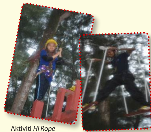
Aktiviti Hi Rope

Melalui aktiviti yang telah dijalankan ini, ia mampu membina nilai positif dalam diri mahasiswa MKM. Selain itu ia juga dapat melahirkan generasi mahasiswa yang mempunyai sifat kepimpinan yang tinggi serta dapat mewujudkan integrasi sosial antara mahasiswa dengan masyarakat setempat.- Nor Fadhilah Mohd.