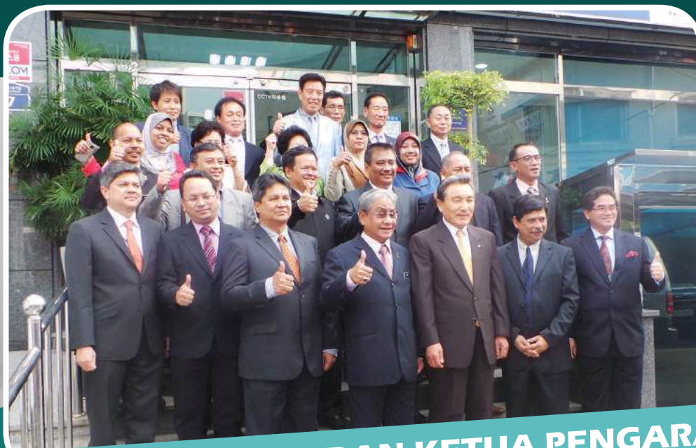
LAWATAN YB MENTERI DAN KETUA PENGARAH MKM KE KOPERASI DI KOREA SELATAN 26 JUN - 2 JULAI 2013