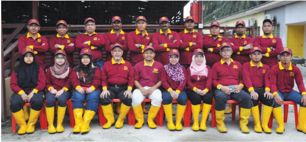
Peserta kursus Pemprosesan Baja Organik Tinja Kambing & Lembu Secara Komersial