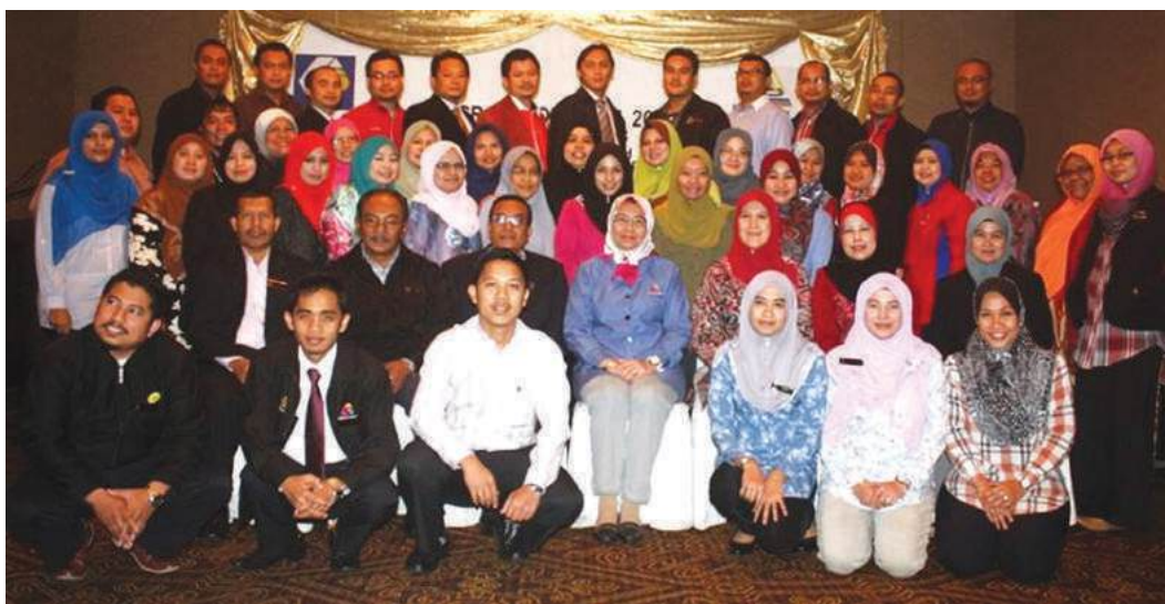
Peserta Kolokium bergambar kenangan yang terdiri daripada pegawai latihan MKM, pegawai KPDNKK, pegawai SKM dan pegawai ANGKASA

Pembudayaan ilmu, perkongsian maklumat dan pengalaman dalam kalangan pegawai latihan Maktab Koperasi Malaysia (MKM) merupakan teras utama dalam mencapai hasrat menjadikan MKM sebagai pusat kecemerlangan pendidikan koperasi di Malaysia. Sejarar dengan itu, pada 24 hingga 26 Jun 2013 bertempat di Hotel Hilton Kuching, Sarawak telah berlangsung Program Kolokium 2013 yang telah dianjurkan oleh Pusat Pengurusan Penyelidikan dan Inovasi (R&I) dengan kerjasama MKM Cawangan Sarawak.