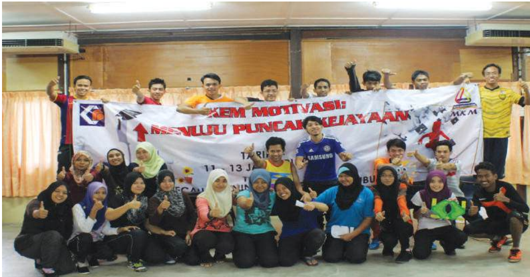
Pelajar bergambar kenangan

Pada 11-13 Januari 2013, Pusat Antarabangsa dan Pendidikan Tinggi telah menganjurkan program Kem Motivasi di Kem Bina Semangat Ampang Pecah Training Centre. Seramai 26 orang pelajar Diploma Pengurusan Koperasi telah mengikuti program ini. Empat orang fasilitator turut terlibat dalam program ini.