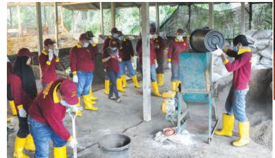
Latihan amali untuk menghancurkan tinja