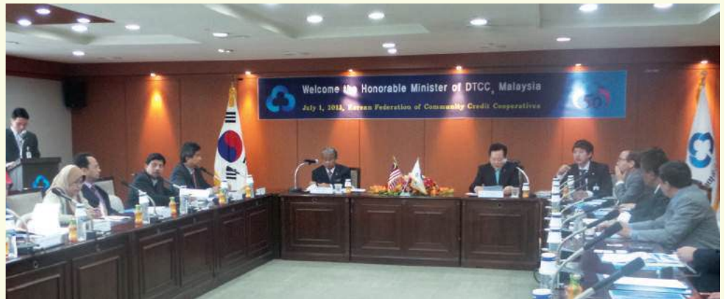
YB Menteri dan rombongan ketika perbincangan bersama KFCC