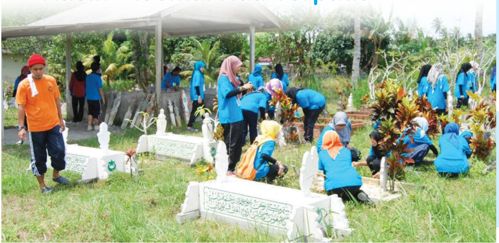
Gotong royong membersihkan kawasan kubur