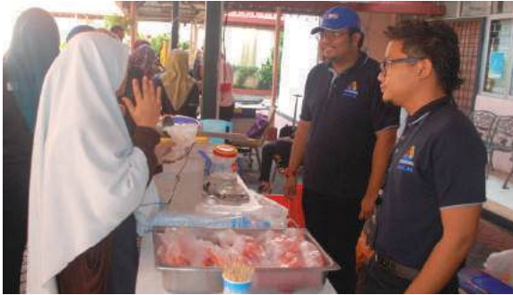
Gerai jualan pelajar