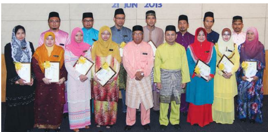
Penerima Anugerah Perkhidmatan Cemerlang 2012

Dalam ucapannya, YBhg. Dato' Haji Md. Yusof bin Samsudin menyeru agar MKM sentiasa menjadi sebuah pasukan yang berprestasi tinggi iaitu sering memberi kepuasan kepada pelanggan, pekerja, stakeholders serta pihak lain yang berkepentingan dalam organisasi, sentiasa menekankan aspek penambahbaikan yang berterusan dalam perancangan dan pengurusan aktiviti serta kerap menghasilkan kualiti kerja yang lebih baik. – Rubiah Sabran