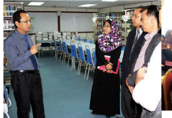
Ketua Pengarah MKM beramah mesra dengan kakitangan MKM Cawangan Sabah

M KM Cawangan Sabah telah berjaya melaksanakan Bicara Profesional dengan tajuk “Penentu Kejayaan Koperasi: Anggota atau Anggota Lembaga Koperasi (ALK)?” Program ini diadakan pada 6 April 2013 bertempat di Hotel Juta Keningau, Sabah dengan kehadiran seramai 120 orang peserta yang terdiri daripada anggota dan Anggota Lembaga Koperasi (ALK).