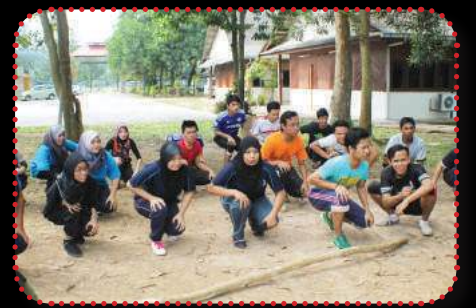
Penalti yang dikenakan kepada pelajar