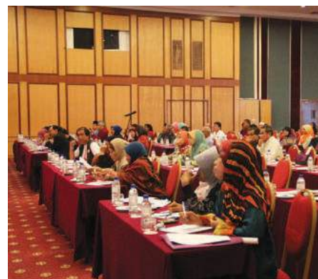
Sebahagian peserta yang hadir