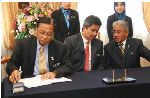
YB Dato' Hasan Malek (kanan) menandatangani portfolio penyerahan tugas sebagai Menteri PDNKK

Tanggal 22 Mei 2013, bertempat di Kementerian Perdagangan Dalam Negeri, Koperasi dan Kepenggunaan (KPDNKK) telah diadakan Majlis Serah Tugas antara Mantan Menteri KPDNKK YB Dato' Sri Ismail Sabri bin Yaakob dengan Menteri KPDNKK yang baru iaitu YB Dato' Hasan bin Malek serta Mantan Timbalan Menteri KPDNKK YB Datuk Hj. Rohani Abd. Karim dengan YB Dato' Paduka Ahmad Bashah bin Md. Hanipah sebagai Timbalan Menteri KPDNKK yang baru.