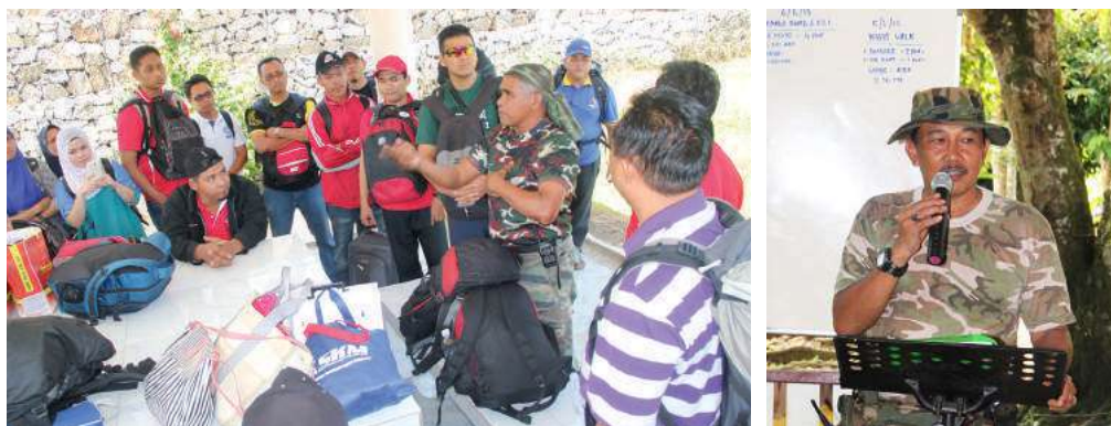
Sesi taklimat mengenai aktiviti yang akan dijalankan

Taman Negara menjadi sebuah destinasi ekopelancongan terkenal di Malaysia. Terdapat banyak daya tarikan dari segi geologikal dan biologikal di taman ini serta sesuai untuk semua aktiviti. Menempuh perjalanan selama 3 jam dari Kuala Lumpur ke Taman Negara Kuala Pahang amat membolehkan. Namun, ianya sangat berbaloi apabila dapat menjejaskan kaki di sana. Keindahan hutan hujan tropika, kicauan unggas, serta bunyi aliran Sungai Tembeling begitu mengasyikkan.