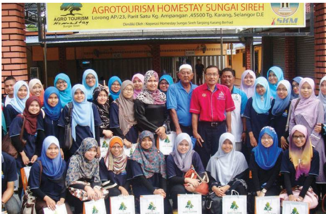
Bergambar sebelum berangkat pulang

dan Kepimpinan Koperasi) kepada Koperasi Homestay Sungai Sireh Tanjung Karang Berhad Tanjung Karang, Kuala Selangor. Sebelum pulang, kami diberikan kesempatan untuk mengelilingi kampung Sungai Sireh tersebut dengan menaiki jentera beramai-ramai. Perasaan kami sekali lagi teruja kerana barangkali ada antara kami baru pertama kali