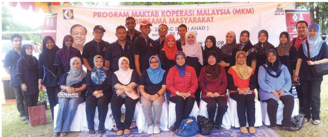
Kakitangan MKM yang terlibat sepanjang program berlangsung

M aktab Koperasi Malaysia (MKM) melakarkan satu lagi sejarah pada tanggal 22-24 Mac 2013 apabila MKM buat julung kalinya menganjurkan program di bawah tanggungjawab sosial (CSR) yang bertujuan mendekati masyarakat koperasi khususnya dan masyarakat luar bandar umumnya.