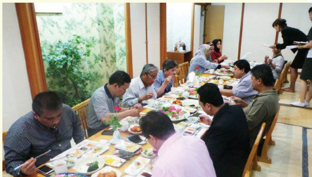
Makan tengah hari bersama YB Menteri dan rombongan yang telah dihoskan oleh MKM