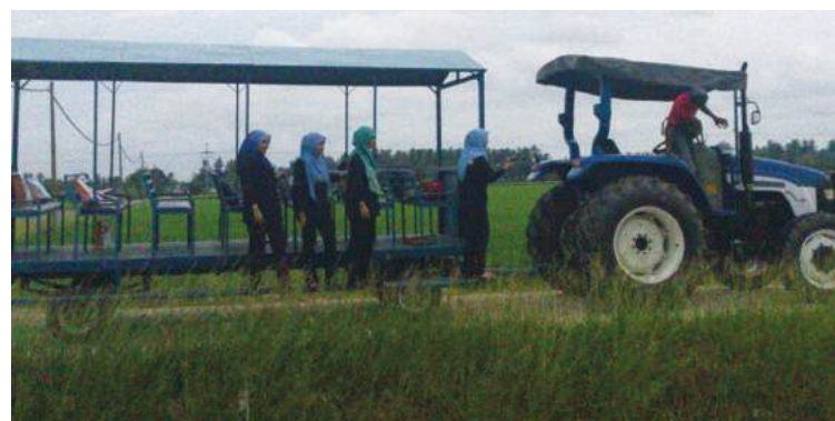
Antara penduduk kampung yang menjalani aktiviti petang mereka