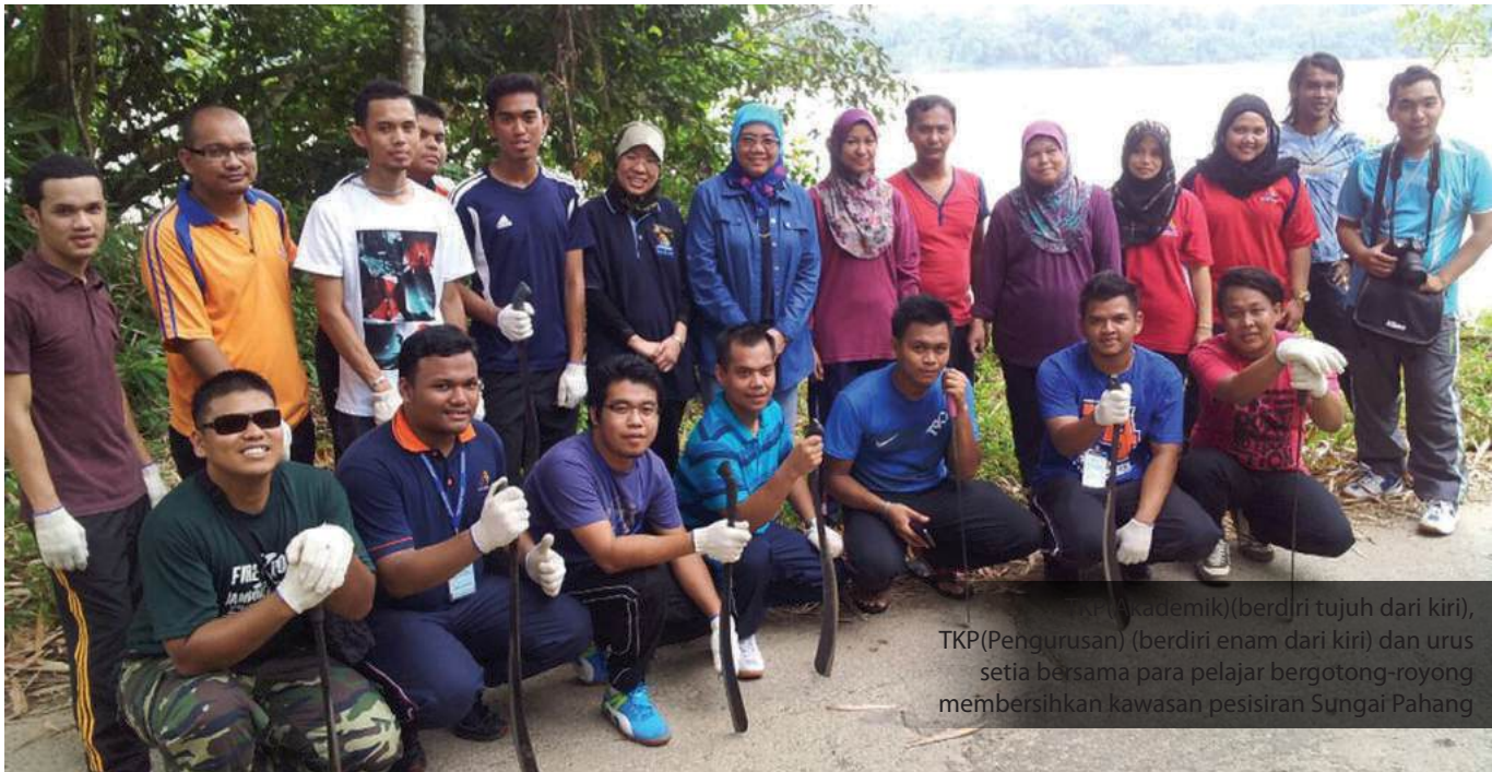
... akademik)(berdiri tujuh dari kiri), TKP(Pengurusan) (berdiri enam dari kiri) dan urus setia bersama para pelajar bergotong-royong membersihkan kawasan pesisiran Sungai Pahang

Secara keseluruhannya program MKM bersama masyarakat ini dilihat berjaya membuka minda pelajar serta mendidik jati diri dan ketahanan pelajar bagi mewujudkan pelajar MKM yang berkebolehan dan tidak hanya tertumpu kepada aspek akademik semata-mata. Selain itu program ini berjaya memperkenalkan MKM kepada