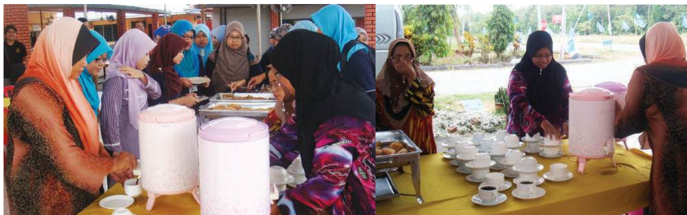
Layanan yang diberikan oleh Anggota Koperasi Homestay