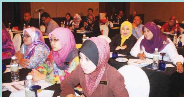
Antara peserta program kolokium 2013 yang hadir