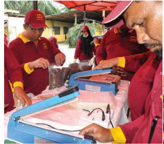
Proses pembungkusan baja organik

Maklum balas diberikan oleh peserta ialah kursus ini dapat membantu perniagaan penternakan mereka untuk