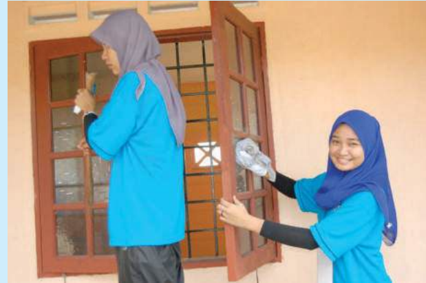
Gotong-royong membersihkan balai raya