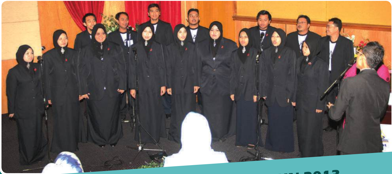
KUMPULAN KOIR MKM 21 JUN 2013