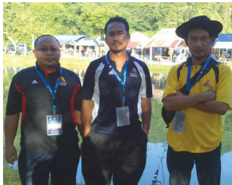
Pasukan memancing MKM