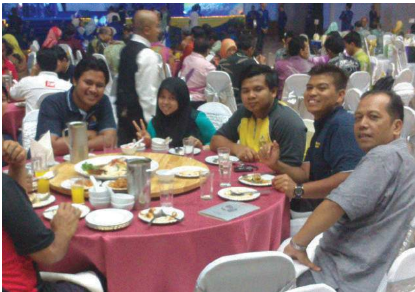
Majlis makan malam