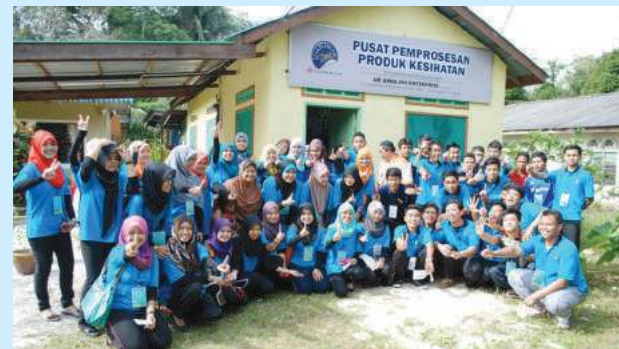
Lawatan ke Pusat Pemrosesan Produk Kesihatan

pelajar MKM dengan masyarakat luar. Tugasan yang dilakukan atas khidmat komuniti ini dijangka mampu melatih dan membina kredibiliti serta kepimpinan, usaha sama dan profesionalisme dalam diri pelajar serta dapat mengeratkan silaturahim antara peserta dengan pihak yang terlibat. Selain itu, program yang dijalankan ini juga memberi pelbagai faedah kepada semua pihak yang terlibat secara langsung atau tidak langsung. Program ini mengambil masa tiga hari dua malam dan hari pertama merupakan perjalanan diikuti dengan taklimat ringkas serta penyerahan peserta kepada keluarga angkat.