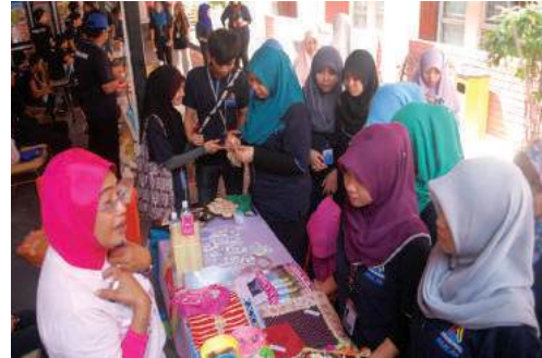
Sebahagian pameran dari MAKNA dan AADK