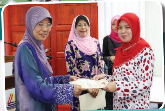
MESYUARAT AGUNG PUSPANITA 22 FEBRUARI 2013