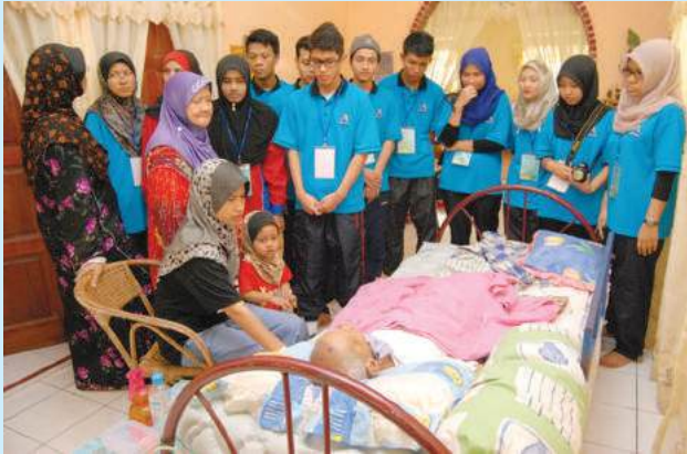
Lawatan ke rumah penduduk kampung yang uzur