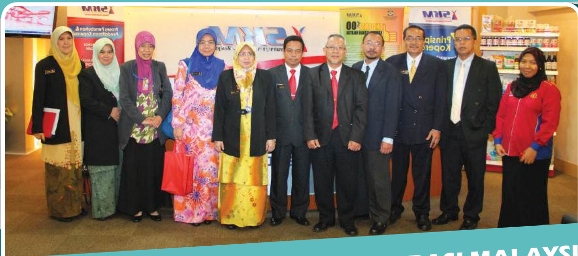
LAWATAN KE SURUHANJAYA KOPERASI MALAYSIA 27 FEBRUARI 2013