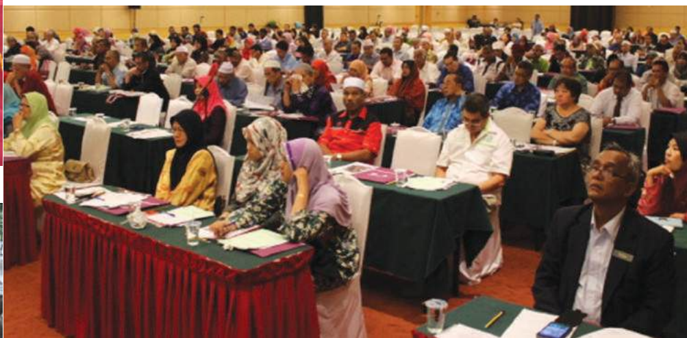
Sebahagian peserta Bicara Profesional

Pematuhan terhadap perundangan koperasi merupakan suatu perkara yang signifikan dan perlu dititikberatkan oleh koperasi. Ia mencerminkan konsep tadbir urus yang baik bagi sesebuah koperasi. Peruntukan Seksyen 86B Akta Koperasi 1993, telah menzahirkan kuasa kepada pihak Suruhanjaya Koperasi Malaysia (SKM) untuk mengeluarkan garis panduan yang perlu untuk memberi kuat kuasa sepenuhnya kepada peruntukan Akta. Justeru, semua koperasi dikehendaki untuk mematuhi peruntukan yang terdapat dalam garis panduan yang dikeluarkan oleh SKM.