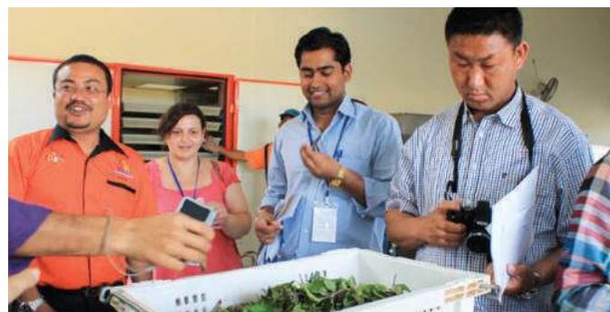
Lawatan ke Koperasi Pekebun Getah Negeri Melaka Berhad dan Koperasi Anggota-anggota Kerajaan Batu Pahat Berhad

Perkhidmatan Perpustakaan MKM yang bertujuan untuk memperkenalkan identiti Malaysia di mata dunia.