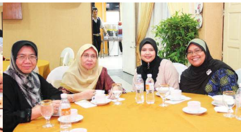
Tetamu jemputan menikmati juadah berbuka puasa