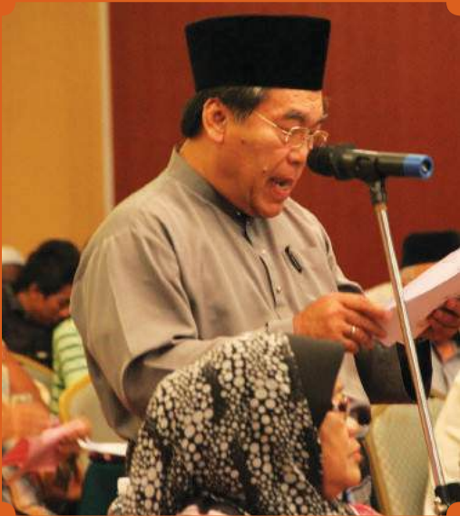
Sesi soal jawab