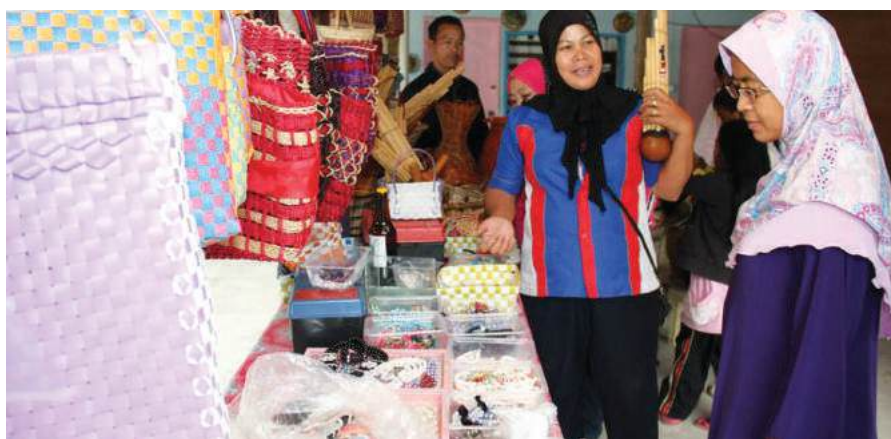
Hasil kraf tangan untuk dijual kepada pengunjung