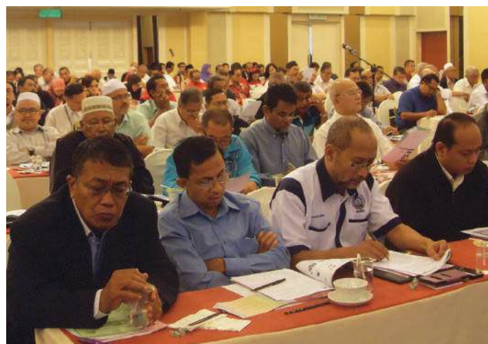
Antara peserta yang hadir