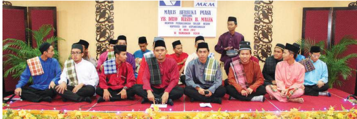
Persembahan qasidah oleh pelajar MKM

Pada 19 Julai 2013 bersamaan 10 Ramadhan 1343H, telah berlangsung Majlis Berbuka Puasa bersama YBhg. Dato' Hasan b. Malek Menteri Perdagangan Dalam Negeri, Koperasi dan Kepenggunaan bertempat di MKM kampus induk, Jalan Templer Petaling Jaya, Selangor.