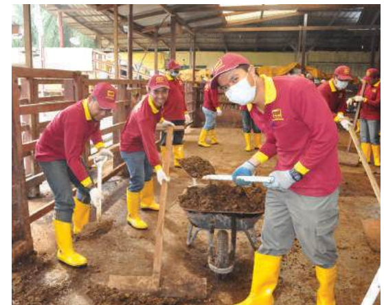
Peserta kursus sedang menjalani latihan amali mengumpul tinja lembu

lebih maju dan berdaya saing dalam industri ini agar lebih berjaya di masa hadapan. Program ini juga mendapat sambutan yang menggalakkan dan para peserta juga berharap program seperti ini dapat diteruskan lagi di masa akan datang. - Norhayati Abd Rahman