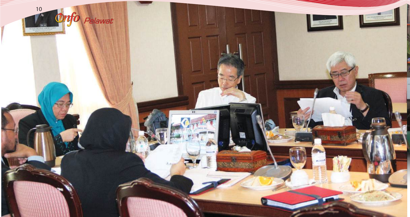
Ahli mesyuarat sedang mendengar pembentangan keberkesanan program luar negara