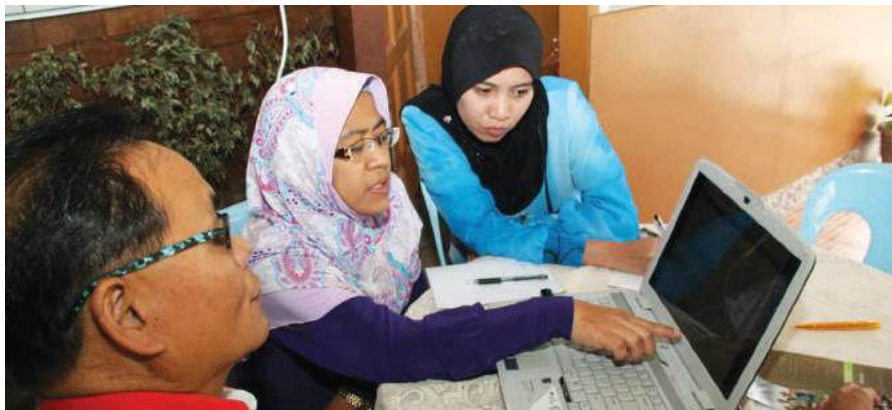
Perbincangan antara Pengarah MKM Caw. Sabah dan wakil dari Koperasi Walai Tokou

Kampung Sinsinan terletak di kaki Gunung Kinabalu, 13km dari Pekan Ranau dan 98km dari Kota Kinabalu. Kampung ini telah diwujudkan pada 1932 dan kini kampung ini dihuni oleh seramai 968 orang penduduk. Kebanyakan dari penduduknya bekerja sebagai petani dan pekebun manakala generasi muda lebih minat bekerja sebagai kakitangan Kerajaan atau pun syarikat swasta.