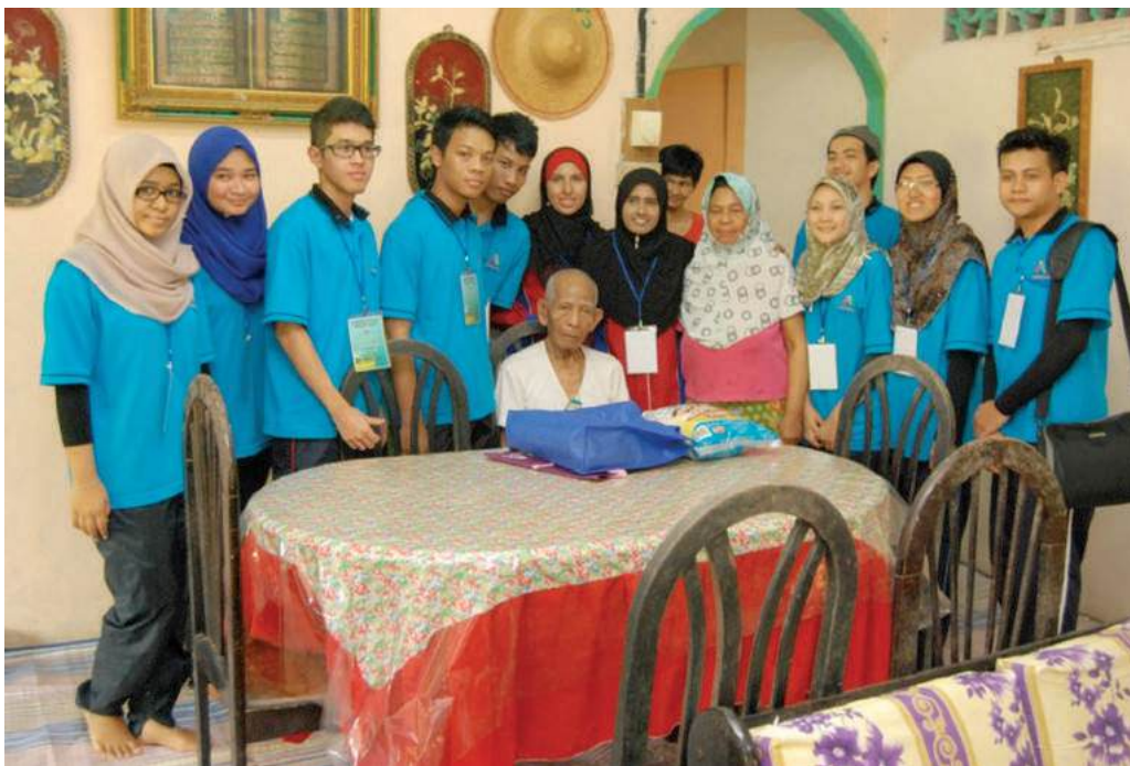
Lawatan ke rumah keluarga angkat

Pada 22-24 Februari 2013, Pusat Antarabangsa dan Pendidikan Tinggi Maktab Koperasi Malaysia di bawah subjek Kokurikulum telah menganjurkan Program Keluarga Angkat "Kasih Disemai Hati Terpaut" di Kampung Tenglu Mersing Johor yang melibatkan seramai 38 peserta program dan 20 orang ahli jawatankuasa pelaksana. Para peserta serta ahli jawatankuasa pelaksana terdiri daripada pelajar Diploma Pengurusan Koperasi Semester 2.