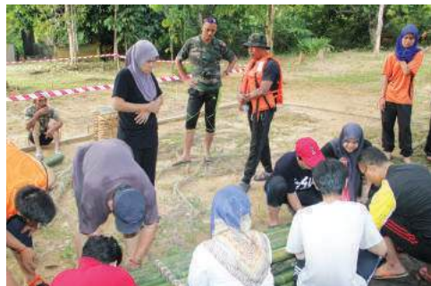
Gigih menyiapkan rakit