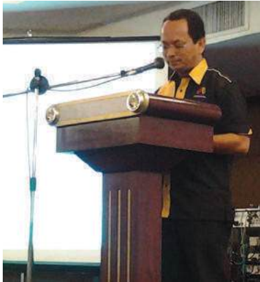
Ketua Pengarah MKM merasmikan majlis