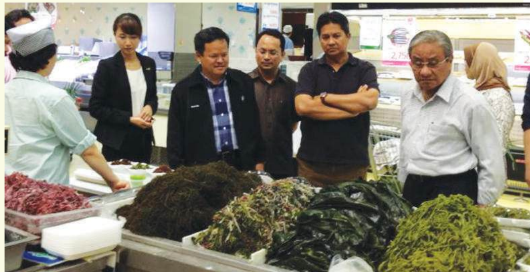
YB Menteri dan rombongan ketika melawat Hanaro Club Mart