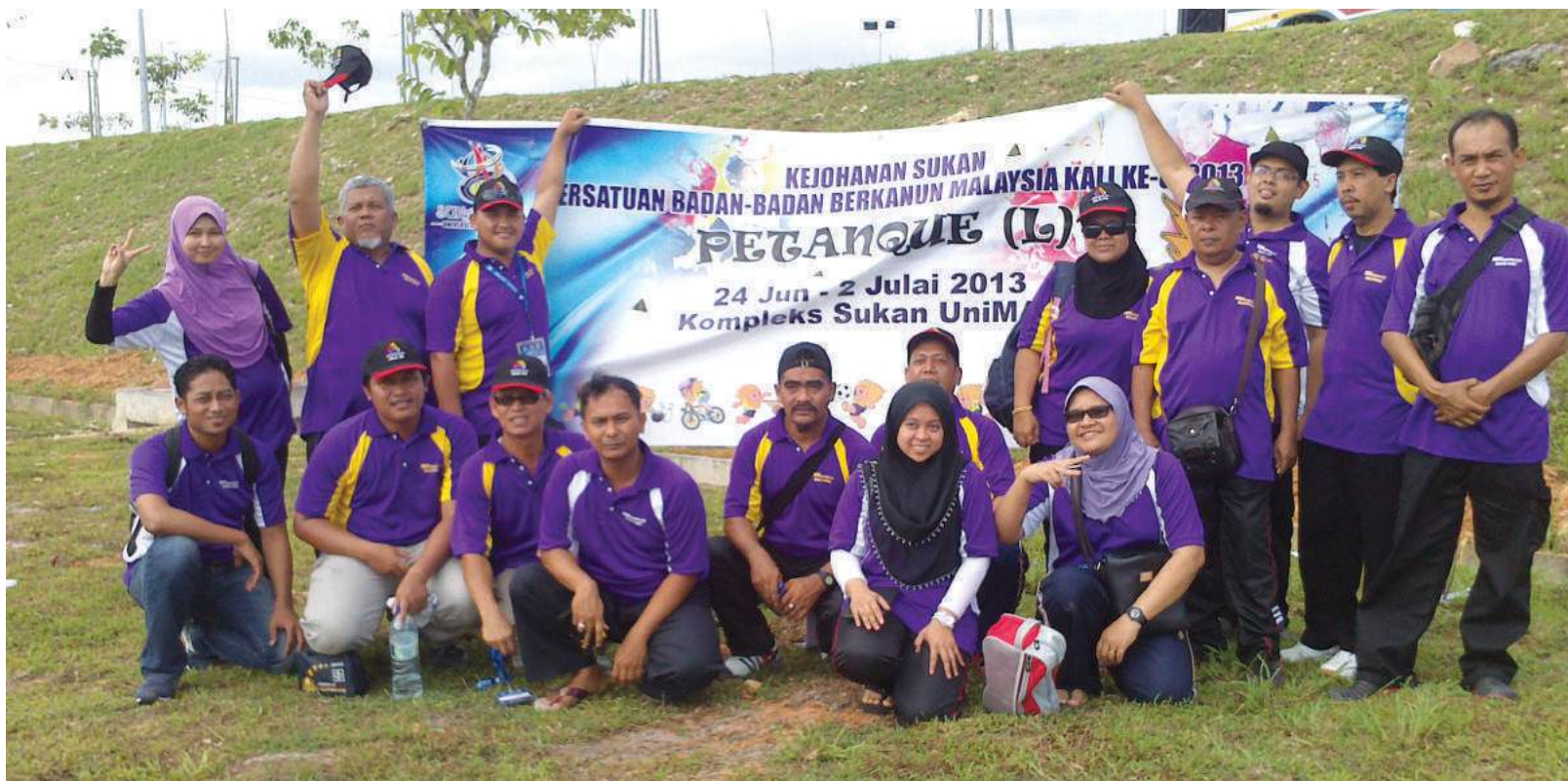
Kontinjen MKM hadir memberi semangat kepada pasukan petanque

seorang pengurus. Jarak bagi acara basikal bukit ini adalah 30km yang meliputi laluan jalan raya dan laluan off road iaitu pendakian