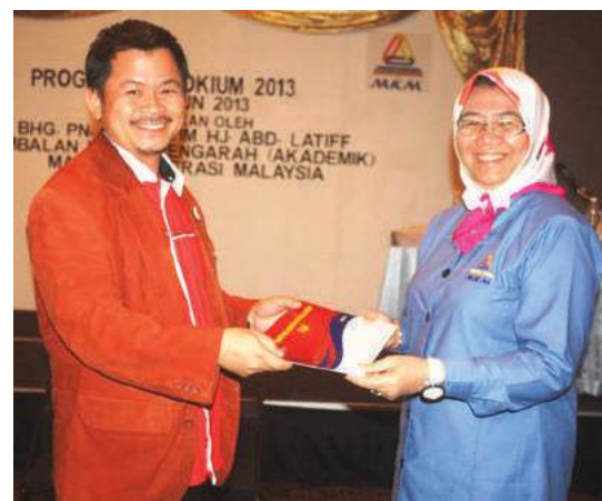
Penyampaian cenderamata dan sijil

pengurusan yang membincangkan isu dan masalah berkaitan pentadbiran dan pengurusan koperasi yang boleh menjadi bahan rujukan kepada tenaga pengajar untuk merancang dan memimpin pembelajaran yang lebih sistematik semasa menggunakan kajian kes ini sebagai bahan pengajaran.