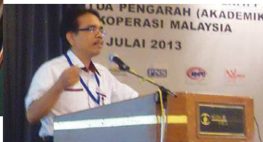
Setiausaha KPPCB sedang berkongsi pengalaman

Laporan Ekonomi 2012/2013 menganggarkan sumbangan sektor pengangkutan dan penyimpanan sebanyak 5.2% kepada Keluaran Dalam Negara Kasar (KDNK) dan diunjurkan peningkatan kepada 6.7% untuk tahun 2013. Sehingga tahun 2011, terdapat 418 buah koperasi terlibat dalam sektor ini dengan hasil sebanyak RM558 juta. Prestasi ini perlu dipertingkatkan untuk memastikan sumbangan koperasi dalam sektor pengangkutan adalah signifikan.