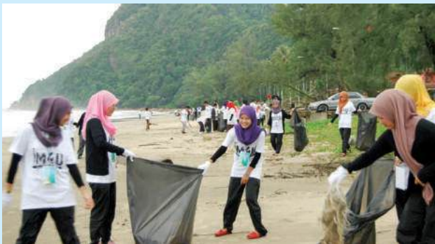
Gotong-royong membersihkan kawasan pantai