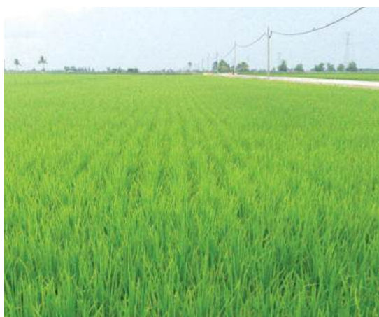
Sawah padi terbentang luas di Kampung Sungai Sireh Tanjung Karang