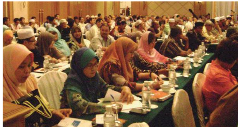
Sebahagian peserta yang menghadiri Bicara Profesional