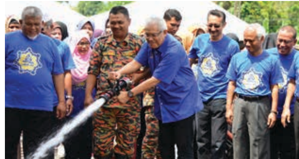
✦ YB Menteri KPDNKK turut turun padang bergotong-royong bersama-sama penduduk kampung

Antara objektif utama program ini diadakan adalah untuk memupuk penghayatan semangat budaya bantu-membantu sesama masyarakat dalam meningkatkan mutu persekitaran kehidupan insan. Selain daripada itu, program ini turut bertujuan mempromosikan MKM secara amnya dan program-program MKM khususnya kepada masyarakat setempat dan seterusnya membentuk nilai positif jati diri, peranan bekerjasama serta menampilkan sahsiah kepimpinan berakhlak mulia dalam kalangan pelajar MKM.