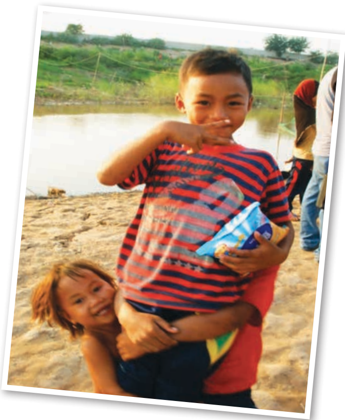
▲ Mereka gembira setelah menerima pemberian daripada kami

Seminar anjuran IPDM ini telah disertai seramai 25 orang dari pelbagai bidang termasuk institusi pengajian