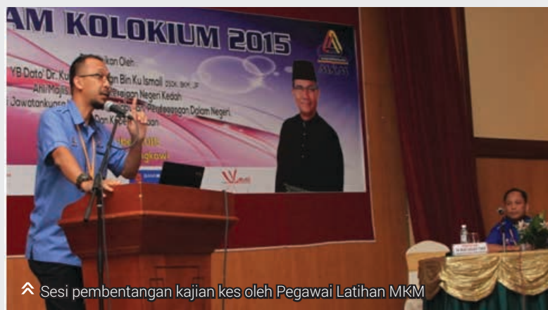
▲ Sesi pembentangan kajian kes oleh Pegawai Latihan MKM

Program ini amat bermanfaat dan memberi impak yang positif kepada peserta menerusi perkongsian ilmu dan pengalaman yang berguna dalam membantu gerakan koperasi untuk berdaya maju dan berdaya saing.