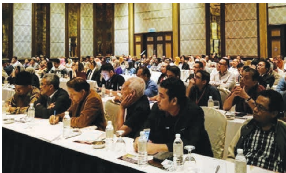
➤ Antara koperator yang menjadi peserta seminar

Di akhir Seminar, para peserta diberi peluang untuk