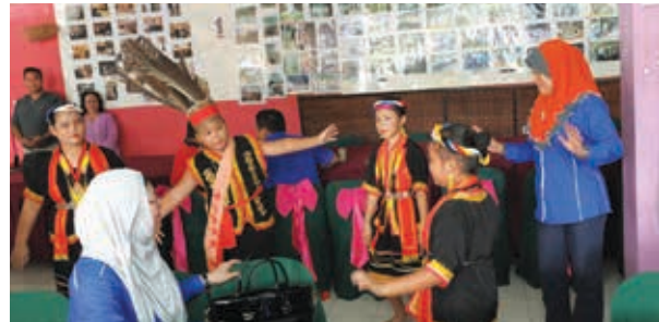
▲ Tarian kebudayaan oleh penduduk Kampung Mongkos sambil turut disertai oleh salah seorang Pengarah MKM