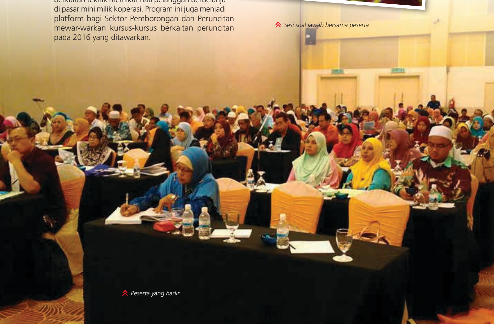
⤴ Peserta yang hadir