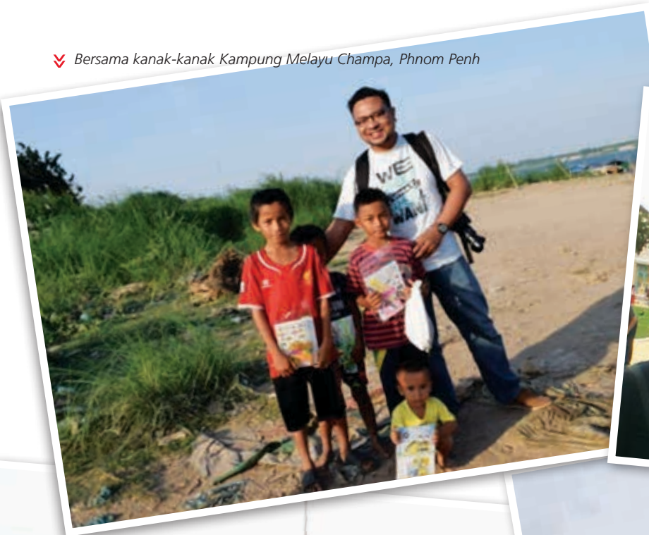
✓ Bersama kanak-kanak Kampung Melayu Champa, Phnom Penh