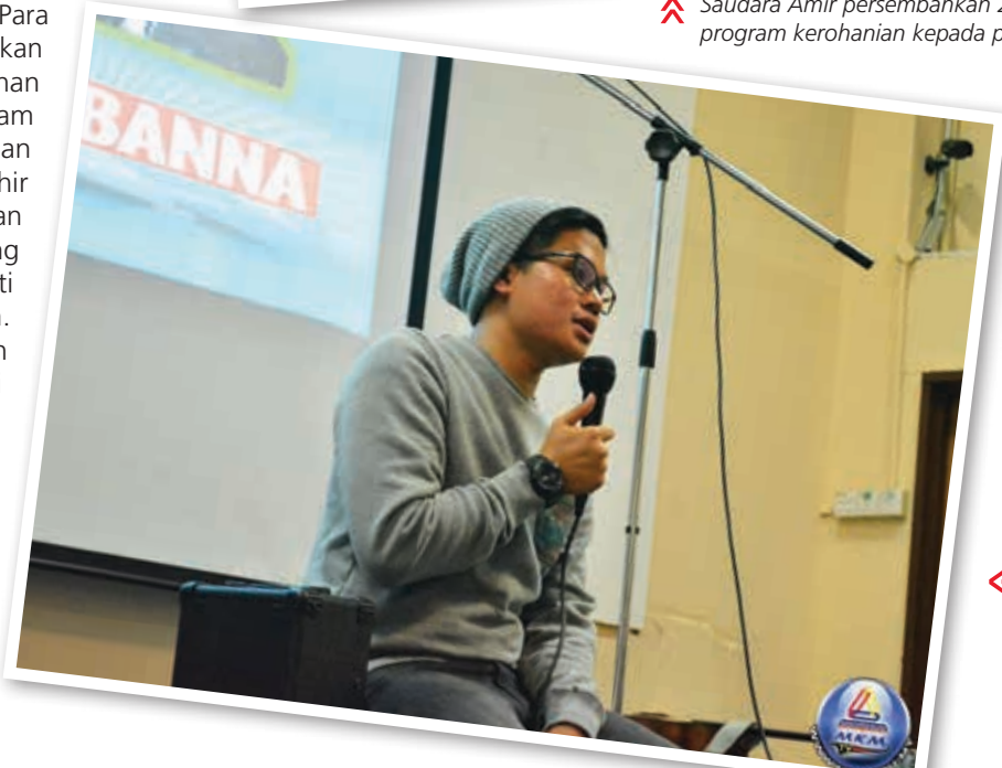
◀ Penceramah jemputan saudara Aiman sedang berkongsi pengalaman hidupnya kepada para pelajar