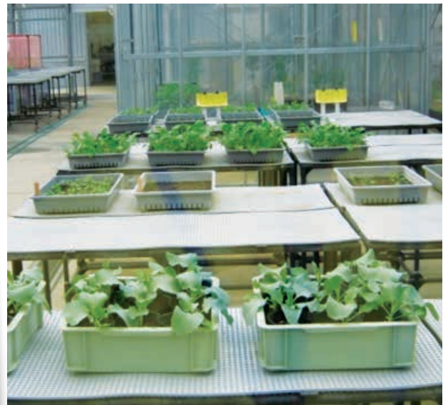
▲ Lawatan peserta program ke kawasan pertanian rumah hijau yang diusahakan oleh Koperasi Pertanian Enshu-chuo di Wilayah Shizuoka