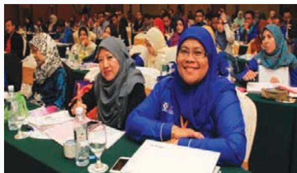
Peserta program Kolokium 2015