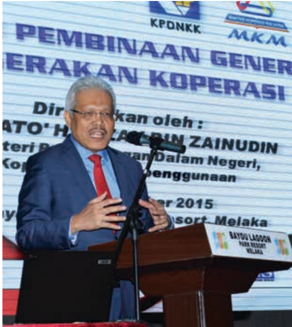
▲ YB Dato' Seri Hamzah Bin Zainudin, Menteri Kementerian Perdagangan Dalam Negeri, Koperasi dan Kepenggunaan

Pada 21-22 Oktober 2015, Pusat Pendidikan Tinggi MKM telah menganjurkan "Seminar Pembinaan Generasi Belia Dalam Gerakan Koperasi Negara". Sasaran peserta seminar ialah anggota koperasi yang berumur 21-40 tahun, pelajar institusi pengajian tinggi (IPT) dan golongan belia yang berminat. Seramai 455 peserta telah menghadiri seminar ini yang diadakan di Bayou Lagoon Park Resort, Melaka. Seminar anjuran Pusat Pendidikan Tinggi ini bertujuan untuk memberi pendedahan kepada golongan Gen-Y mengenai kepentingan berkoperasi, membimbing dan membentuk