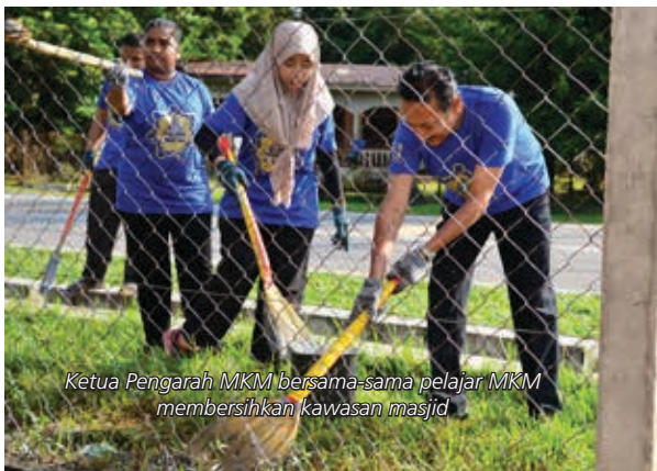
Ketua Pengarah MKM bersama-sama pelajar MKM membersihkan kawasan masjid

Antara impak program khidmat masyarakat yang dianjurkan ini antaranya termasuklah memberi pendedahan kepada masyarakat setempat mengenai fungsi dan peranan MKM sebagai salah sebuah agensi di bawah KPDNKK. Selain itu, program seperti ini juga turut membina nilai dan sifat yang positif dalam diri pelajar yang akhirnya diharap dapat membentuk generasi pelajar yang prihatin dan berupaya berbakti kepada masyarakat dan negara pada masa akan datang.