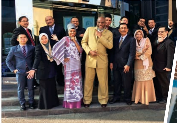
▲ Para peserta bergambar bersama Fasilitator