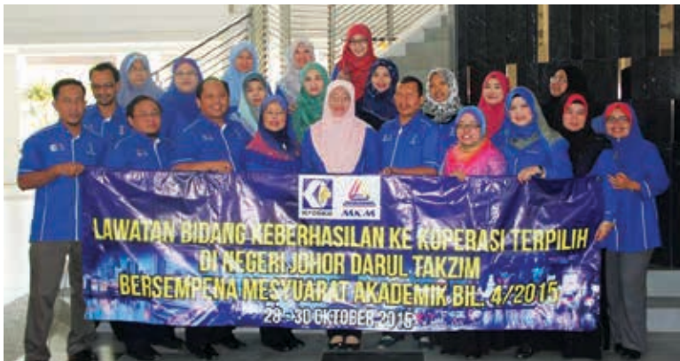
▲ Peserta lawatan bidang keberhasilan di Johor

Pada 28 dan 29 Oktober 2015, Maktab Koperasi Malaysia Zon Selatan telah menjadi urus setia dan mengatitkan lawatan bidang keberhasilan selama dua hari ke tiga buah koperasi terpilih di Johor iaitu Koperasi Pekebun Kecil Wilayah Johor Selatan Berhad (KOPRIS), Koperasi Pelaburan Pekerja-pekerja KEJORA Kota Tinggi Berhad dan Koperasi Kg. Sungai Latoh Kongkong Masai Berhad di samping taklimat Coop City bersama ANGKASA Negeri Johor. Lawatan bidang keberhasilan yang diadakan ini bersempena dengan Mesyuarat Akademik Bil. 04/2015.