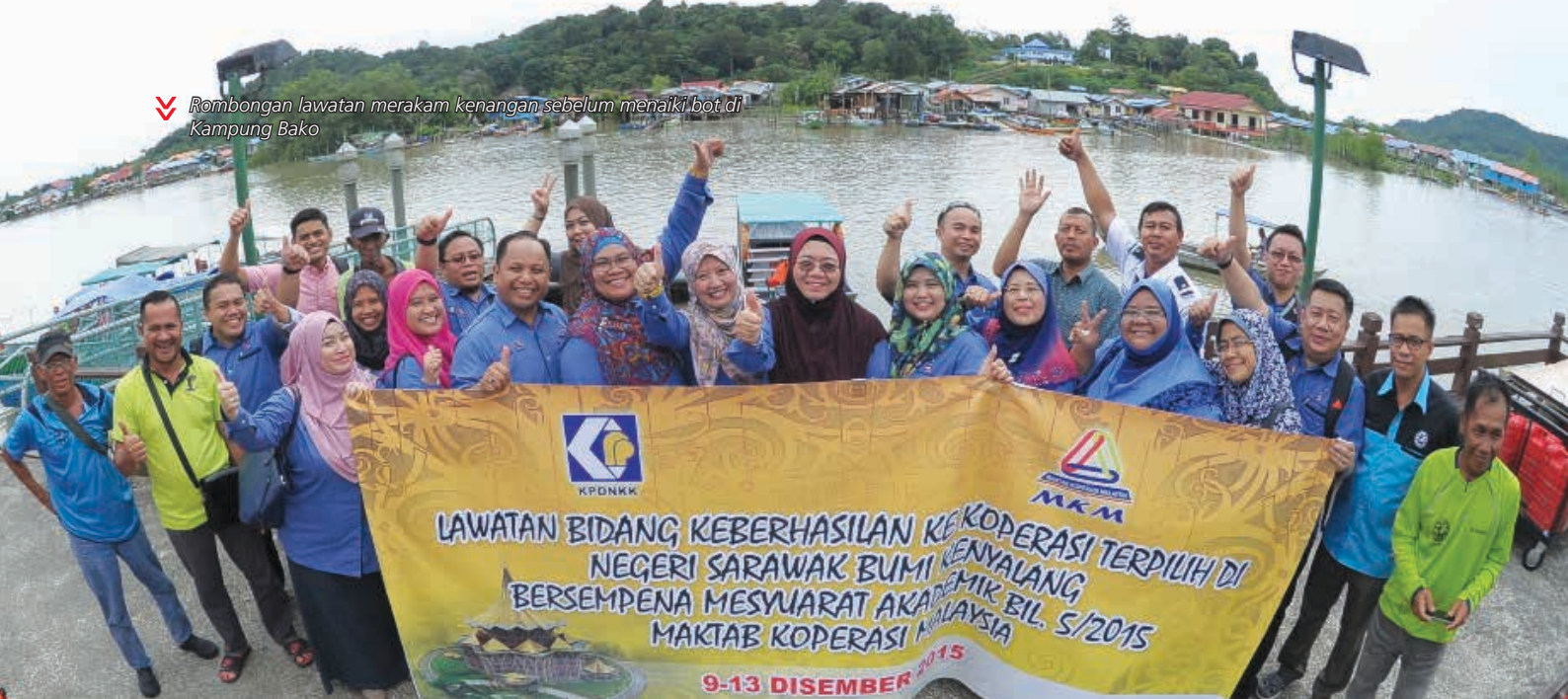
▼ Rombongan lawatan merakam kenangan sebelum menaiki bot di Kampung Bako

KPDNKK MKM LAWATAN BIDANG KEBERHASILAN KE KOPERASI TERPILIH DI NEGERI SARAWAK BUMI KENYALANG BERSEMPENA MESYUARAT AKADEMIK BIL. 5/2015 MAKTAB KOPERASI MALAYSIA 9-13 DISEMBER 2015