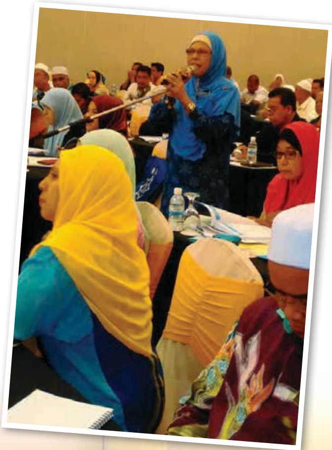
⤴ Sesi soal jawab bersama peserta

Para peserta memberi respon yang baik terhadap kupasan isu yang dikongsikan oleh penceramah kerana pelbagai ilmu baharu yang dikongsikan berkaitan teknik memikat hati pelanggan berbelanja di pasar mini milik koperasi. Program ini juga menjadi platform bagi Sektor Pemborongan dan Peruncitan mewar-warkan kursus-kursus berkaitan peruncitan pada 2016 yang ditawarkan.