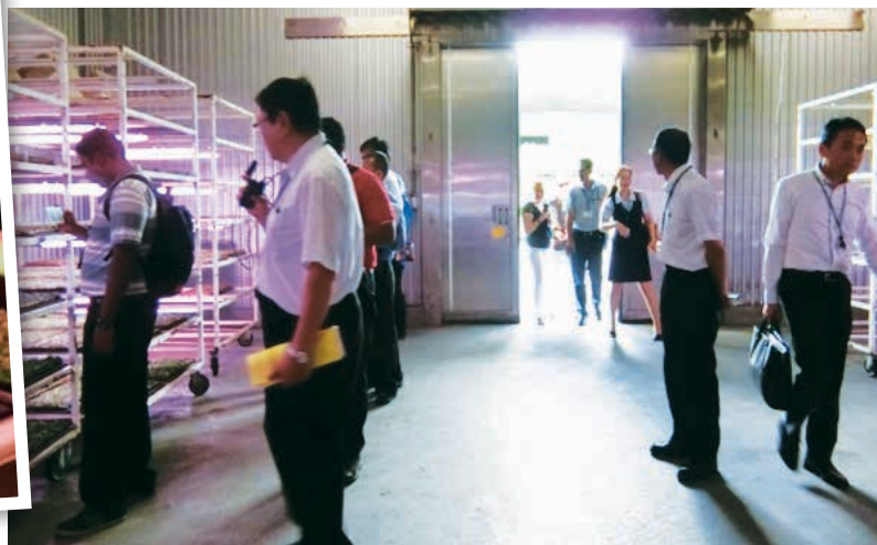
▲ Teknologi khas dengan cahaya tiruan yang diusahakan oleh Koperasi Pertanian Enshu-chuo