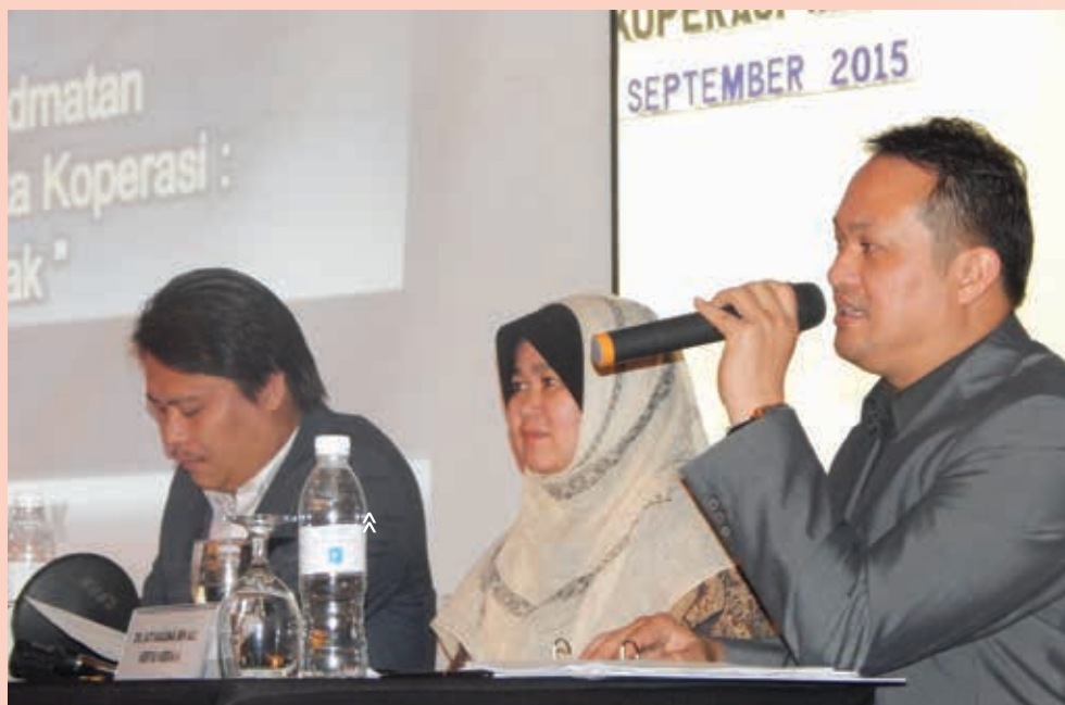
⤴ Antara pembentang kertas kerja