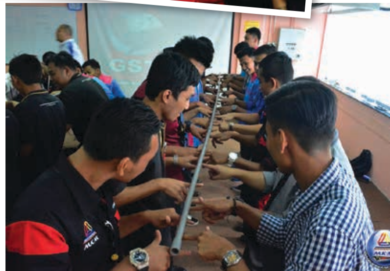
▲ Para pelajar sedang melakukan aktiviti berkumpul berkonsepkan 'fokus'