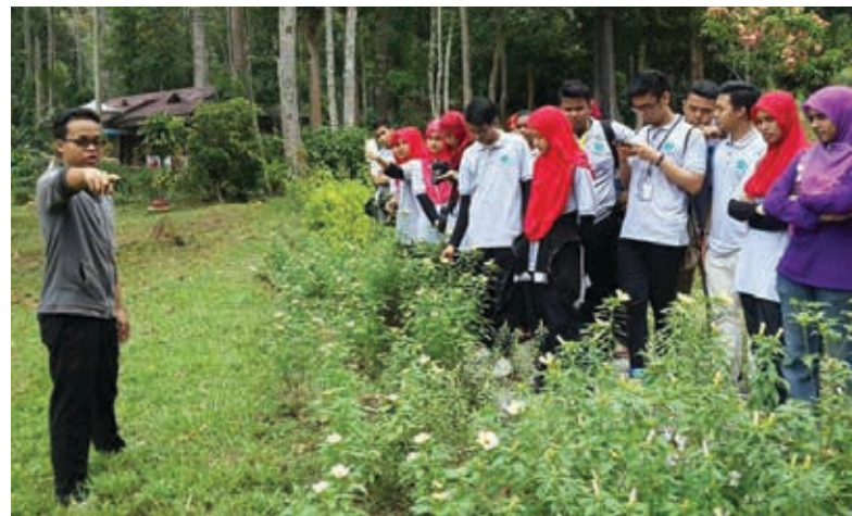
▲ Para pelajar diberi penerangan terlebih dahulu berkenaan tumbuh-tumbuhan di sekitar Taman Botani

Program khidmat masyarakat ini turut melibatkan beberapa orang fasilitator yang terdiri daripada pekerja Taman Botani Negara Shah Alam. Para pelajar telah didedahkan dengan kaedah yang betul dalam penanaman pokok daripada 150 jenis tumbuhan seperti pokok pukul 10 pagi, periuk kera, pokok hanyir ikan dan sebagainya. Para pelajar melahirkan perasaan gembira dengan aktiviti yang dilakukan kerana mereka bukan sahaja mempelajari ilmu penanaman, malah ditekankan aspek penjagaan alam sekitar yang lain seperti kaedah kitar semula, kaedah pelupusan baja dan sebagainya. Malah mereka turut