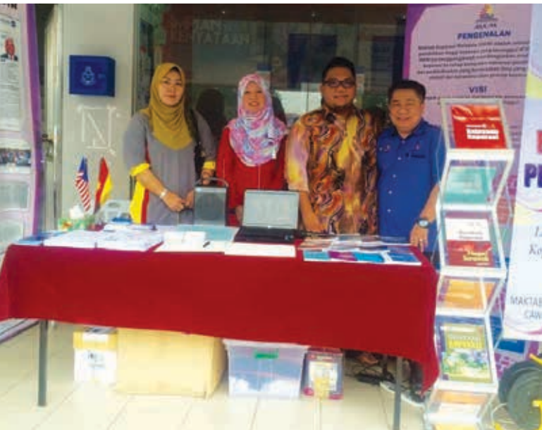
⚡ Kaunter Hari Bersama Pelanggan MKM Cawangan Sarawak di pekarangan Bank Rakyat Cawangan Sri Aman

anggota koperasi, Anggota Lembaga Koperasi (ALK), Jawatankuasa Audit Dalam Koperasi (JAD) dan kakitangan koperasi. Program ini juga terbuka kepada jabatan atau agensi kerajaan yang terlibat dalam penyeliaan koperasi. Antara lain aktiviti dan program yang dijalankan adalah kuiz dan pelanggan bertuah. Program ini telah mendapat sambutan yang menggalakkan dalam kalangan masyarakat setempat. Dengan cara ini, masyarakat akan dapat melihat dengan lebih dekat perkhidmatan yang ditawarkan oleh MKM Cawangan Sarawak.