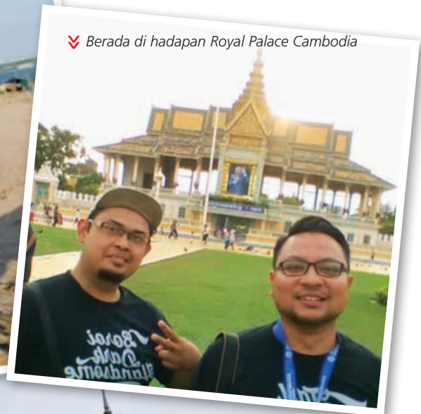
✓ Berada di hadapan Royal Palace Cambodia