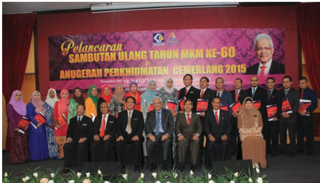
YB Menteri KPDNKK (tengah) bergambar kenangan bersama Penerima-penerima Anugerah Perkhidmatan Cemerlang 2015

Anugerah Perkhidmatan Cemerlang merupakan simbol penghargaan organisasi kerajaan kepada penjawat