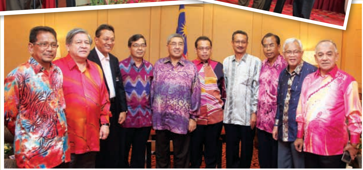
▲ Barisan tetamu jemputan bergambar kenangan bersama YB Senator Dato' Seri Paduka Ahmad Bashah Md. Hanipah