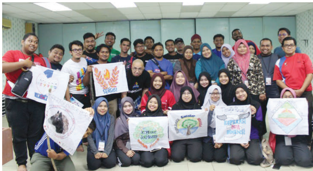
Aktiviti latihan dalam kumpulan