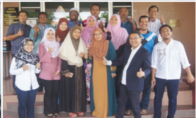
Antara gambar peserta kursus eUsahawan yang dijalankan di MKM Petaling Jaya dan di zon-zon MKM yang lain