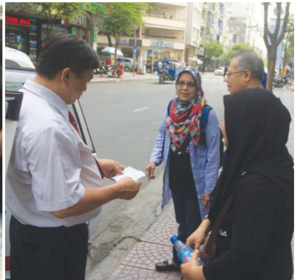
Para peserta sedang mempelajari teknik berurus dengan pemandu Vinnasun Taxi di Vietnam