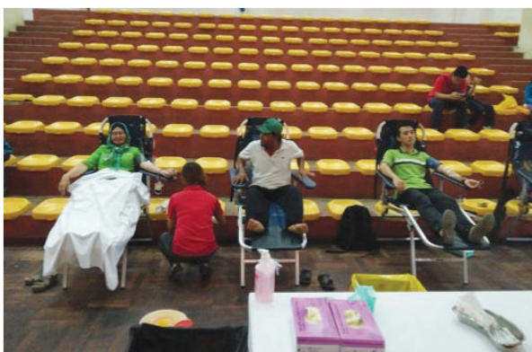
Kempen menderma darah dan pameran keselamatan