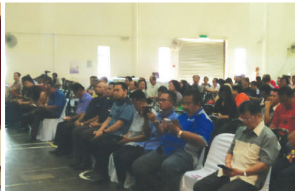
Sekitar majlis perasmian