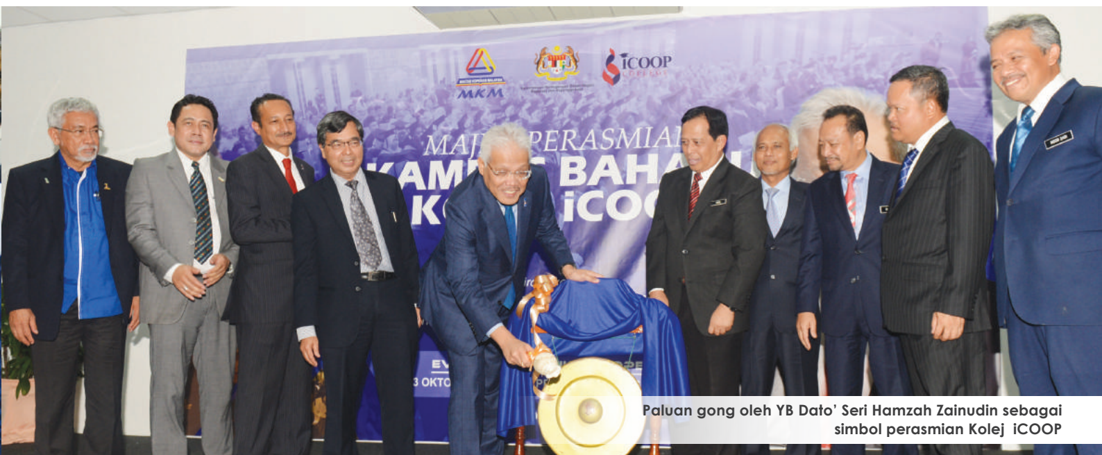
Paluan gong oleh YB Dato' Seri Hamzah Zainudin sebagai simbol perasmian Kolej iCOOP

dengan pusat pengajian tinggi swasta yang lain. Dengan keunikan program yang ditawarkan ketika ini, akan menjadi daya penarik kepada golongan lepasan sekolah dan belia menceburi bidang koperasi yang semakin penting dalam menyumbang kepada Keluaran Dalam Negara Kasar (KDNK) sebanyak RM50 bilion menjelang tahun 2020" .