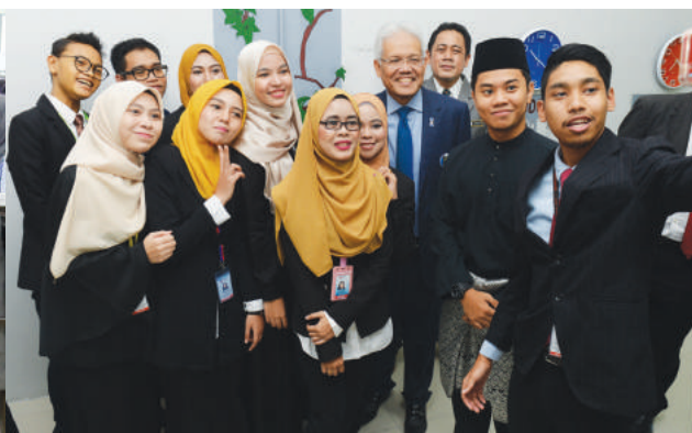
Pelajar iCOOP tidak ketinggalan berswafoto bersama YB Dato' Seri Hamzah Zainudin