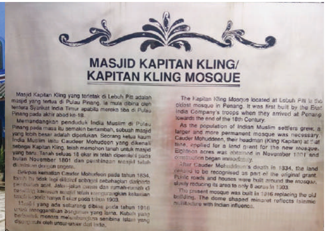
Sejarah Masjid Kapitan Kling