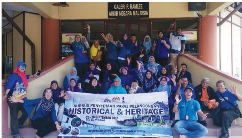
Bergambar kenangan di hadapan Galeri P. Ramlee