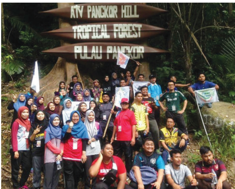
Aktiviti jungle trekking peserta Kem