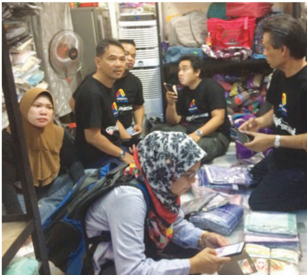
Para peserta sedang melakukan aktiviti berurus niaga dengan pemborong di Juley House, Vietnam

Secara keseluruhannya, program ini memberi ilmu yang sangat bermanfaat kepada para koperator. Pendedahan ilmu yang komprehensif dalam aktiviti pemborongan di Vietnam ini diharap dapat diaplikasikan secara berterusan oleh para peserta. Peluang menerokai bidang perniagaan berpendapatan tinggi dalam bidang pemborongan ini sewajarnya diguna pakai sebaiknya oleh peserta dan koperasi. Semoga koperasi dapat berdaya saing dengan perniagaan lain seiring dengan perkembangan dunia teknologi pada masa kini.