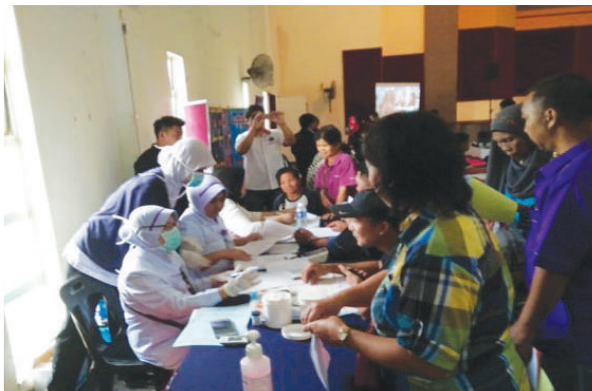
Pemeriksaan kesihatan dan pameran kesihatan