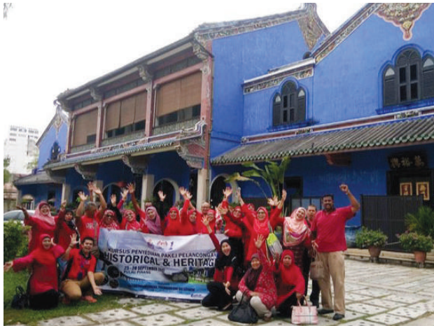
Bergambar di hadapan Cheong Fatt Tze The Blue Mansion

Bagi koperasi yang berminat untuk mendapatkan maklumat lanjut mengenai program seperti ini atau menyertai kursus di bawah Sektor Pelancongan, Penjagaan Diri dan Kesihatan MKM, bolehlah hubungi talian 03-7964 9000 / 9068 atau di alamat email pelancongan@mkm.edu.my .