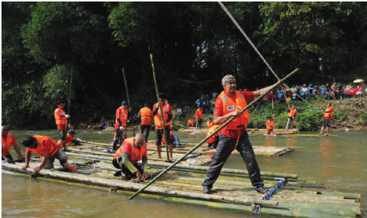
Aksi para peserta perlumbaan rakit