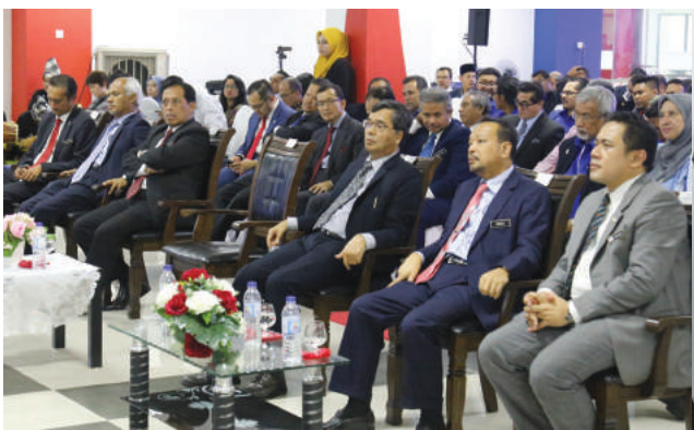
Antara tetamu kehormat yang turut hadir majlis perasmian Kolej iCOOP

Perasmian kampus baharu Kolej iCOOP telah diserikan lagi dengan persembahan kumpulan kompang dan angklung serta persembahan tarian 'Selamat Datang' oleh para pelajar kolej. Selain itu, YB Dato' Seri Hamzah Zainudin turut memotong riben perasmian dan mengadakan program 'walkabout' bersama tetamu yang hadir melawati gerai pameran serta persekitaran kampus baharu Kolej iCOOP yang serba lengkap dan indah.