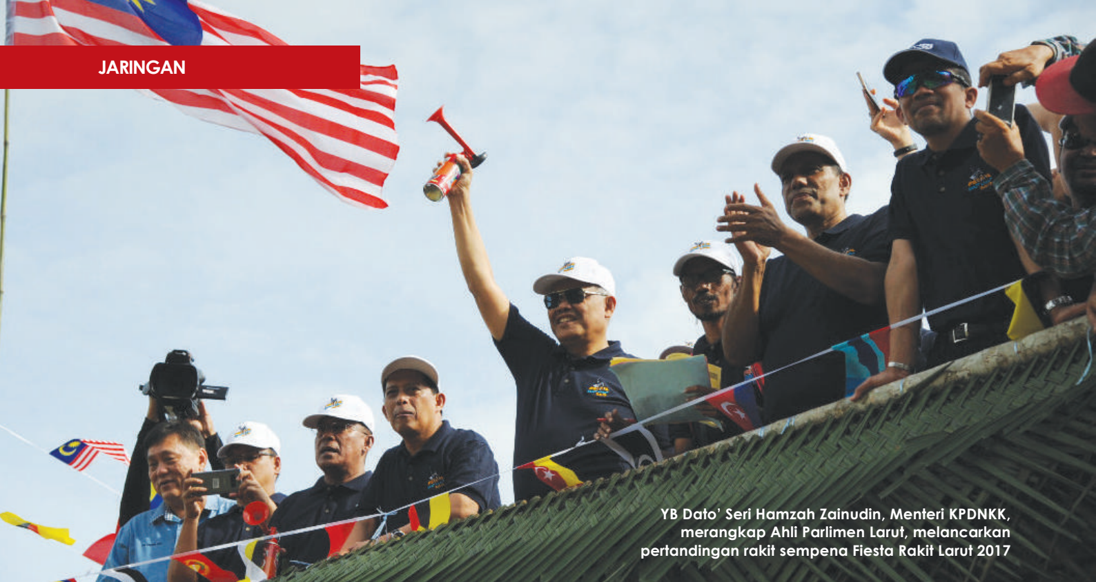
YB Dato' Seri Hamzah Zainudin, Menteri KPDNKK, merangkap Ahli Parlimen Larut, melancarkan pertandingan rakit sempena Fiesta Rakit Larut 2017