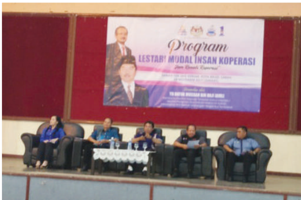
Majlis Perasmian oleh YB Datuk Musbah, Pembantu Menteri kepada Timbalan Ketua Menteri, Menteri Pertanian dan Industri Makanan Sabah

Program ini diserikan lagi dengan kehadiran YB Datuk Musbah bin Hj Jamli, Pembantu Menteri kepada Timbalan Ketua Menteri, Menteri Pertanian dan Industri Makanan Sabah sebagai perasmii program. Program LMIK ini mendapat sambutan yang menggalakkan daripada anggota koperasi dan masyarakat sekitar dengan kehadiran 360 orang peserta. Ia juga dimeriahkan dengan acara cabutan bertuah yang mendapat tajaan daripada koperasi, agensi dan orang perseorangan selain sumbangan daripada Persatuan Penderma Darah Sabah yang menyumbang 30 kampit beras bagi penderma darah pada hari tersebut. Program ini berakhir dengan jayanya seperti yang dirancang dan diharap mencapai objektif pelaksanaannya.