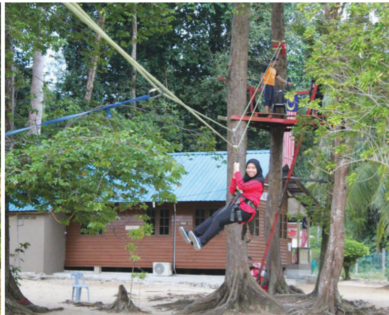
Seorang belia sedang mencuba aktiviti flying fox