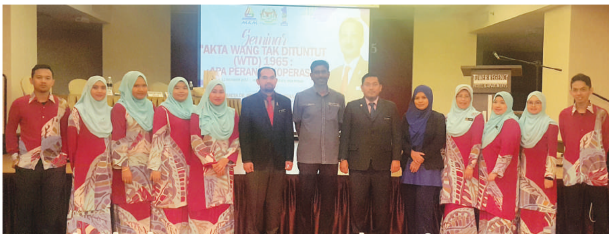
Urus setia Seminar (Zon Tengah) bergambar kenangan bersama empat orang panel penceramah (tengah)

Secara keseluruhannya, program ini dapat mencapai matlamat penganjurannya iaitu bukan sekadar memberikan pendedahan, tetapi juga dapat meningkatkan pengetahuan kepada para peserta betapa pentingnya mengetahui tanggungjawab dan peranan koperasi terhadap WTD. Sehubungan itu, gerakan koperasi perlu mengambil langkah proaktif dengan melaksanakan tatacara atau prosedur serahan Wang Tak Dituntut kerana langkah penguatkuasaan undang-undang telah berjalan dan bagi memastikan koperasi tidak tersalah menggunakan wang yang bukan milik koperasi.