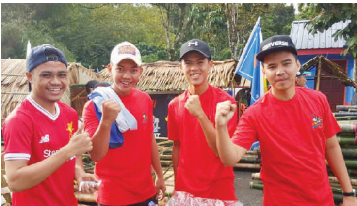
Pasukan pelajar daripada Kolej iCOOP yang turut bertanding kategori perlumbaan rakit