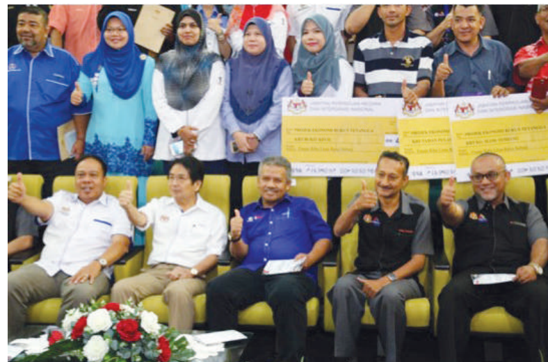
Barisan tetamu kehormat (duduk barisan hadapan) dan para peserta kursus Penubuhan dan Pengukuhan Koperasi Rukun Tetangga

Seramai 105 orang peserta rukun tetangga telah mengikuti program ini dan telah mendapat banyak ilmu pengetahuan serta perkongsian pengalaman dari koperasi rukun tetangga yang berjaya iaitu Koperasi Rukun Tetangga Telaga Batin Terengganu Berhad yang menjadi inspirasi utama kepada penubuhan koperasi komuniti ini.