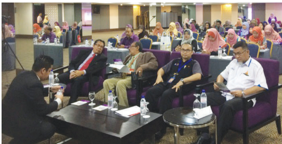
Antara peserta Bicara Ilmu yang turut hadir

Secara keseluruhannya, Bicara Ilmu ini dilihat berjaya mencapai objektif yang diinginkan. Semoga program seperti ini dapat diteruskan dan menjadi satu platform yang berkesan dalam melahirkan koperator yang melibatkan diri dalam bidang koperasi. Maklum balas positif yang diperoleh daripada para peserta juga boleh diambil sebagai penanda aras agar program yang diadakan kelak berjaya memberi manfaat kepada golongan sasar yang ingin dicapai. Diharapkan agar segala ilmu yang diberikan dapat dilaksanakan dengan jayanya dan menjadikan modal insan yang menjadi contoh kepada koperasi sedia ada.